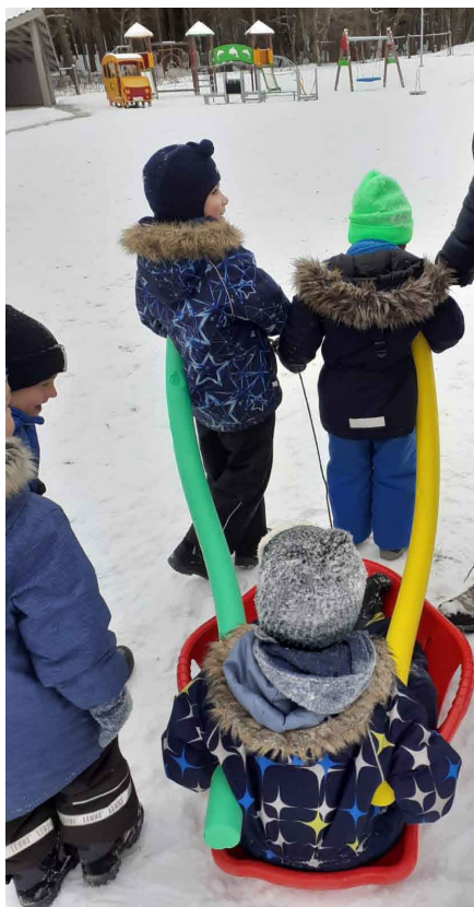
Sniega dienu izbauda PII "Saulīte" bērni.

Pasaules sniega dienas svinēšana jau kļuvusi par tradīciju mūsu izglītības iestādē. Arī šogad, neskatoties uz situāciju valstī, laika apstākļi un sengaidītais sniegs bērniem deva iespēju izbaudīt dažādus ziemas priekus.