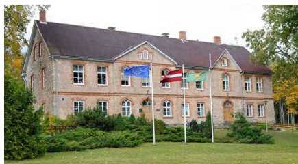
Turpinājums no 1.lpp

Šis ir laiks, kas maina mūs, mūsu vērtības un ikdienu. Tomēr Priekuļu novada pašvaldības darba prioritāte vienmēr ir bijusi un būs iedzīvotāju labklājība. Jāsaka paldies aktīvajiem iedzīvotājiem, kuri nāk ar saviem ierosinājumiem par to, kas viņu ikdienas dzīvi novadā padarītu vēl labāku. Aplūkojot pieņemto budžetu redzam, ka šajā gadā liela daļa finanšu līdzekļu tiks novirzīti tieši infrastruktūras uzlabošanai un attīstībai. Domājot par iedzīvotāju drošību un ērtībām pārvietojoties ar kājām, velosipēdu vai auto, šī gada laikā tiks renovēti gan ceļi un ielas, gan gājēju ietves. Tāpat, ieguldījumi paredzēti arī citās jomās, lai dzīvot un strādāt Priekuļu novadā iedzīvotājiem būtu vēl ērtāk un patīkamāk.