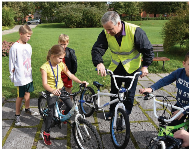
CSDD pārstāvis veic velosipēdu tehnisko apskati un sniedz konsultācijas par nepieciešamajiem uzlabojumiem