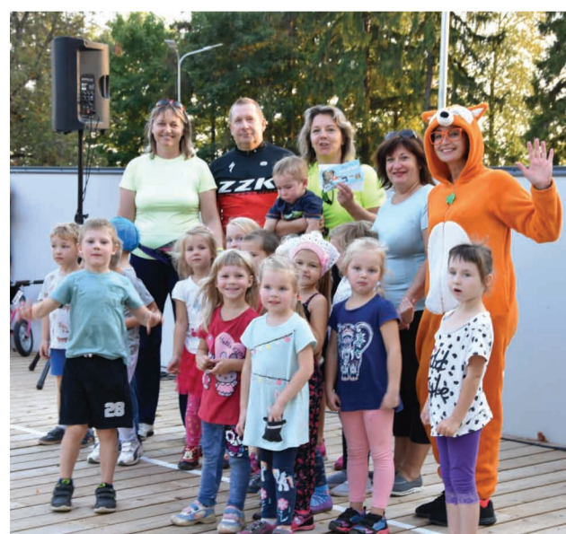
"Sprīdīšu" grupa priecīgi par laimēto dāvanu – baseina "RIFS" apmeklējumu