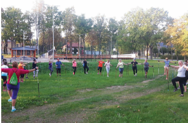
Nūjotāji aktīvi iesildās pirms pārgājiena