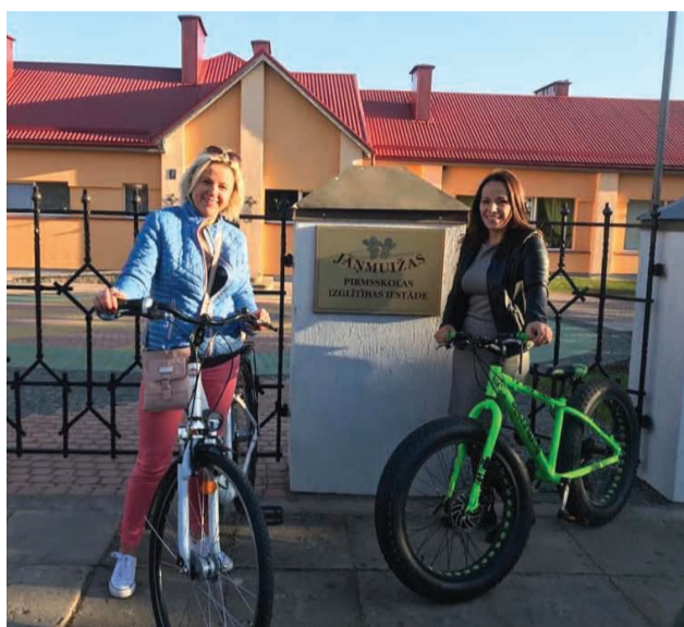
Ar Jāņmuižas PII darbinieki uz darbu devās ar velosipēdu