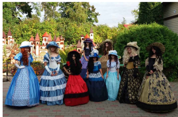
Leļļu muzejā meitenes varēja pārgērbties karaļa galma personāžu tērpos un iejusties princešu tēlos.