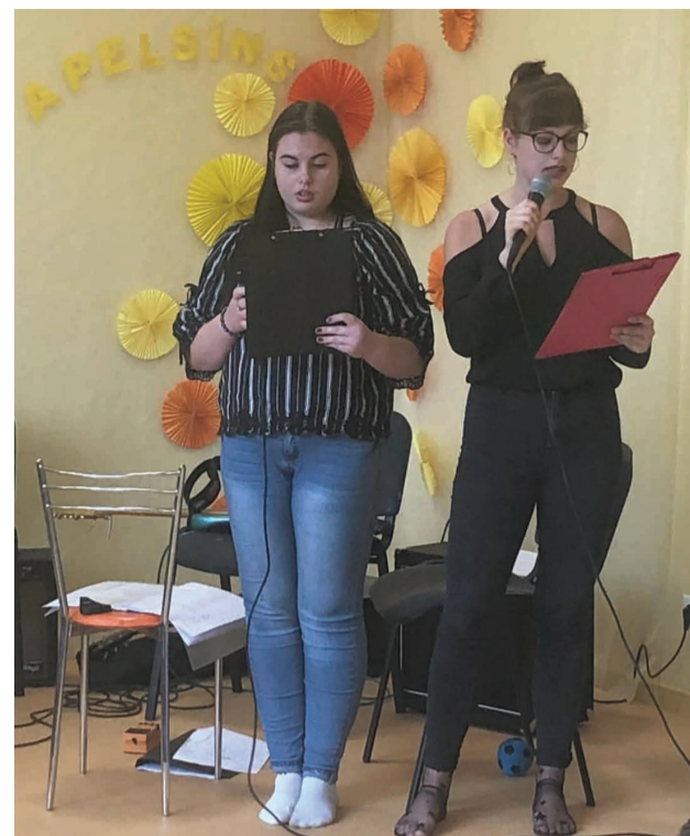
Jaunieši paši veidoja scenāriju un vadīja JC “Apelsīns” dzimšanas dienas pasākumu.

Liepas jauniešu centrs “Apelsīns” šajā septembrī svinēja savu 11. dzimšanas dienu. Jaunā desmitgade ir sākusies jaunās, skaistās, gaišās un izremontētās telpās.