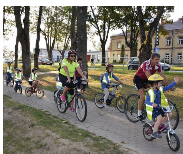
"Mežmalīņa RIPO" ikgadējā velobrauciena dalībnieki dodas cauri Priekuļiem