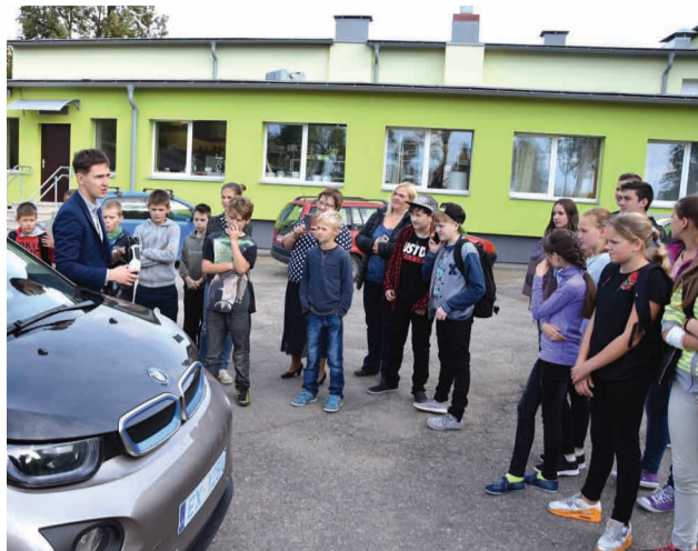
Liepas pamatskolas skolēnu izziņošā stunda par elektromobiļa priekšrocībām