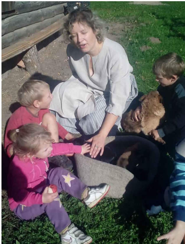
Mazie ceļotāji “Kalāčos”.

GNP Ceļotāju dienās, kas notika 15. un 16. septembrī, piedalījās arī E. Veidenbauma memoriālais muzejs “Kalāči”, piedāvājot ceļojumu laikā, kad bērni šajās mājās pavadīja Eduards un Kārlis Veidenbaumi. Aktivitātes bija paredzētas ģimenēm ar bērniem, lai iepazītos ar “Kalāču” apkārtni, lai gūtu priekšstatu par dzīvi laukos pirms 145 gadiem: kādi ir ganu pienākumi, kādām īpašībām viņiem jābūt, kā spēlējās un mācījās bērni tolaik, kādi izskatījās burti.