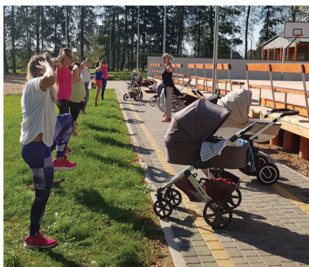
Jauno māmiņu vingrošanas nodarbība Sporta birzītē Priekuļos