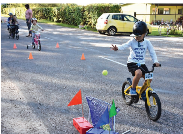
Braucot ar velosipēdu trāpīt bumbiņu grozā nebija viegls uzdevums

Priekuļu novada pašvaldības informatīvais izdevums "Priekuļu novada vēstis". Bez maksas izdevums. Iznāk reizi mēnesī. Metiens – 2000. Izdevējs: Priekuļu novada pašvaldība, Cēsu prospekts 5, Priekuļi, Priekuļu pag., Priekuļu nov. Tālr. 64107871. Kontaktinformācija: Priekuļu novada pašvaldības