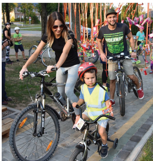
Velobrauciena noslēgums cauri saldumu vārtiem