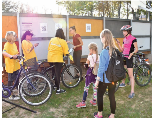
Velo orientēšanās pasākuma dalībnieki iepazīstas ar spēles noteikumiem