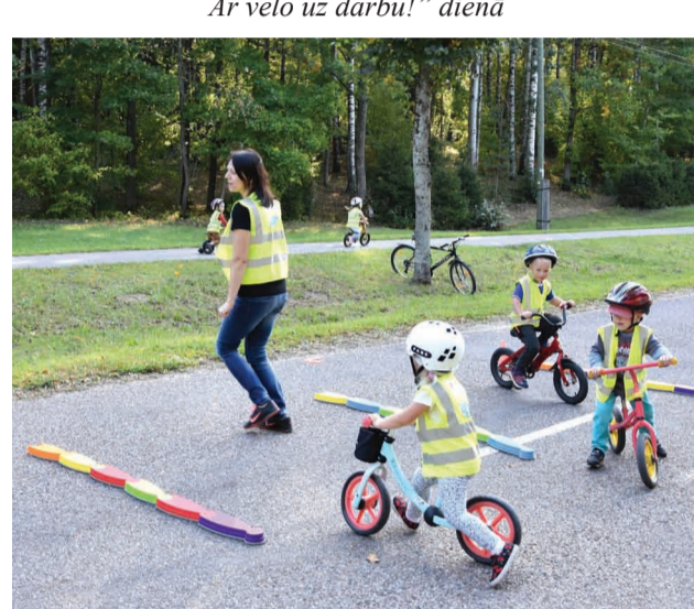
Velo veiklības aktivitāšu laikā PII "Mežmalīņa" bērni izbrauc šķēršļu posmu