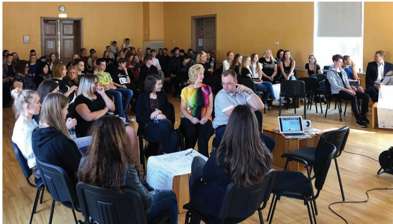
“Jaunatnes politikas stratēģijas izstrāde” noslēguma konference Cēsu bērnu un jauniešu centrā “Spārni”

Eiropas Savienības programmas “ERASMUS+: Jaunatne darbībā” 3. pamatdarbības “Strukturētais dialogs: jauniešu un jaunatnes politikas veidotāju tikšanās” projekta “ Jaunatnes politikas stratēģijas izstrāde ” Nr.2016-1-LV02-KA347-001061 ietvaros divu gadu laikā paveikts daudz, lai astoņos sadarbības novados – Amatas, Jaunpiebalgas, Līgatnes, Pārgaujas, Cēsu, Priekuļu, Raunas un Vecpiebalgas – divu gadu laikā izstrādātu vidēja termiņa plānošanas dokumentu “Jaunatnes politikas stratēģija 2019.-2023. gadam”, kas balstīts pētījumā par esošo situāciju darbā ar jaunatni katrā no pašvaldībām, apzinot stiprās puses, iespējas un uzlabojamās jomas.