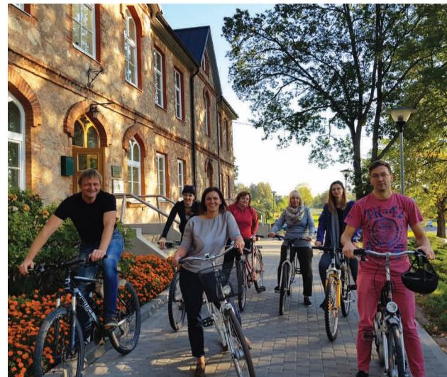
Priekuļu novada pašvaldības darbinieki "Ar velu uz darbu!" dienā