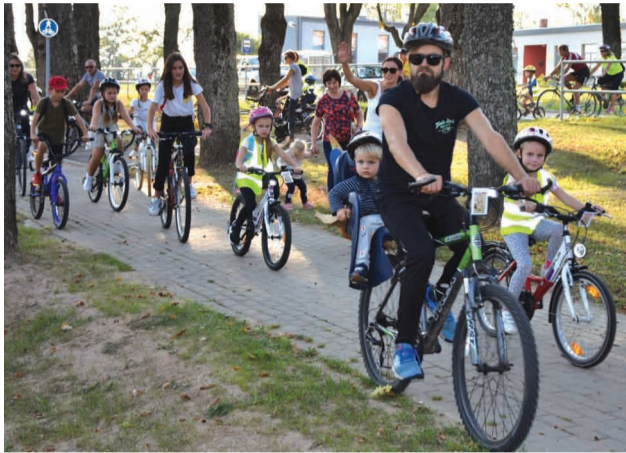
"Mežmaliņa RIPO" velobrauciens bērniem kopā ar vecākiem