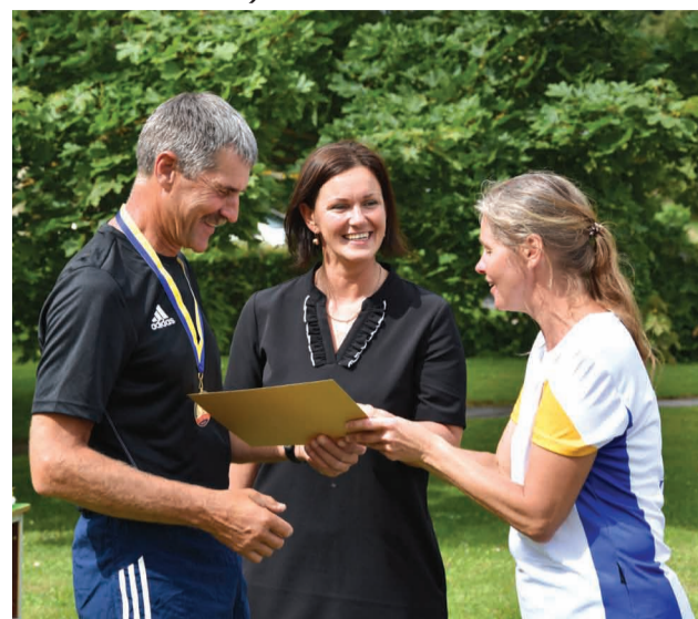
Priekuļu novada sporta koordinatoram pasniedz medaļu un apliecinājumu par apbalvojumu “Lāpnesis 2018”

Miera skrējienis ir skrējienis no sirds uz sirdi, kurā kopā satiekas liels un mazs, sportists un nesportists, kājāmgājējs un riteņbraucējs. Skrējienā ar mīlu, sirsnīgu smaidu tā dalībnieki dāvā savu labo gribu, labo domu, prieku cilvē-