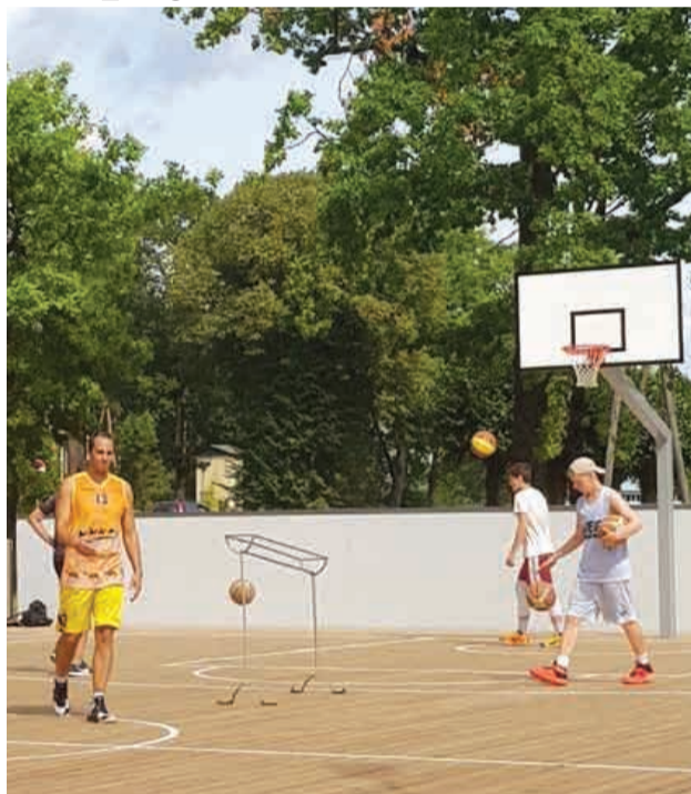
Soda metienu konkurss jaunajā basketbola laukumā

Strītbola turnīrā piedalījās 11 komandas. Bija atbraukuši Latvijas augstākās līgas basketbola spēlētāji no Valmieras, kas ieguva 1.vietu strītbola turnīrā. Vietējā komanda no Priekuļiem ieguva 2.vietu.