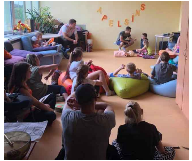
Latvijas Sarkanā Krusta pārstāvji pastāsta par pirmās palīdzības sniegšanas principiem

Kopīgajā darbnīcā apzinājām gan savas labās, gan sliktās īpašības, kā arī īpašības, kuras mums nepatīk citos, piemēram; smēķēšanu un pāri darīšanu dzīvniekiem. Meklējām risinājumus šīm problēmām. Tapa unikāls uzmetums stikla smēķēšanas būdai, kurā no ārpuses redzams, kādu kaitējumu smēķēšana nodara cilvēkam. Radās ideja vispasaules dzīvnieku aizsardzības biedrībai, kurā brīvprātīgie rūpētos par pamestajiem un vardarbībā cietušajiem. Ierosinājums veidot ūdenspistolū brigādi, kura cīnītos pret smēķētājiem mums apkārt. Iespējams, ka šīs idejas nākotnē palīdzēs atrisināt dažādas sociālas problēmas.