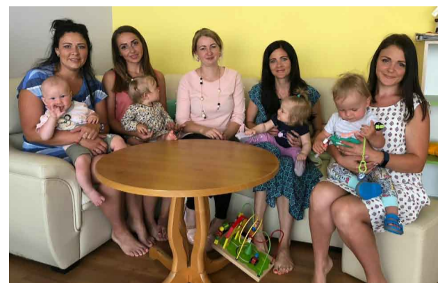
Priekuļu novada jaunās māmiņas priecīgas kopā

Jūnija sākumā Priekuļu novada jaunās māmiņas tikās Priekuļu bērnu dienas centrā “Zīļuks”, lai pabūtu kopā un profesionālas vizāžistes vadībā mācītos uzklāt dienas grīmu.