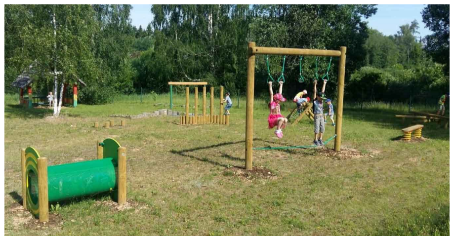
Bērni trenējas jaunajās iekārtās

Kopējās projekta izmaksas – EUR 9855,40, no tām publisko finansējumu veido EUR 8123,94.