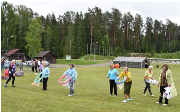
Spēlējot ķeseļbolu VII Senioru sporta spēlēs

Spītējot laika apstākļiem – stiprajam lietum un drēgnajam vējam – 12.jūnijā Priekuļu slēpošanas – biatlona trasē vairāk nekā 70 novada seniori no visiem Priekuļu novada pagastiem piedalījās VII Priekuļu novada Senioru sporta spēlēs.