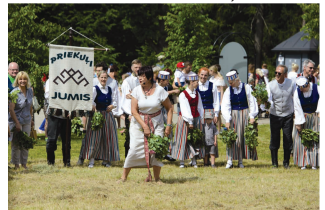
Liepu pirtsslodu rituāls