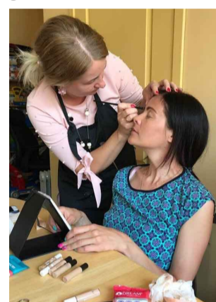
Priekuļu novada jaunās māmiņas apgūst grīma uzklāšanas pamatus

Jūnija sākumā Priekuļu novada jaunās māmiņas tikās Priekuļu bērnu dienas centrā “Zīļuks”, lai pabūtu kopā un profesionālas vizāžistes vadībā mācītos uzklāt dienas grīmu.