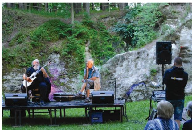
Dabas koncertzāle Lielajā Ellītē