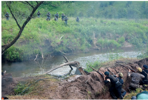
Čēsu kauju rekonstrukcija pie dzelzceļa tilta pāri Raunas upei