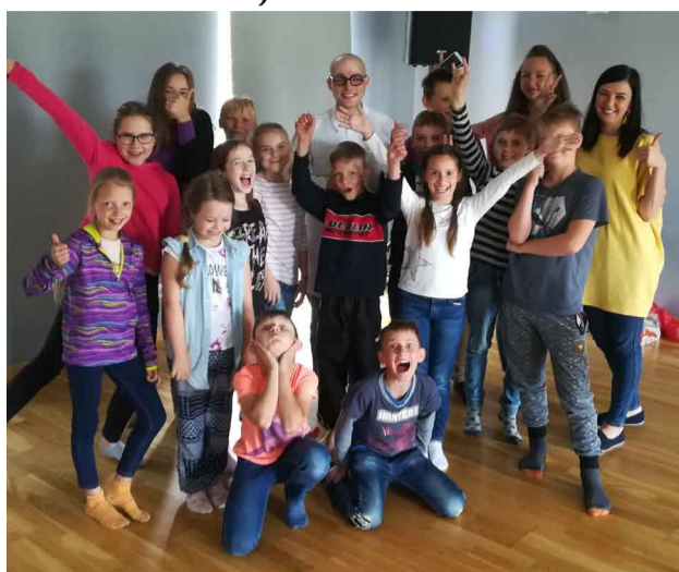
“Vasaras skoliņas” noslēguma diena

Priekuļu “Radošuma nedēļā” bērni un jaunieši apguva pirmās palīdzības prasmes kopā ar ciemiņiem no biedrības “Latvijas Sarkanais krusts”, skatījās izglītojošu īsfilmu par drošību vasarā, kā arī zīmēja afišas, kas mudinās arī citus domāt par drošību vasarā. Tapa gleznas, kas rotās Priekuļu jauniešu centra jaunās telpas Priekuļos Raiņa ielā 8, un gatavoti dekori no dažādiem dabas materiāliem. Vissirsnīgākā “Radošuma nedēļas” aktivitāte izvērtās rābarberu un piparmētru ievārījuma vārīšana un ievārījuma burciņu dekupēšana kopā ar Priekuļu senioriem. Lielākaī daļai bērnu šī bija pirmā pieredze ievārījuma vārīšanā. “Radošuma nedēļas” noslēgumā viesojās jaunsargi ar dažādām komandas saliedēšanas un stratēģijas uzdevumu spēlēm.