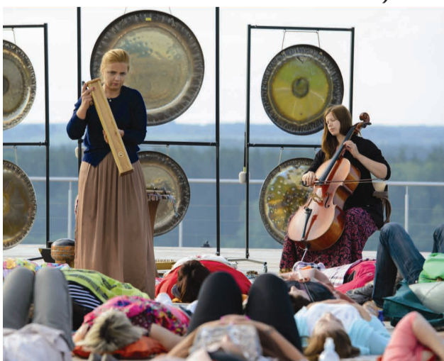
Svētku modināšanas rituāls Liepas muižā