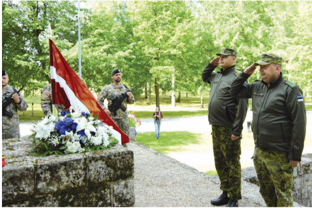
Igaunijas karavīri noliek ziedus pie pieminekļa brīvības cīņtājiem Liepā