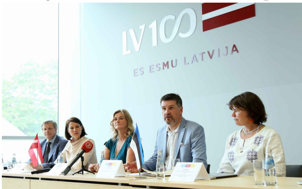
Akcijas "Apceļosim Baltijas muižas – svinēsim kopā!" preses konference

Šogad no 24.maija līdz 16.septembrim notiks apceļošanas akcija "Apmeklēsim Baltijas muižas – svinēsim kopā!", kuru organizē četras Baltijas valstu piļu un muižu asociācijas un kurā piedalīsies 131 pils/muiža: 45 no Latvijas, 55 no Igaunijas un 31 no Lietuvas.