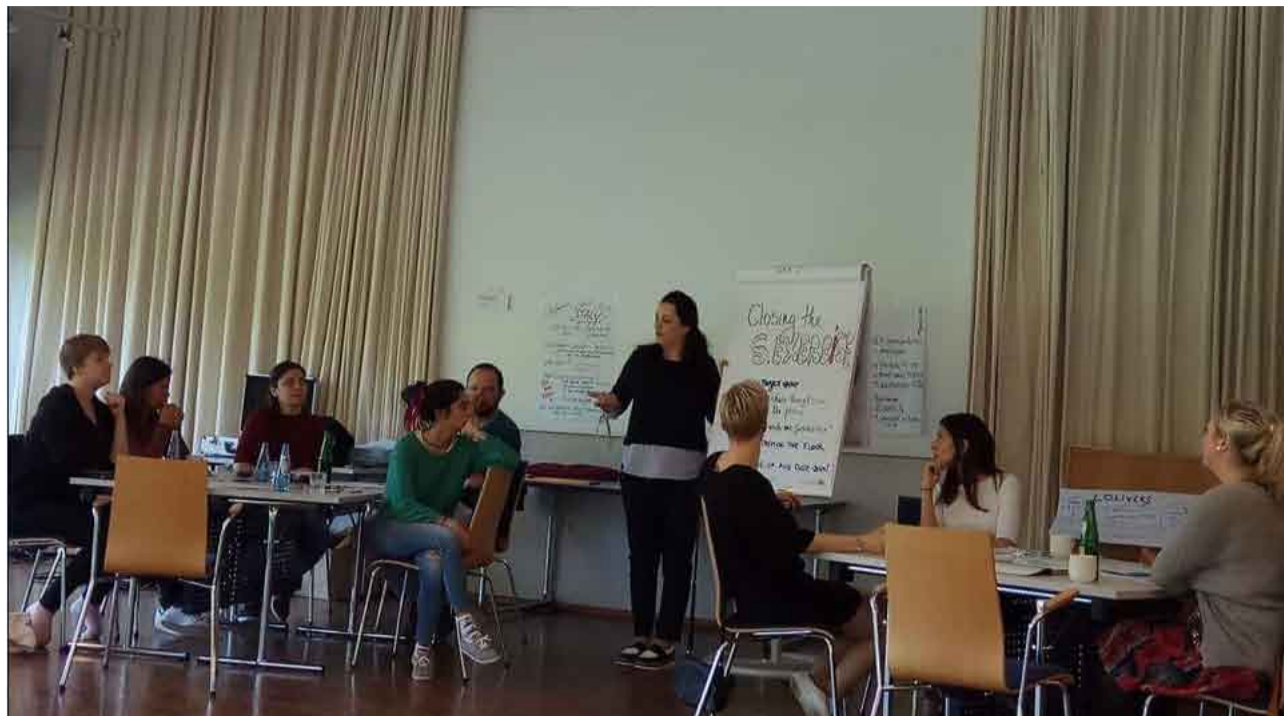
Iegūta lieliska pieredze un jauni kontakti apmaiņas projektā Vācijā

Šajā pavasarī, no 24. līdz 28. aprīlim, Bonnā, Vācijā, notika starptautisks mācību kurss "BiTriMulti training course" jaunatnes darbiniekiem, kas vēlas veidot jaunatnes apmaiņas projektus. Piedalījās 26 jaunatnes darbinieki no kopumā 17 dažādām valstīm – Spānijas, Turcijas, Horvātijas, Grieķijas, Somijas, Nīderlandes, Ungārijas un citām, tai skaitā arī no Latvijas, no Priekuļiem. Dalībnieku vecuma amplitūda bija teju 30 gadi, un tas mācību procesu padarīja vēl interesantāku. Visi bija ļoti komunikabli un gatavi dalīties savos pieredzes stāstos. Skolotāju profesijas pārstāvji bija tikai trīs – pārējie dalībnieki bija no dažādām jauniešu organizācijām un brīvprātīgā darba ar jauniešiem pārstāvji.