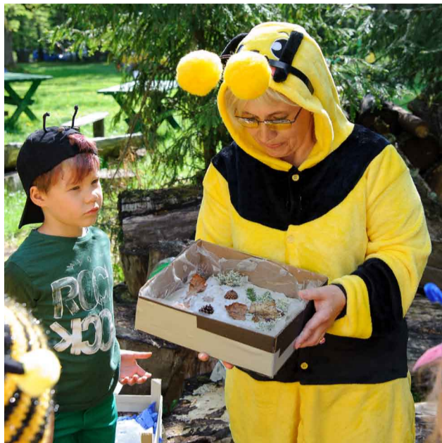
Veidojot gleznu no mūsu dabas dārgumiem.

Ar šādu devīzi š.g. 16.maijā no visām Priekuļu novada izglītības iestādēm pirmsskolnieki ieradās Veselavas muižas parkā, lai kopā satiktos novada pirmsskolnieku sporta svētkos.