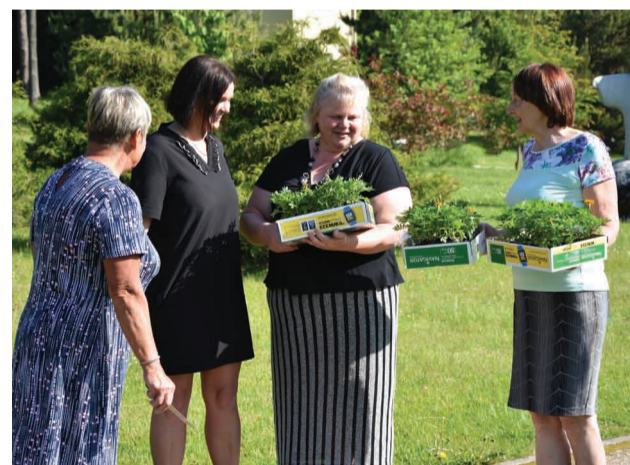
VSIA "Sertifikācijas un testēšanas centrs" darbinieki izaudzējuši vairākus desmitus samtenes

Aicinājumam atsaucās Priekuļu novada pašvaldība, izglītības iestādes, kā arī VSIA "Sertifikācijas un testēšanas centrs". Priekuļu PII "Mežmaliņa" un Jāņmuižas PII audzēkņi savus izaudzētos samteņu stādīņus iestādīja Saules parkā. VSIA "Sertifikācijas un testēšanas centrs" jau uzziedējušās samtenītes iestādīja pie Priekuļu novada