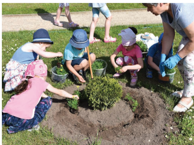
Priekuļu novada PII audzēkņi stāda samtenes Saules parkā

Priekuļu novada pašvaldība pavasarī aicināja iestādes, uzņēmumus un privātpersonas iesaistīties akcijā un audzēt samtenes, ar kurām izdaiļot ne tikai Saules parka, bet arī piemājas un citu novada vietu puķu dobēs.