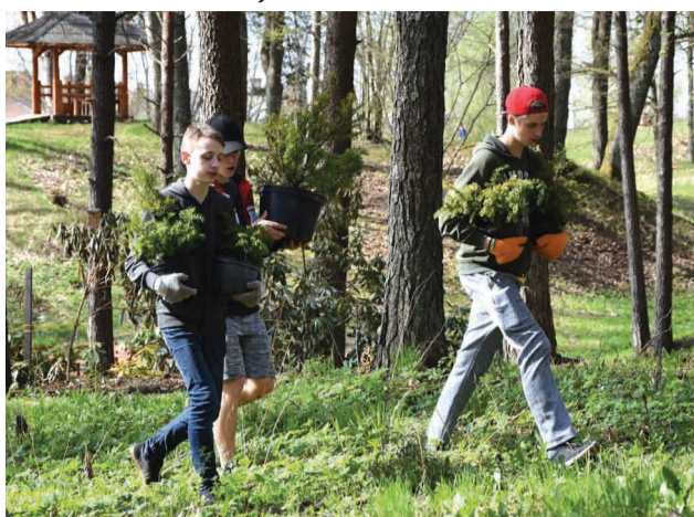
Priekuļu vidusskolas audzēkņi dodas iestādīt īves Saules parkā