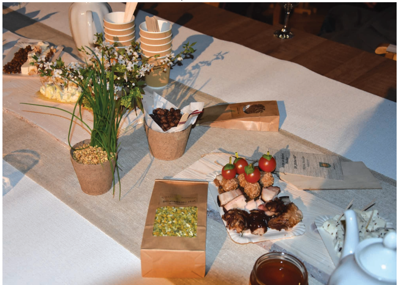
Baltā galdauta svētki ar Priekuļu novadā saražoto produkciju.

Jāņmuižas bērnu darbs šobrīd ir vienīgā pašvaldības iestāde Jāņmuižā, tādēļ savā ziņā jūtam atbildību un patiesu vēlmi savā dzīvē iesaistīt arī Jāņmuižas iedzīvotājus, lai viņi zina un jūt, ka ir šeit gaidīti, piederīgi, svarīgi. Tas ir nozīmīgi arī mums pašiem, tādējādi audzinām bērniem cieņu un mīlestību ne tikai pret mūsu valsti, bet arī Jāņmuižu. Un viņi to mīl. Tomēr Jāņmuiža ir ne tikai mūsu burvīgās meža takas un Gauja, stadions, veikals un bērnu darbs. Pati galvenā tās vērtība ir cilvēki. Cilvēki,