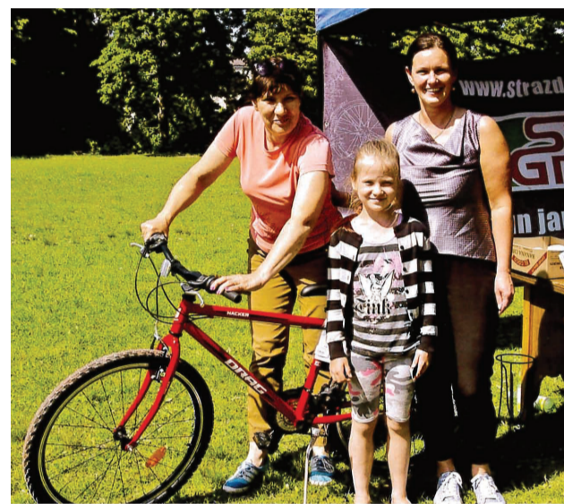
Galvenās balvas – velosipēda – ieguvēja

Nu jau 13. reizi tika rīkots tradicionālais, atjaunotais skrējieni "Apkārt Liepai". Neskatoties uz karsto laiku, skrējienā piedalījās vairāk kā 200 dalībnieki no dažādiem Latvijas novadiem. Īpašs pateiktis sportistiem, kas mēroja garu ceļu uz skrējieni – no Balviem, Gulbenes, Varakļāniem, Madonas. Skrējienā piedalījās arī sportisti no Balkāniem. Tiesa gan, šoreiz no Balkāniem, kas atrodas Viļakas novadā.