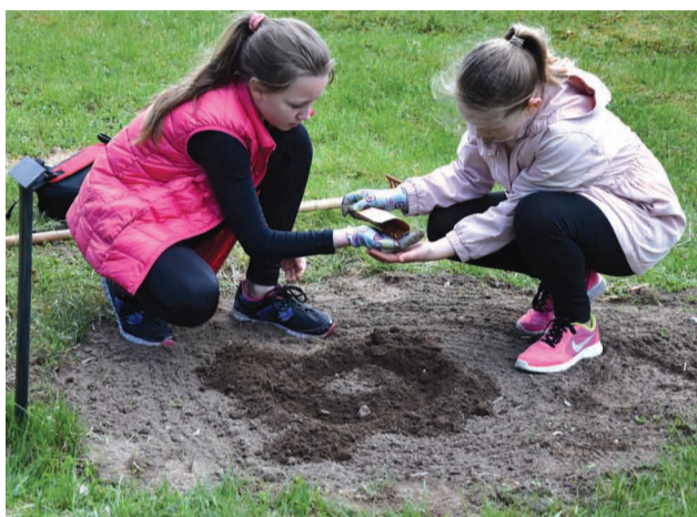
Saules parka puķu dobēs augs arī skolēnu iesētie pākšaugi un graudaugi

2., 3.maijā Priekuļu vidusskolā norisinājās projektu dienas. Gatavojoties Latvijas svētkiem katrā klase plānoja un īstenoja kādu labo darbu. Klases piedalījās gan savas tuvākās apkārtnes (klases, skolas), novada centra sakopšanā, gan čakli pastrādāja citur novada teritorijā – Veselavas muižā, E.Veidenbauma muzejā. Skolēni apmeklēja Cēsu dzīvnieku patversmi, kur parūpējās gan par dzīvnieku mājvietu tīrīšanu, gan veda pastaigā suņus.