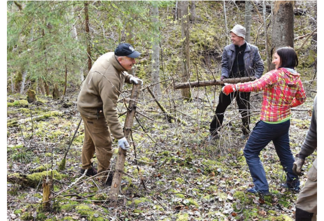
Veselavā no apauguma un kritālām attīrīta vēsturiskā Šarlotes taka uz Rauni

piemiņai, kā arī uzlikti jauni soliņi un atkritumu urnas gar gājēju celiņu. Savukārt Veselavā tika attīrīta vēsturiskā Šarlotes taka uz Rauni, to atbrīvojot no krūmu apauguma un kritālām.