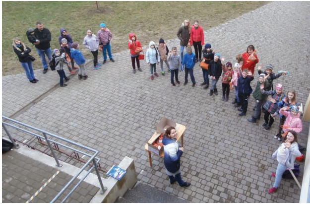
Balvas sadalītas, gaidīsim nākamo gadu!

Bibliotēku nedēļa Priekuļu pagasta bibliotēkā jau trešo reizi noritēja sportiskā noskaņā – notika novadpētniecības konkurss ar fotoorientēšanās elementiem un citiem zināšanu pārbaudījumiem.