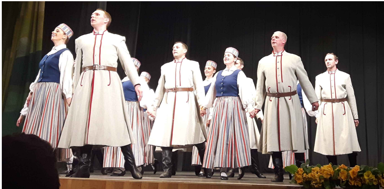
Deju kolektīvs "Jumis"

Noslēgušās Cēsu deju apriņķa skates. Šogad žūrija bija stingra un prasīga, taču tas neliedza Priekuļu novada kolektīviem parādīt savu dejotprasmi un iegūt šādus rezultātus: