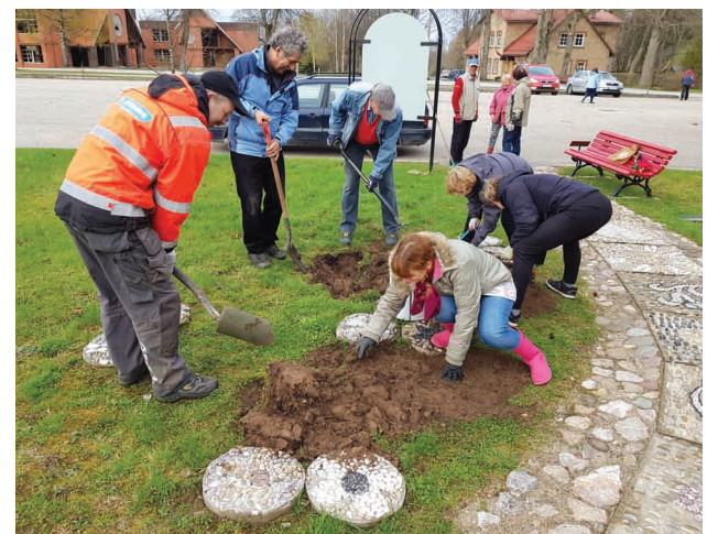
Liepas veselības takai blakus atjauno puķu dobi

Foto: Ieva Fogle un PII "Saulīte" arhīva Ieva Fogle, Sabiedrisko attiecību speciāliste