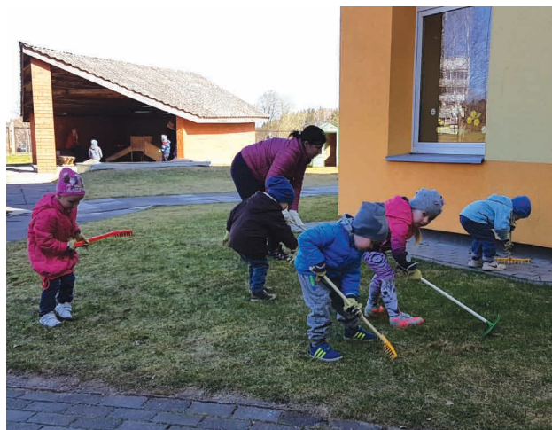
Mazie talkotāji Liepas PII "Saulīte" sagrābj zālienu

Lielās talkas dienā, 28.aprīlī, Liepā tika sakopti apstādījumi Lielās ellītes apkārtne, atjaunota puķu dobe pie Veselības takas, uzstādīti trīs jauni karogu masti pie pieminekļa Latvijas Atbrīvošanas cīņās kritušo karavīru