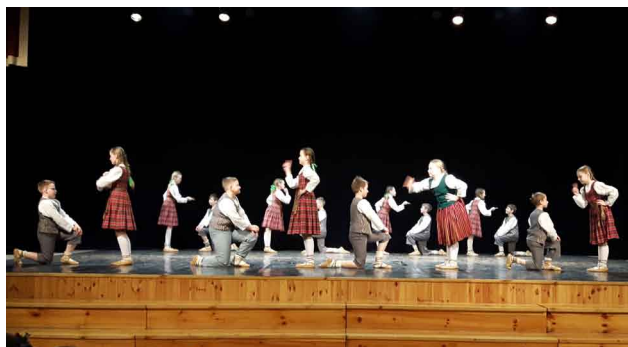
Mirkļis no deju skates