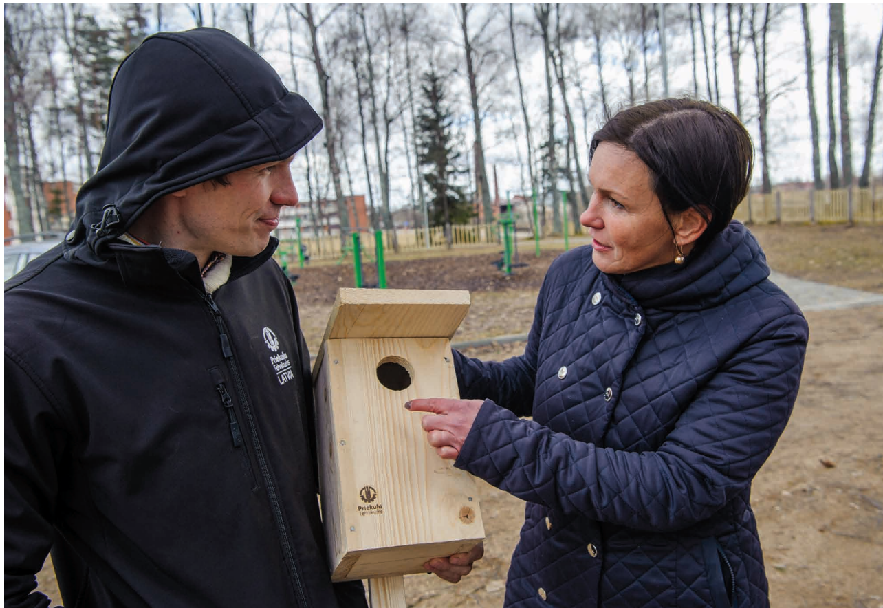
Arī Priekule tehnikums atsaucās aicinājumam izgatavot putnu būrišus, kurus uzstādīja Sporta birzītē

Dienas kļūst arvien garākas, rīti – gaišāki. Rītos dzirdama putnu čivināšana. No siltām zemēm Latvijā atgriezās gājputni.