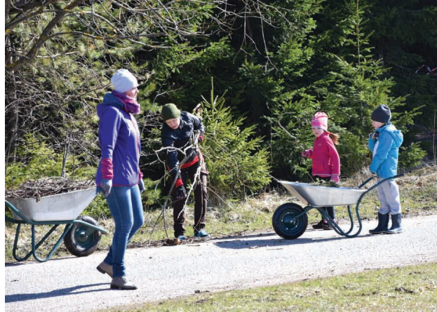
Veselavas PII bērni ar vecākiem sakopj bērnu dārza apkārtni

Jau desmito gadu Latvijā notiek Lielā Talka. Priekuļu novadā oficiāli tika pieteiktas 4 talkošanas vietas, kur norisinājās sakopšanas un labiekārtošanas darbi.