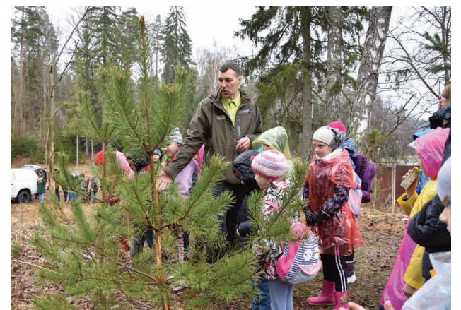
Lūk kā meža zvēri mīlojas ar meža augiem, apēdot to mizu!

Meža dienā meža nozares speciālisti no dažādiem uzņēmumiem un organizācijām izglītoja skolēnus par mežu un dabu. 14 dažādās pieturās bērni tika iesaistīti spēlēs, atrakcijās un izzinošos uzdevumos. Viņiem bija iespēja iepazīt, kādi koki, augi un dzīvnieki sastopami Latvijas mežos, ar kādu tehniku un kā strādā mežos, kā arī vairāk uzzināt par meža kopšanu un audzēšanu. Pieturas palīdzēja organizēt un vadīt SIA "Meždaris", SIA "Vickers", Valsts meža dienests, Cēsu zemessardzes 27. kājnieku bataljons, Dabas aizsardzības pārvalde, ISA-AKK biedrība, MĪB "Meža konsultants", LVMI "Silava", Lienītes komanda, Cēsu Tehnoloģiju un Dizaina vidusskola, Meža konsultāciju un pakalpojumu centrs, Priekuļu tehnikums, Meža apmācību centrs "Pakalnieši", Anna Lutere un ZINOO Cēsis. Pēc izietā maršruta un paveiktajiem uzdevumiem, Priekuļu tehnikuma audzēknes bērņus cienāja ar gardām un siltām pankūkām, kuras cepa turpat uz vietas, parādot ikvienam interesentam, kā to paveikt.