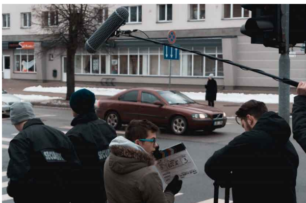
Filmēšanas procesā.