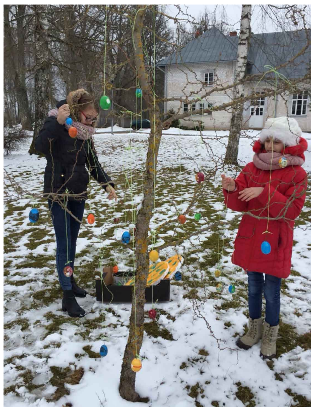
Jaunieši izgrezno Mārsnēnu tautas nama parku

2018.gada 1.aprīlī Mārsnēnu Jauniešu centrs sadarbībā ar Mārsnēnu Tautas namu aktīvi piedalījās Lieldienu svinēšanā. Jaunieši bija izgreznojuši Mārsnēnu tautas nama parku, kā arī sagatavojuši vairākas stafetes ar dažādiem uzdevumiem un veiklības pārbaudījumiem gan lieliem, gan maziem. Stafetu noslēgumā Lieldienu zaķis bija sarūpējis un paslēpis dažādus gardumus Lieldienu svinētājiem. Tos svinību viesi un stafetu dalībnieki atrada un notiesāja, gaidot apbalvošanu. Trampalīns saka lielu paldies brīvprātīgajiem un visiem dalībniekiem, kas kopīgiem spēkiem noorganizēja jautras Lieldienu lustes.