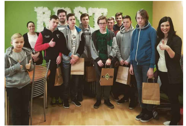
Ar Priekuļu Jauniešu centru “REST[e]” iepazīstas Priekuļu tehnikuma pirmā kursa audzētāji.