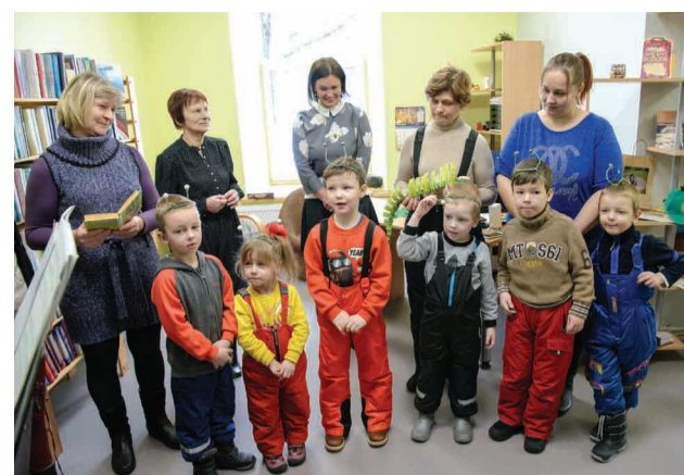
Arī “grāmatu tārpiņi” ieradusies aplūkot jauno bibliotēku Mārsnēnos

Bet... gāja laiks, un telpas kļuva šauras, bet cilvēku alkas pēc kultūras un kopā būšanas auga. Tādēļ par pašu saziēdoto naudu tika uzcelts Baltais nams, kurš jau no 1935. gada aicināja ļaudis gan uz lielo balles zāli, gan