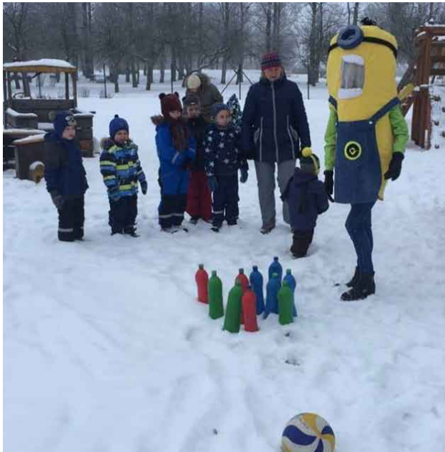
Rotaļas un stafetes kopā ar Minjonu Sniega dienā Mārsnēnos