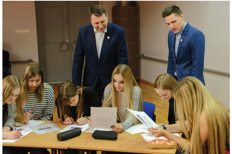
Valsts prezidents piedalās izglītības programmas "Iespējamā misija" akcijā "Iedvesmo mācīties!" Priekuļu vidusskolā