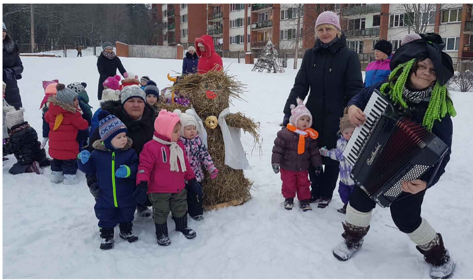
Meteņdienā Liepas PII “Saulīte” bērnus sagaidīja Salmu Metenīti.