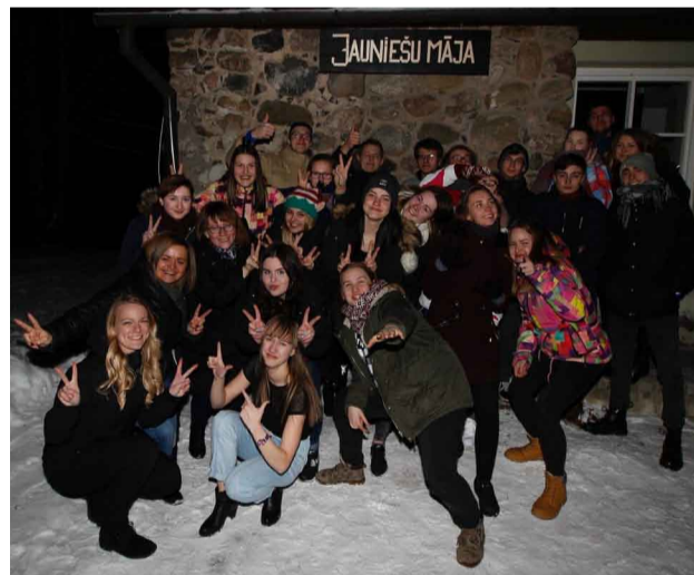
“Ideju nakts” dalībnieki no Valmieras pilsētas, apkārtnes novadiem un Vācijas.

Pirmajā no mūsu stafetēm bija jāizveido papīra mājas makets no jau izdrukātas skices. Šajā stafetē bija jāiedomājās, ka izvēlētais makets ir Jauniešu ideju māja. Galvenais