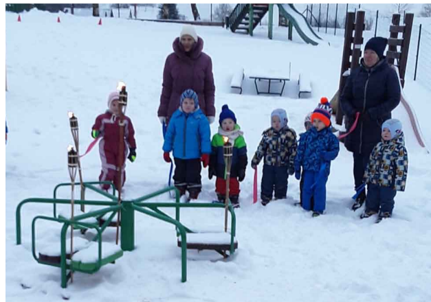
Kad olimpiskā lāpa ideģta un karogs pacelts, mazie sportisti var sākt sacensības

Šogad ziema mums ir uzdāvinājusi sniegu, ko labprāt izmantojam organizējot Veselavas bērnu dārza bērniem ziemas olimpiskās spēles visas nedēļas garumā, lai bērni apgūtu pirmās iemaņas sportošanā ziemā. Ar šīm aktivitātēm ieinteresējam visus sekot līdz divdesmit trešajām olimpiskajām spēlēm Dienvidkorejas pilsētā Phjončhanā. Kas zina, varbūt pēc gadiem kāds no mūsu bērniem kļūs par talantīgu sportistu – slidotāju, slēpotāju, biatlonistu vai bobslejistu.