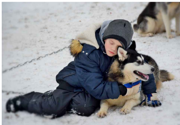
Kopā ar haskiju aizmirst ikdienas steigu, ļauties mirklim un pozitīvajām emocijām

Liepas pamatskolas bērniem bija iespēja paplašināt savas zināšanas par haskiju vēsturi, to izcelsmi un raksturu, kā arī iepazīties ar kinologa profesiju. Jebkura vecuma bērni varēja suņus samīļot, sabužināt un uzņemt jaukas fotogrāfijas. Bērni arī vizinājās ragavās, ko vilka haskijs