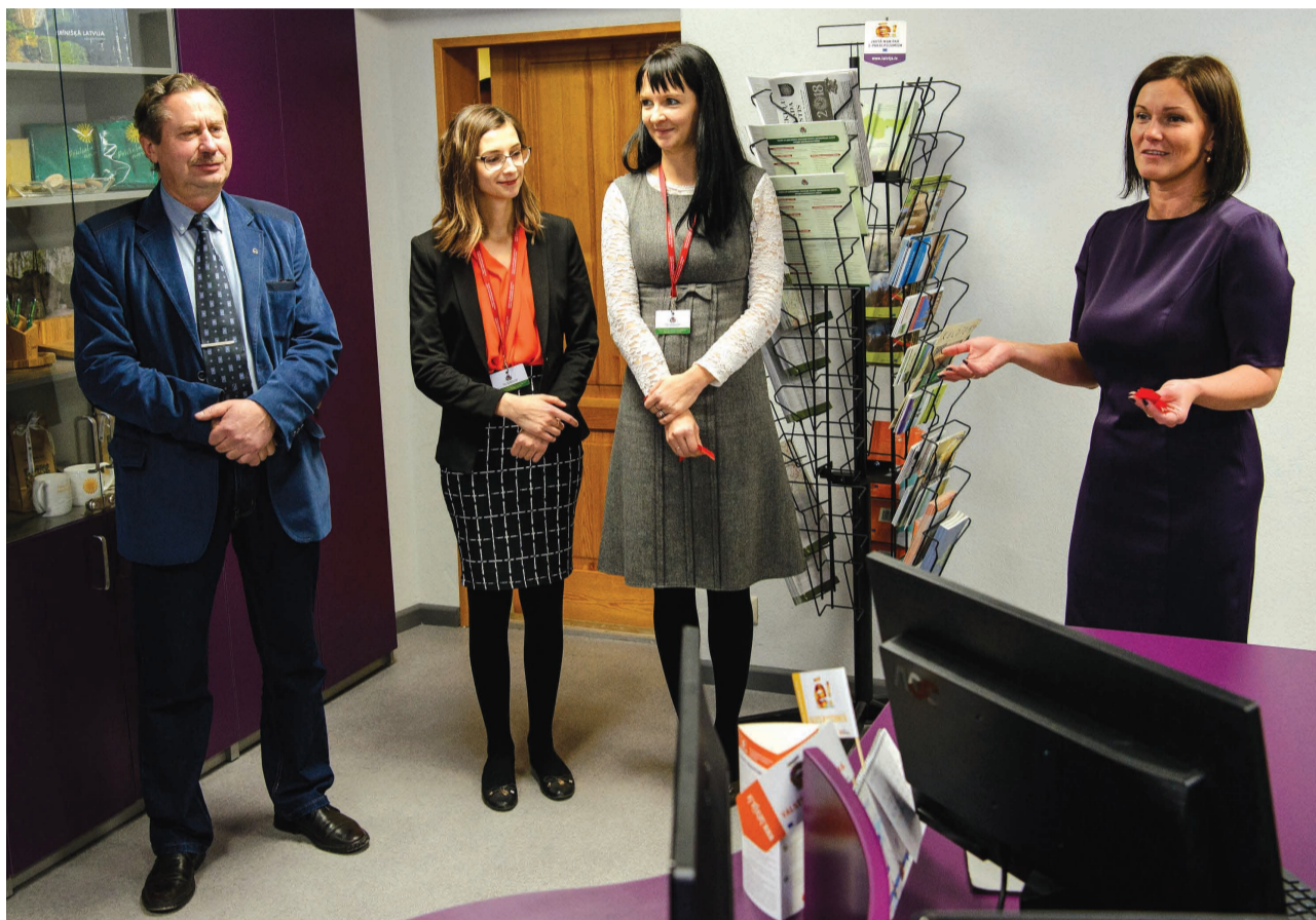
Laiņi lūgti jaunajā valsts un pašvaldības vienotajā klientu apkalpošanas centrā Priekuļos!

2017.gada 29.decembrī darbu uzsāka valsts un pašvaldības vienotais klientu apkalpošanas centrs (VPVKAC), kas atrodas Priekuļu novada pašvaldībā Cēsu prospektā 5, Priekuļos 101.kabinetā.