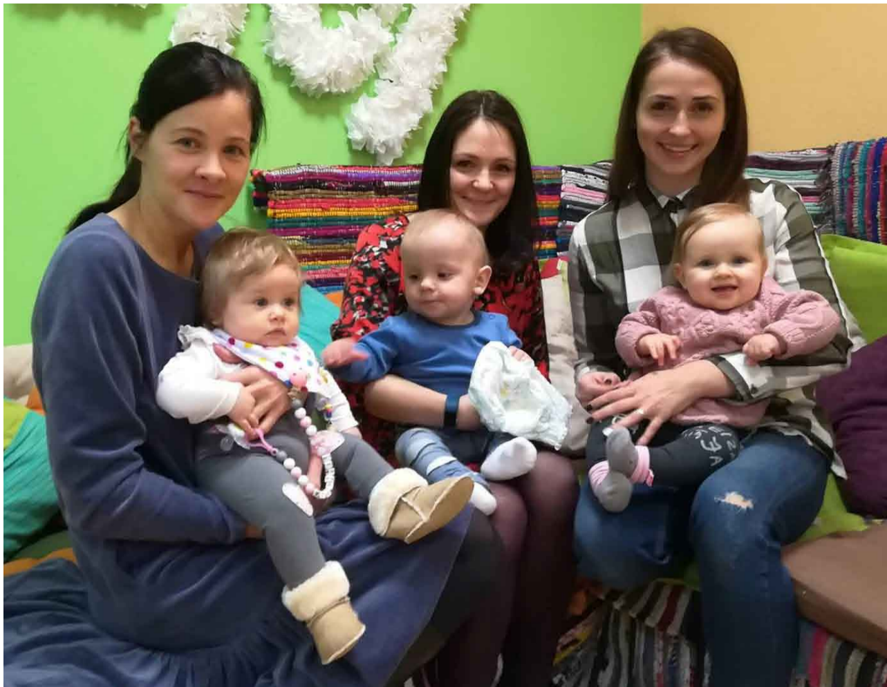
Māmiņas kopā ar mazuliem pirmajā tikšanās reizē.

Priekuļos, jauniešu iniciatīvu centrā "RESTe", janvārī tikās novada jaunās un topošās māmiņas. Tikšanās reizēs māmiņas iepazīnās viena ar otru un dalījās pieredzē, devās uz Priekuļu bērnu rotaļu un attīstības centru "Zīlūks" un iepazīnās ar tā darbību un centra vadītājiem. Kopīgi tika pārspriestas nākamās tikšanās reizes un domāti nākotnes plāni.