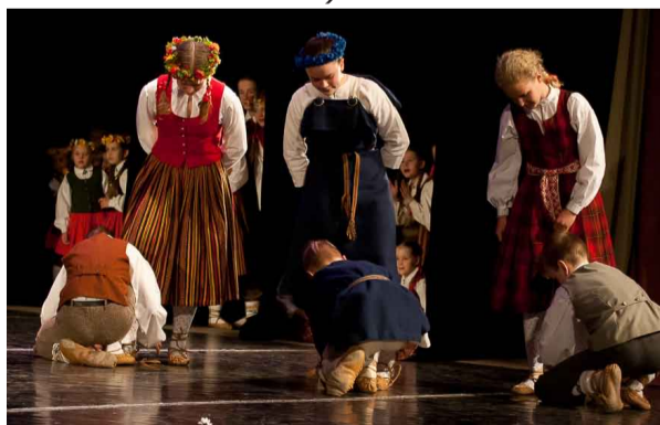
Ar dejām ieskandina jauno gadu.