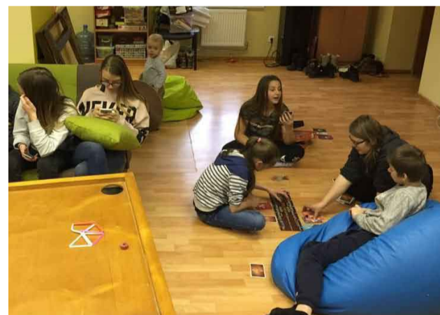
Pēc labi padarīta darba var atpūsties, uzspēlējot spēles

Beidzot ilgi gaidītā diena ir klāt! Sestdien, 27.janvārī, Mārsnēnu jauniešu centrs "Trampalīns" pārcēlās uz savām jaunajām telpām (bijušās Mārsnēnu pagasta Bibliotēkas telpās). Jaunieši pulcējās jau plkst. 11.00 un sāka čakli strādāt. Nepilnu divu stundu laikā bijā visu sanesuši un tad varēja sākties lielā kārtošana. Pēc grūti padarītā darba, jaunieši cepa un mielojās ar gardām tostermaizītēm un spēlēja dažādas spēles!!! Vēlamies teikt lielu paldies Priekuļu novada pašvaldībai par iespēju jauniešiem darboties savās telpās!!