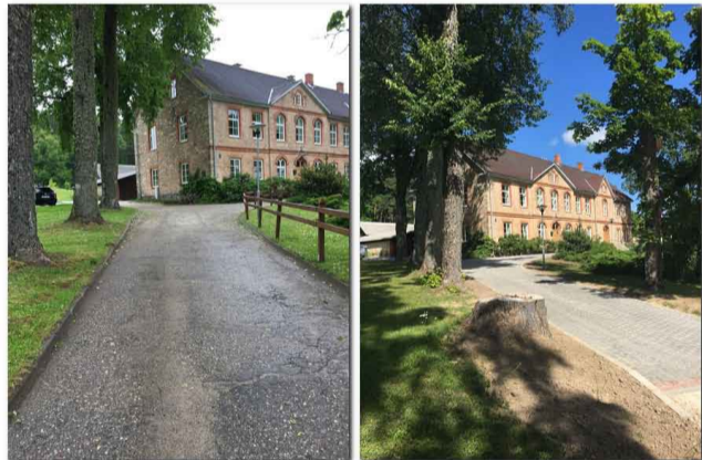
Iebraucamais ceļš uz Priekuļu novada pašvaldības ēku pirms un pēc seguma maiņas

Priekuļu novada pašvaldības apmeklētāju ērtībām ir izbūvēts stāvlaukums 8 automašīnām pie Priekuļu novada pašvaldības ēkas Cēsu prospektā 5. Paralēli tam tika nomainīts pašvaldības ēkas jumta segums un veikti piebraucamā ceļa un pagalma labiekārtošanas darbi. Projekta ietvaros ir ieklāts jauns bruģakmens segums 346 m 2 platībā un izbūvētas jaunas kāpnes pie abām ēkas galvenajām ieejām.