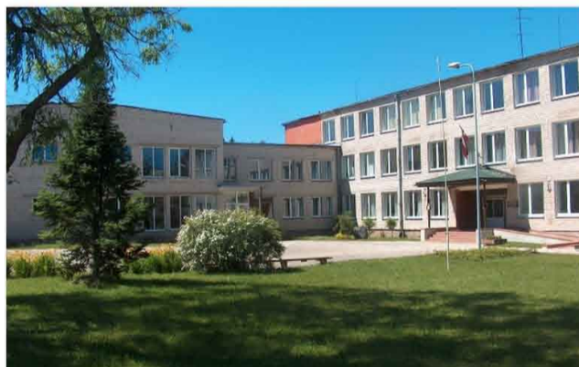
Liepas pamatskola pirms un pēc ēkas siltināšanas

Izbūvēts ielas apgaismojums gar Eduarda Veidenbauma ielu un ceļu Cēsis-Smiltene posmā līdz "Pūpolu" mājām, par ko esam saņēmuši pateicības vēstuli no māju iedzīvotājiem.