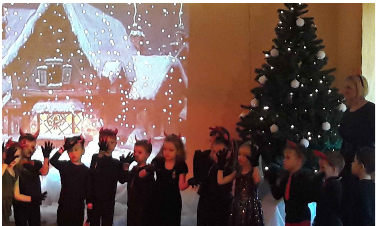
Arī velniņi ieradusies pateikties eglītei, lai gaidītu ciemos atkal nākamajā gadā