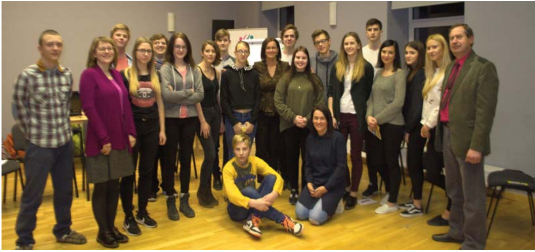
Gandarīti par iegūtajām zināšanām, kā pašiem sagatavot jauniešu apmaiņas projektus