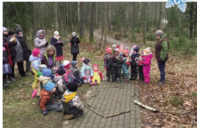
Praktiskās nodarbības ārā ar teātri mežā