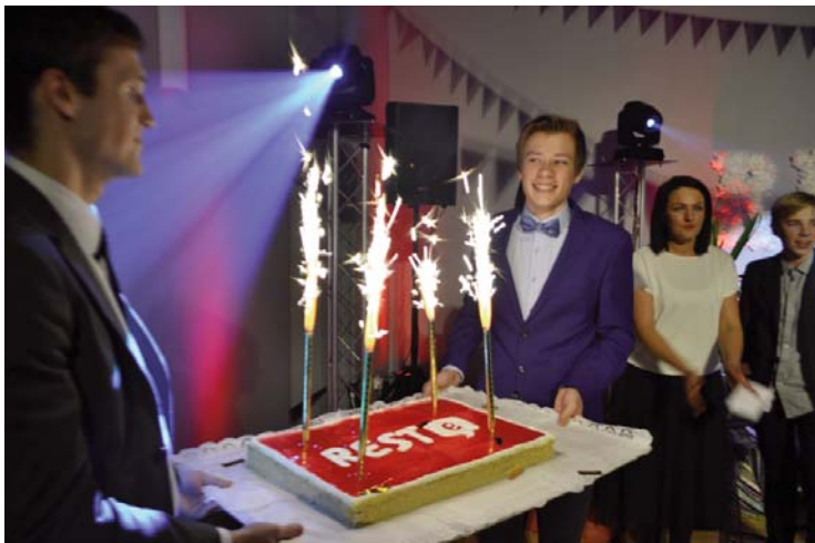
Svētku izskaņa ar mirdzošiem konfeti un svētku torti

Pasākumu kuplināja arī muzikāli priekšnesumi. Ar savu skanīgo balsi visus priecēja kādreizējā jauniešu centra apmeklētāja un “X