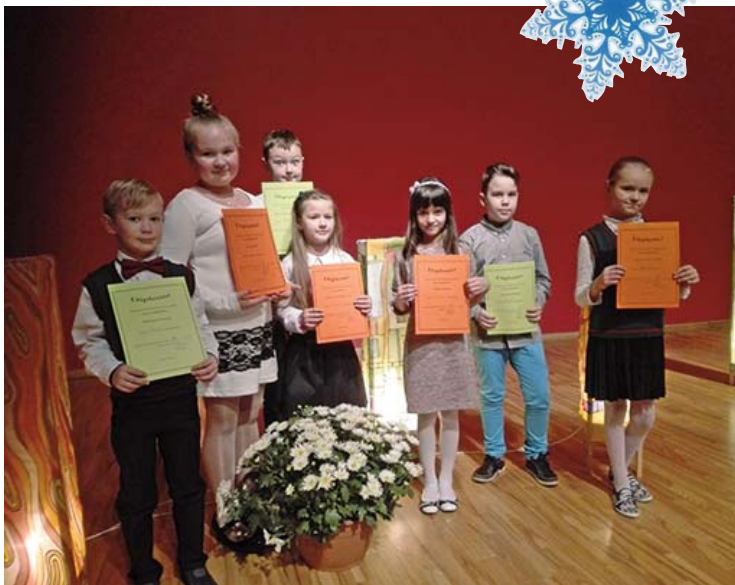
Priekuļu vidusskolas un Liepas pamatskolas finālisti gandrīz visi ieguva lielā stāstnieka titulus

Stāstnieku konkursa fināls Rīgas Latviešu biedrībā pulcēja 117 dalībniekus no visas Latvijas. Sarīkojumā bērni stāstīja gan stāstus, kurus mantojuši ģimenē, gan tos, kas radušies sadarbojoties ar skolotājiem, kas