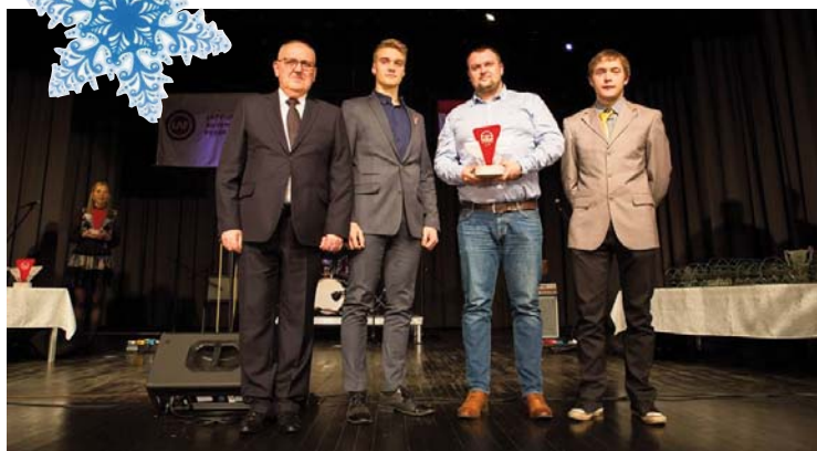
Priekuļu tehnikums iegūst 2. vietu LMT Autosporta akadēmijas Skolu kartingu kausā

LMT Autosporta akadēmija Sabiedriskās attiecības