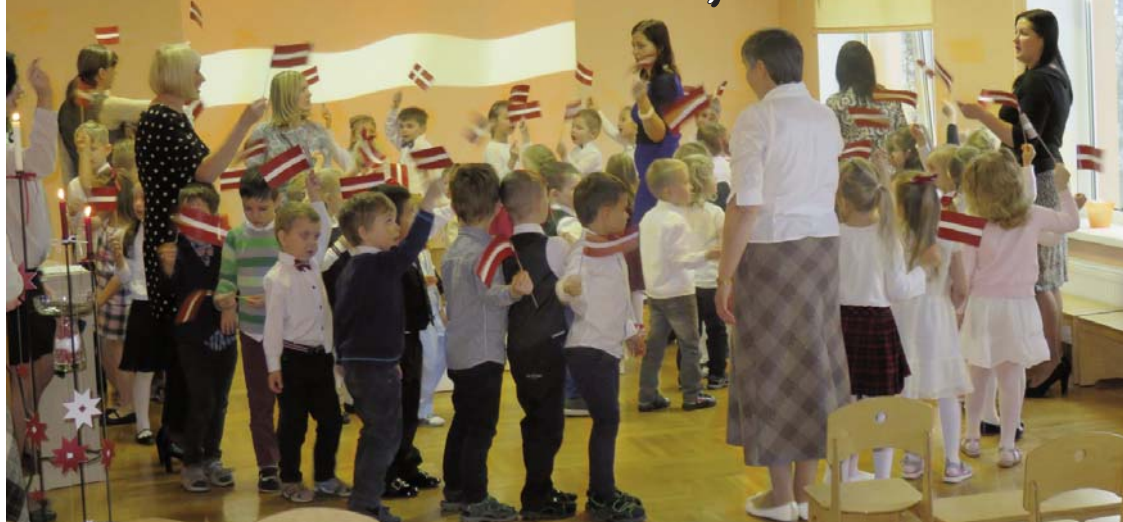
Dziesmām izdziedātu un dzejoļiem paustu savu mīlestību dzimtenei - Latvijai