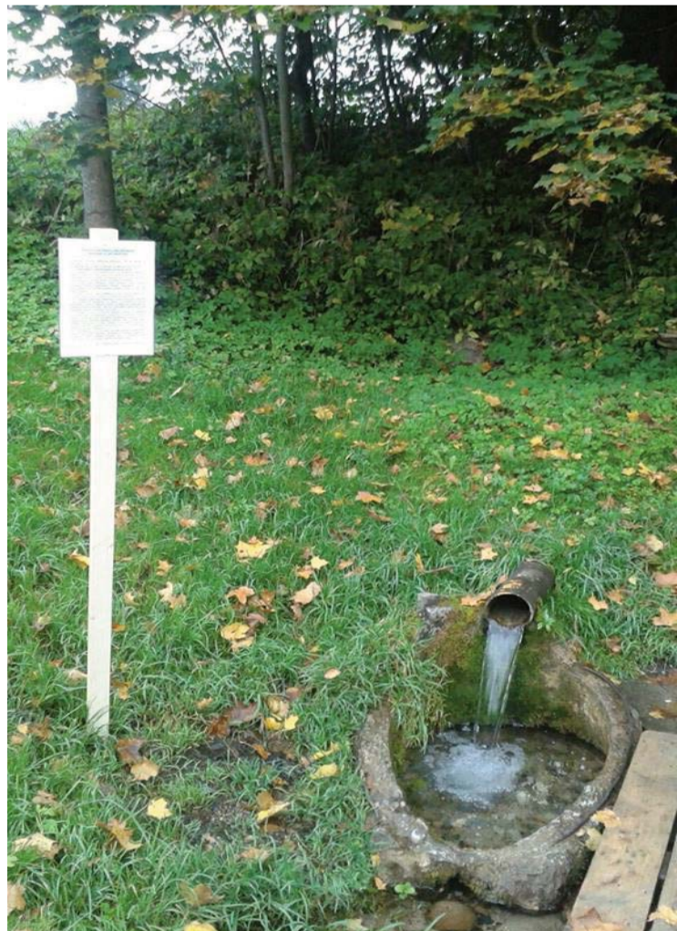
Pie Dukuru avota uzstādīta informācija par ūdens analīžu rezultātiem

Informāciju sagatavoja: Ieva Fogele, sabiedrisko attiecību speciāliste