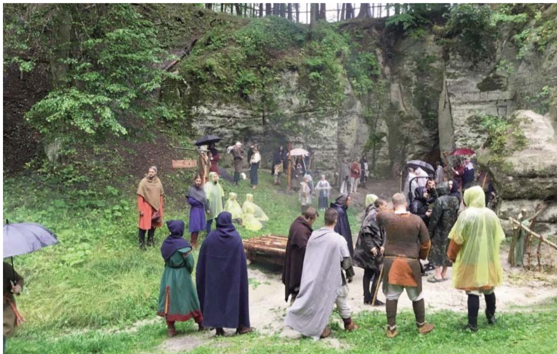
Baltu ciltis vēsturiskās realitātes inscenējumos Lielajā Ellītē, Liepā

Diāna Kārklīņa, Liepas kultūras nama vadītāja