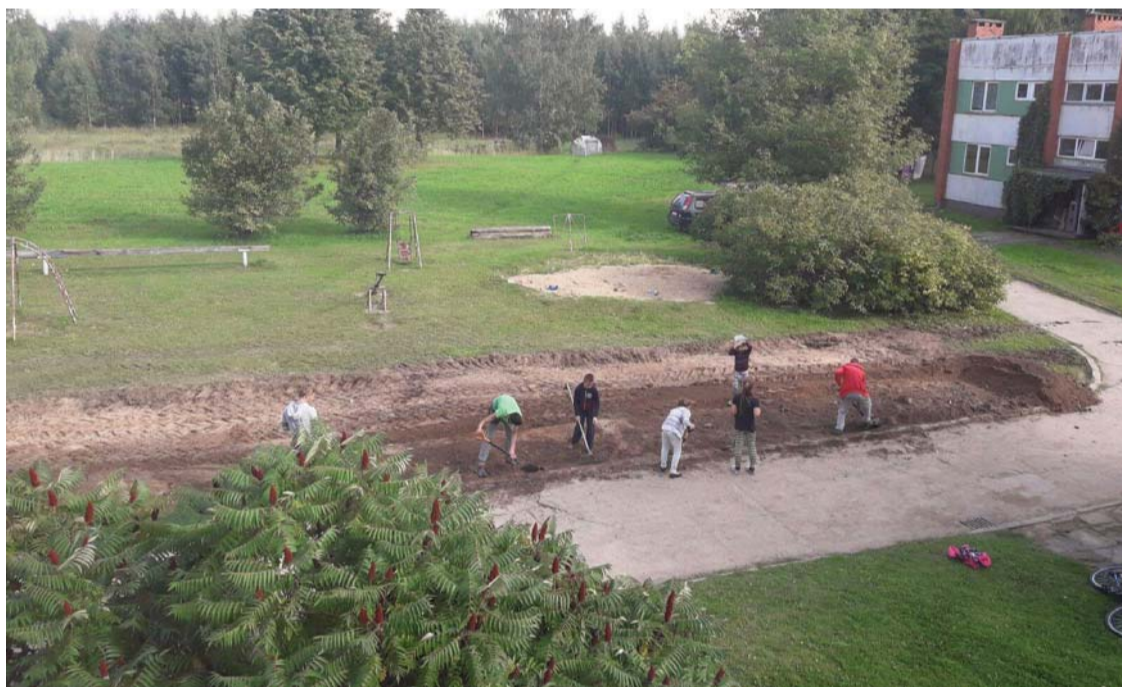
Iesaistoties māju iedzīvotājiem, darbi uz priekšu rit ātrāk.