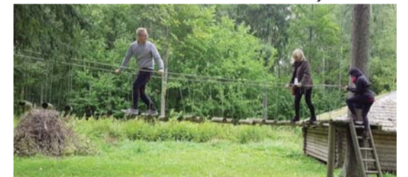
Izmēģinot Mežmalīņas aktīvās atpūtas trasīti

Iepazīstinājām viesus ar mūsu pieredzi āra pedagogijā, vides izglītībā un projektu darbā, atbildējām uz jautājumiem par pedagogu darbu slodzi, darbu stundām, pirmsskolas izglītības programmu u.c. Pēc tam viesi apskatīja grupas un vēroja nodarbības