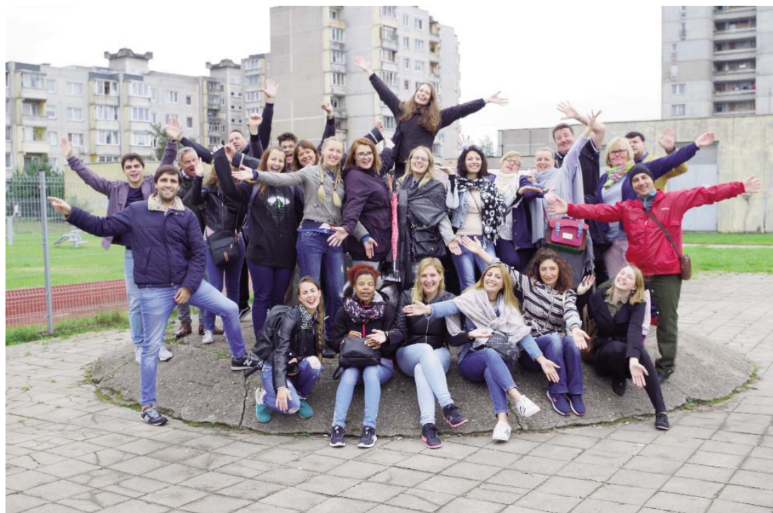
Kad iegūtas jaunas zināšanas un pieredze, ir gandarījums par paveikto.