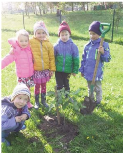
Jānogkrūms iestādīts. Gaidīsim, kad būs ogas, ar kurām našķoties.

100 eiro apmērā bērnodārza apkārtnes apzaļumošanai.