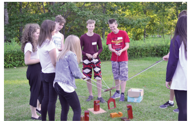
Ja darbs rit komandā- svarīgs ir katrs tās dalībnieks, lai rezultāts būtu veiksmīgs

Uz noslēguma pasākumu bija ieradušies vecāki, pašvaldību vadītāji un deputāti, lai kopīgi priecātos par nometnes „ČETRAS ATSLĒGAS 2017” laikā piedziņotu un apgūto. Jaunieši bija sagatavojuši priekšnesumu, kurā demonstrēja gan savu prasmi darboties komandā, gan medijpratības iemaņas, gan prasmi publiski uzstāties, radošumu un atraktivitāti. Katram dalībniekam šogad tika piešķirts atzinības raksts un īpašs tituls – smaidīgākais, asprātīgākais, draudzīgākais,