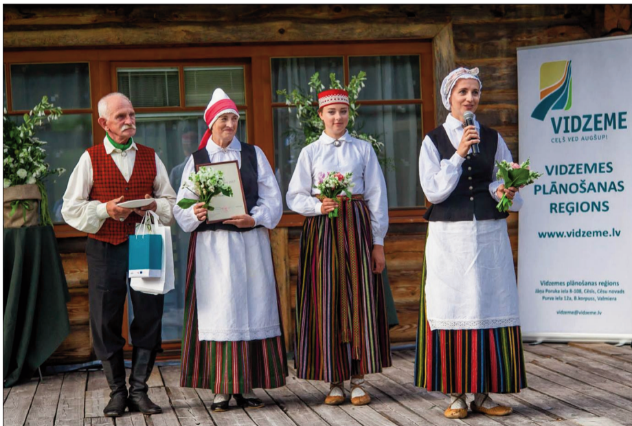
Maizes mājas saime prot gan strādāt, gan svētkus svinēt un godam tautas tērpū nest