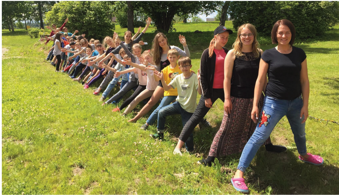
Vasaras skoliņu vadītājas ar visu savu "svītu"

no 15.-22.jūnijam ar 40 dalībniekiem un Vasaras darbnīcas no 17.-28.jūlijam ar 21 dalībnieku.