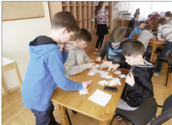
Komanda Saspiestās rozīnes liek puzzli