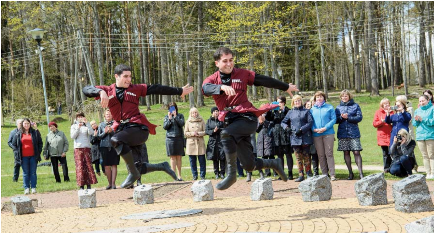
Ugunīgās gruziņu dejas izsauca sajūsmu skatītājos