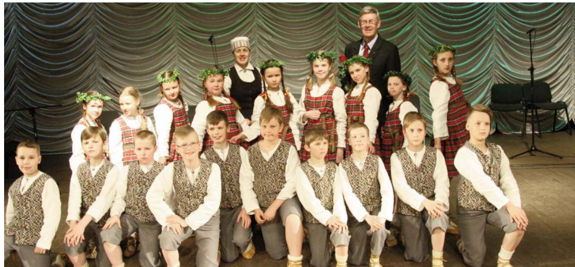
„Miķelēnu” 3.klašu grupa sveic savus lietuviešu draugus kolektīva jubilejā