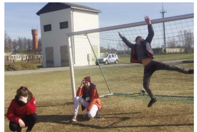
Meitenes var arī tā - komanda Negro