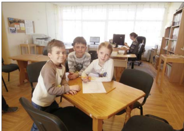
Visas pareizās atbildes zina komanda “Tīģeri”