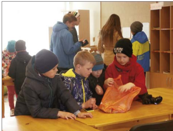
Kā mums veicās - rezultātu salīdzināšana un balvu dalīšana