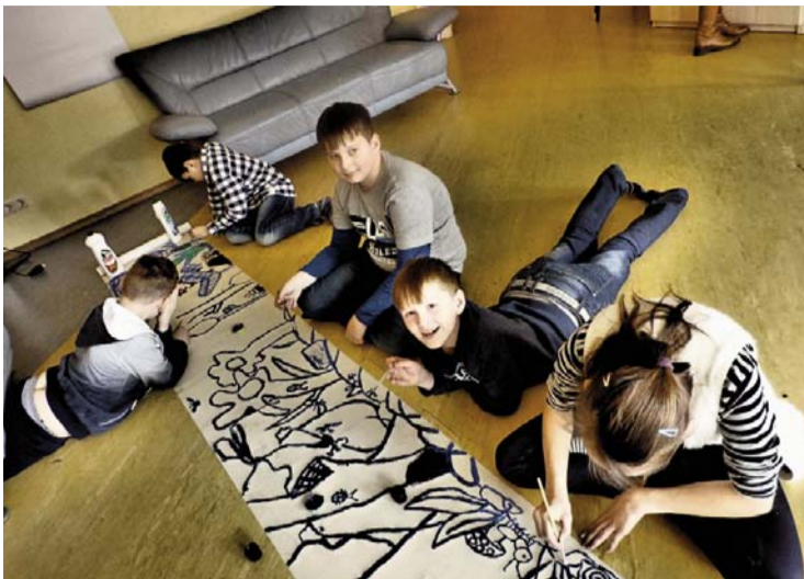
Jaunie mākslinieki izpaužas radošuma nedēļā

13.maijā norisinājās Eiropas vizijas pasākums. „Apelsīns” Eiropas vizijas nakts pasākumu „Eiropas festivālen” rīko jau 5 gadus. Pasākumā jaunieši sanāk kopā, vērtē un kritizē dziesmas un izpildītājus, kā arī liek šokolādītes uz saviem favorītiem šokolādišu totalizatorā. Konkursa uzvarētāja „atko-