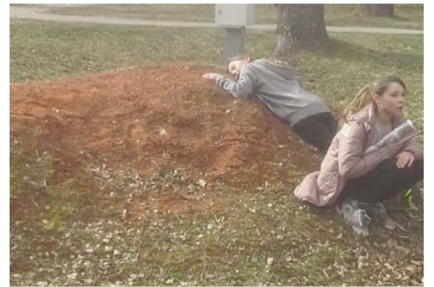
Komanda Kola Pola meklē dotos objektus