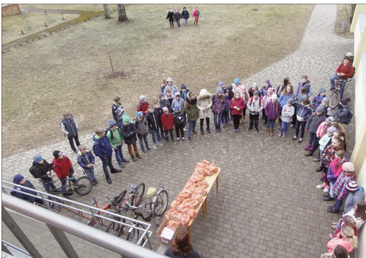
Konkursa Dalībnieku apbalvošana