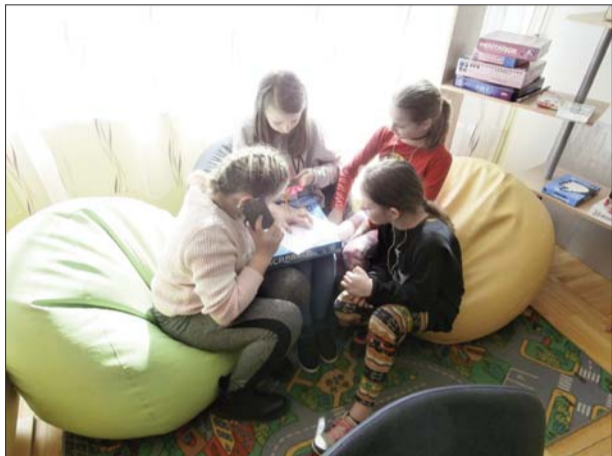
Komanda Emoji testa jautājumus risina, zvanot kādam, kurš zinās atbildi