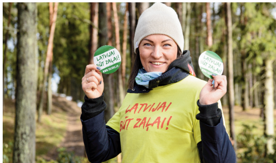
Arī mūsu novadam būt ZAĻAM!