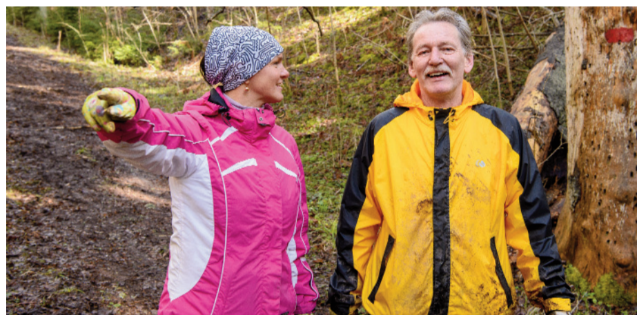
Negribi piebiedroties? Nē, paskatīšos kādu mazāku riepu.