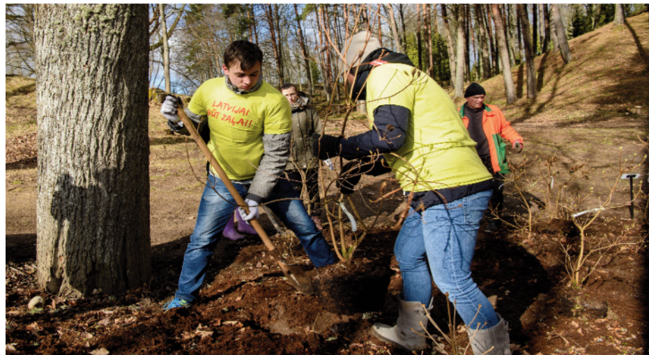
Vai tā bedre būs pietiekoši dziļa rododendram?