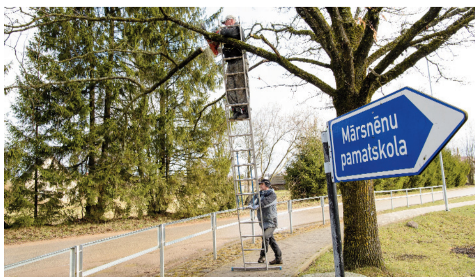
Zāgē ātri, kamēr neviens nebrauc