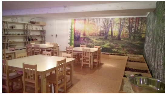
Dabas telpa veidota no ekoloģiskiem materiāliem, pie sienas kastēs dažādi dabas materiāli ar kuru palīdzību bērni varēs attīstīt savas zināšanas un maņas

Lai Dabas telpā varētu sekmīgi darboties, bija nepieciešams savākt un izveidot materiālo bāzi, kas sevī ietilpina dabas, dekoratīvo un citu nepieciešamo materiālu, palīg līdzekļu, kancelejas preču kopumu un spēj nodrošināt Dabas vides estētikas metožu pielietojumam atbilstošu radošās darbības vidi. Tiek veidota arī sajūtu taka bērnu sensorās pieredzes bagātināšanai. Izsakām pateicību Valsts Priekuļu laukaugu selekcijas institūtam par kviešiem! Latvijas valsts mežiem par čieku-