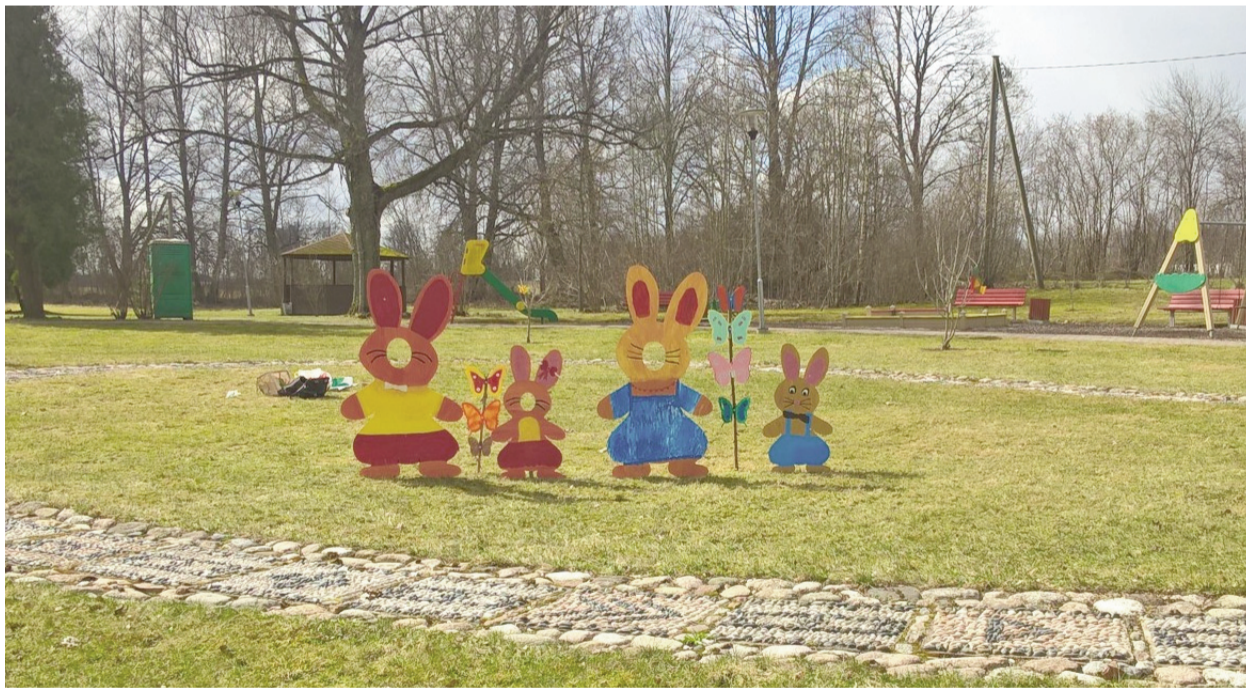
Lieldienu rītā Mārsnēnu parks aicināt aicināja mazus un lielus svinētājus

Aprīlis Jauniešu centrā “Trampalīns” iesākās ar jautru Tortillju gatavošanas dienu. Jaunieši ar lielāko prieku plānoja, iepirkās un gatavoja šo gardo ēdienu. Vislielākais prieks par to, ka šī ideja nāca no pašiem jauniešiem, kas arī tika īstenota!