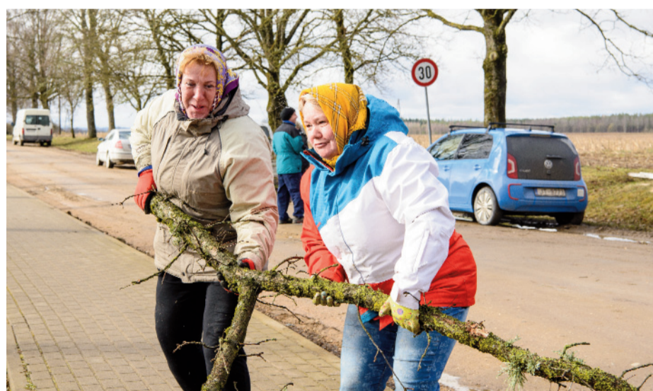
Cik m 3 malkas no šītā zara sanāks?