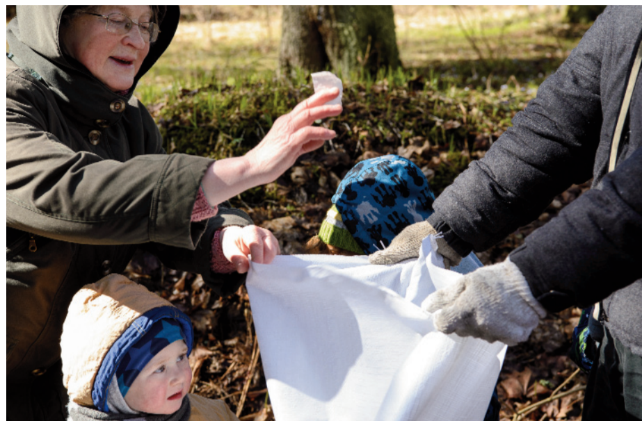
Bērniņi, papīri jāliek kabatā, vai jāmet konteinerā