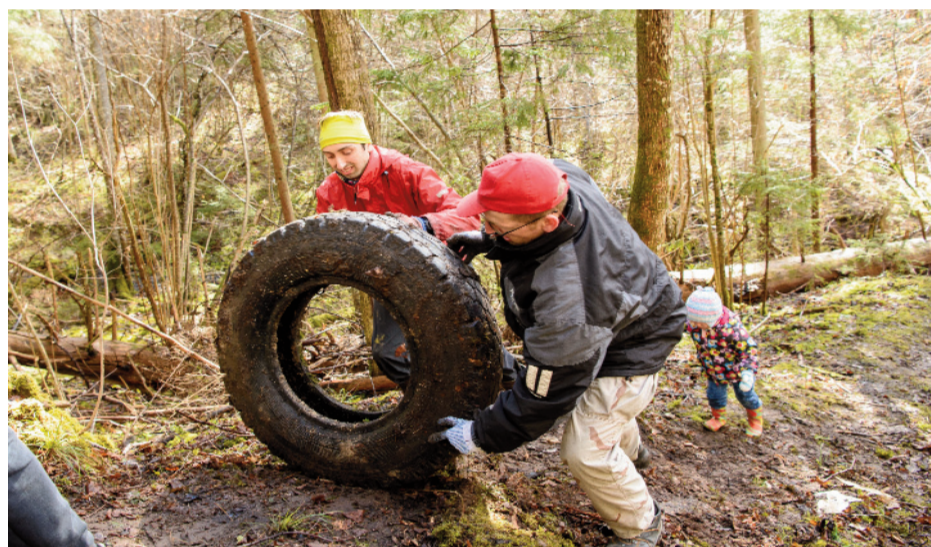
Te vīru spēks ir jāpieliek, lai no Vanagkalna gravas visas 50 riepas izdabūtu