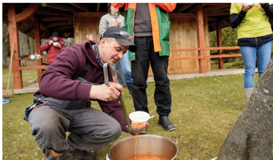
Kamēr citi neskatās, jāiesmeļ tāda biežāka....