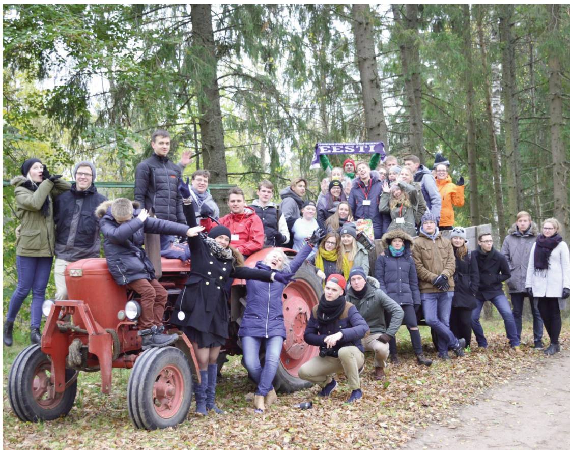
Jaunieši ekskursijas laikā iepazīnās ne tikai ar Priekuļu apkārtni, bet arī ar traktortehniku

Acīgākie Priekuļu iedzīvotāji noteikti ievēroja, ka 10 dienas, no 23.oktobra līdz 4.novembrim Priekuļos viesojās 40 jaunieši no četrām valstīm – Latvijas, Igaunijas, Lietuvas un Polijas. Jaunieši vecumā no 13-25 gadiem piedalījās Eiropas finansētā Erasmus+ apmaiņas projektā - pieredzes apmaiņas braucienā, kura uzdevums bija attīstīt komunikācijas prasmes, darbu komandā, iepazīt citu valstu kultūru un uzlabot savas svešvalodu prasmes. Projekta ietvaros svarīgas un lietderīgas bija sarunas par jaunatnes politiku.