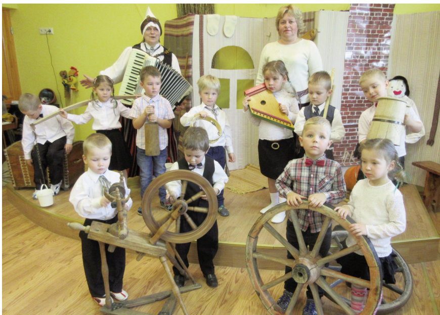
Bērniem bija iespēja iepazīties ar senajiem darbarīkiem, tas radīja lielu interesi, un palīdzēja labāk izprast skandinātās tautas dziesmas

Katra grupa skandēja latviešu dainas par kādu noteiktu tēmu: darba tikumu, ģimeni, dzimtas zemes skaistumu, putniem un dzīvniekiem. No jauna bērni mācījās dziesmas „Bēdu, manu lielu bēdu” un „Sijā auzas, tautu meita” arī mazliet pafilofofējot