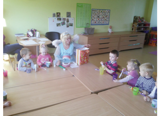
Bērni ieklausās Zobu fejas teiktajā un rādītajā par zobu tīršanu un kāpēc tas jādara, lai zobi augtu veseli un skaisti