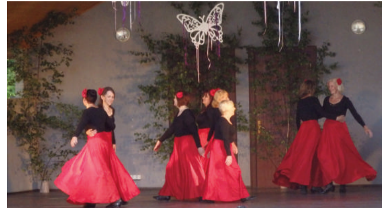
Deju grupa „Mares” skatītājus allaž priecē ar jestrām dejām un saviem košajiem tērpiem