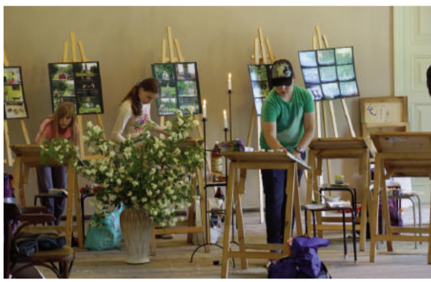
Ikviens varēja iejusties mākslinieka lomā un gleznot, starp citu, muižas laikos šī nodarbe bija ļoti iecienīta