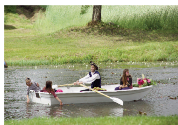
Laiviniekam no jauno dāmu puses bija liela piekrišana