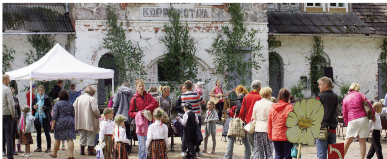
Uz brīvdabas skatuves svētku dalībnieku un skatītāju daudz