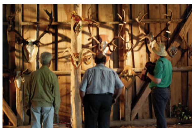
Vīri spriež – nez kuri ragi kuram pieder