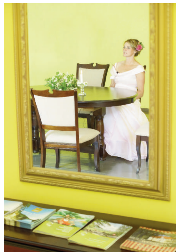
Muižas pārvaldniece Emerita varēja justies mierīgi, viss noritēja kā iecerēts