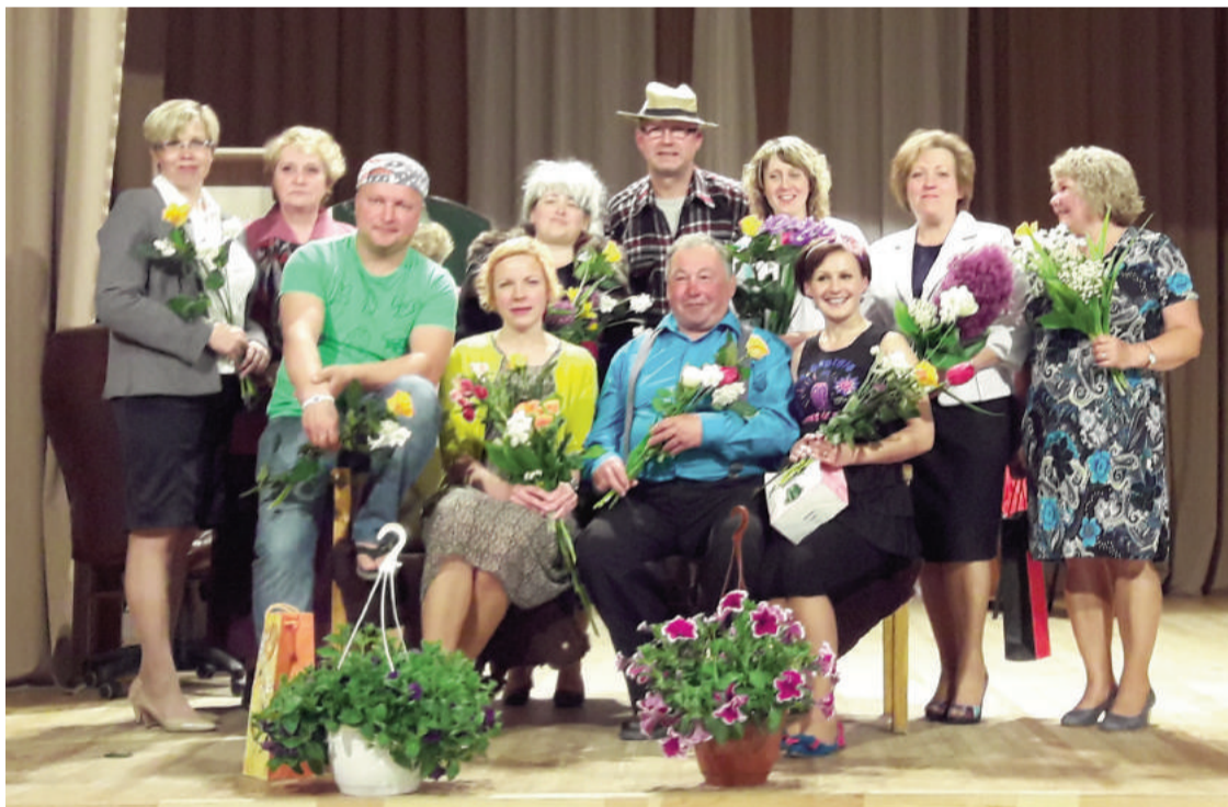
Mārsnēnu aktieru trupa ar režisori pēc veiksmīgās pirmizrādes