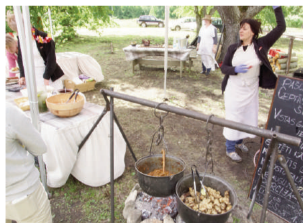
Svētki, ta svētki, bet bez ēšanas nu ne kā