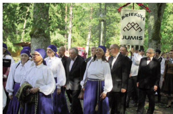
Dalībnieki svētku gājienam saposušies un labā noskaņojumā, gatavi koncertam „Liela muiža”

Reportāžu veidoja Īrisa Uldriķe