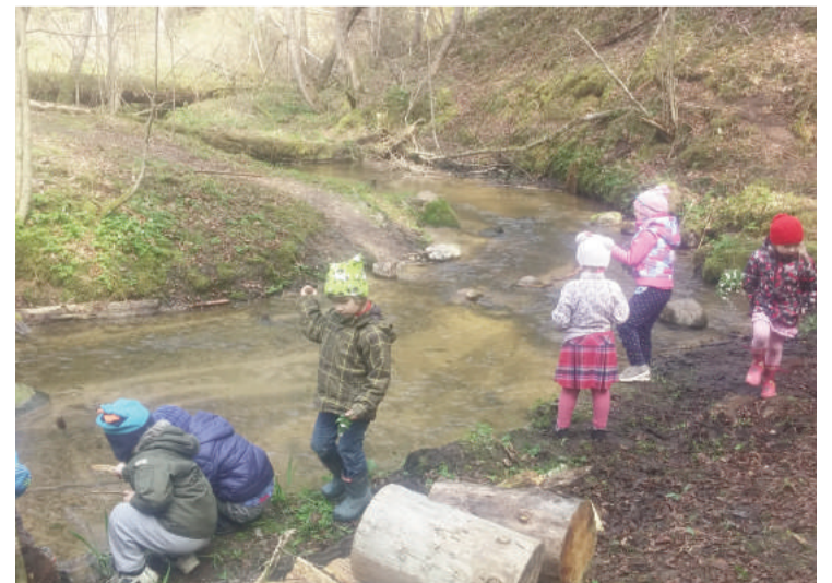
Bērniem patīk atrasties daba un aizvien izziņāt tajā ko jaunu