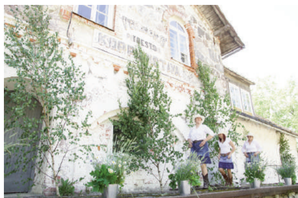
Dāmas kā no zirgiem nost, tā uz skatuves augšā

Pilnībā to var aplūkot novada mājaslapā www.priekuli.lv pie „Bilžu galerijas”