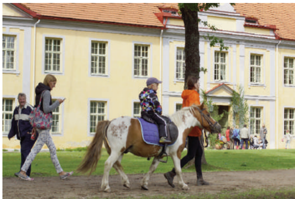
Bērni priecājās par iespēju jāt ar poniem