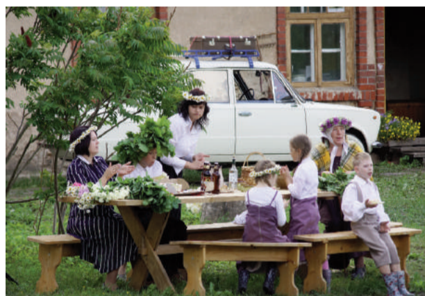
Skatītājiem klasika patīk, tāpēc izrāde „Limuzīns Jāņu nakts krāsā” saņēma sirsnīgus aplausus