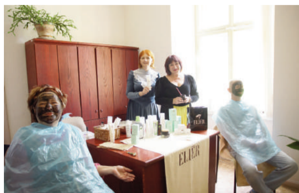
Kā jau viduslaikiem pienākas, muižā varēja baudīt relaksējošas dūņu maskas