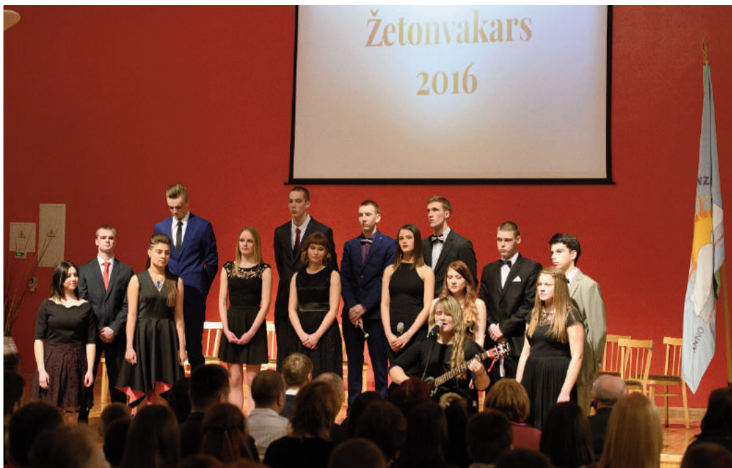
Žetonvakars - jaunieši apkopjuši savu darbu, priekšā pēdējie metri vidusskolā un tad visi vārti vaļā....