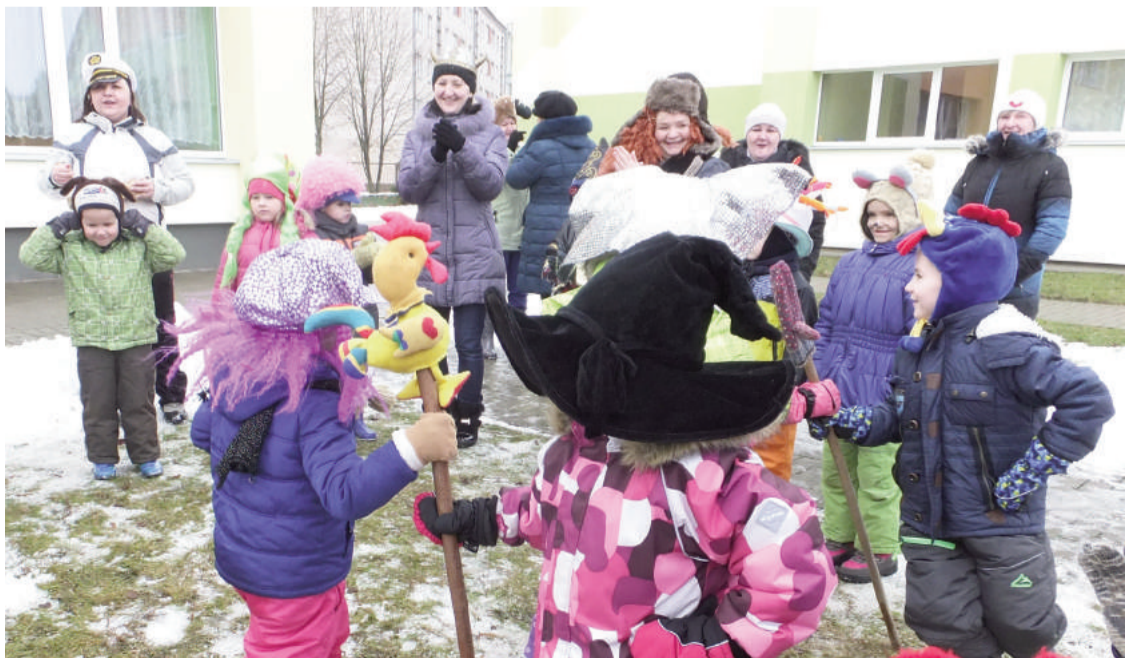
PII „Saulīte” Meteni godam aizvadīti