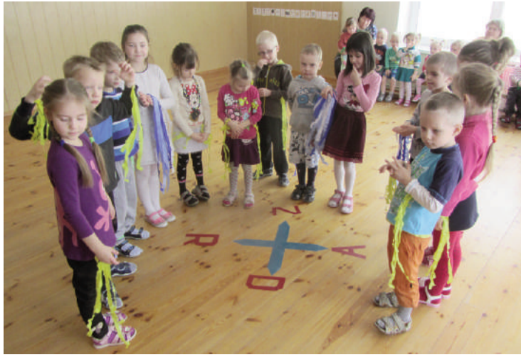
Bērni spriež- nav viegli saprast kā tie vēji pūš un kuram līdzī skriet

Ziemas pēdējā mēnesī pie mums Veselības bērnudārzā ir notikuši interesanti pasākumi ar domu „Pavadīsim ātrāk ziemu un gaidīsim pavasari”!