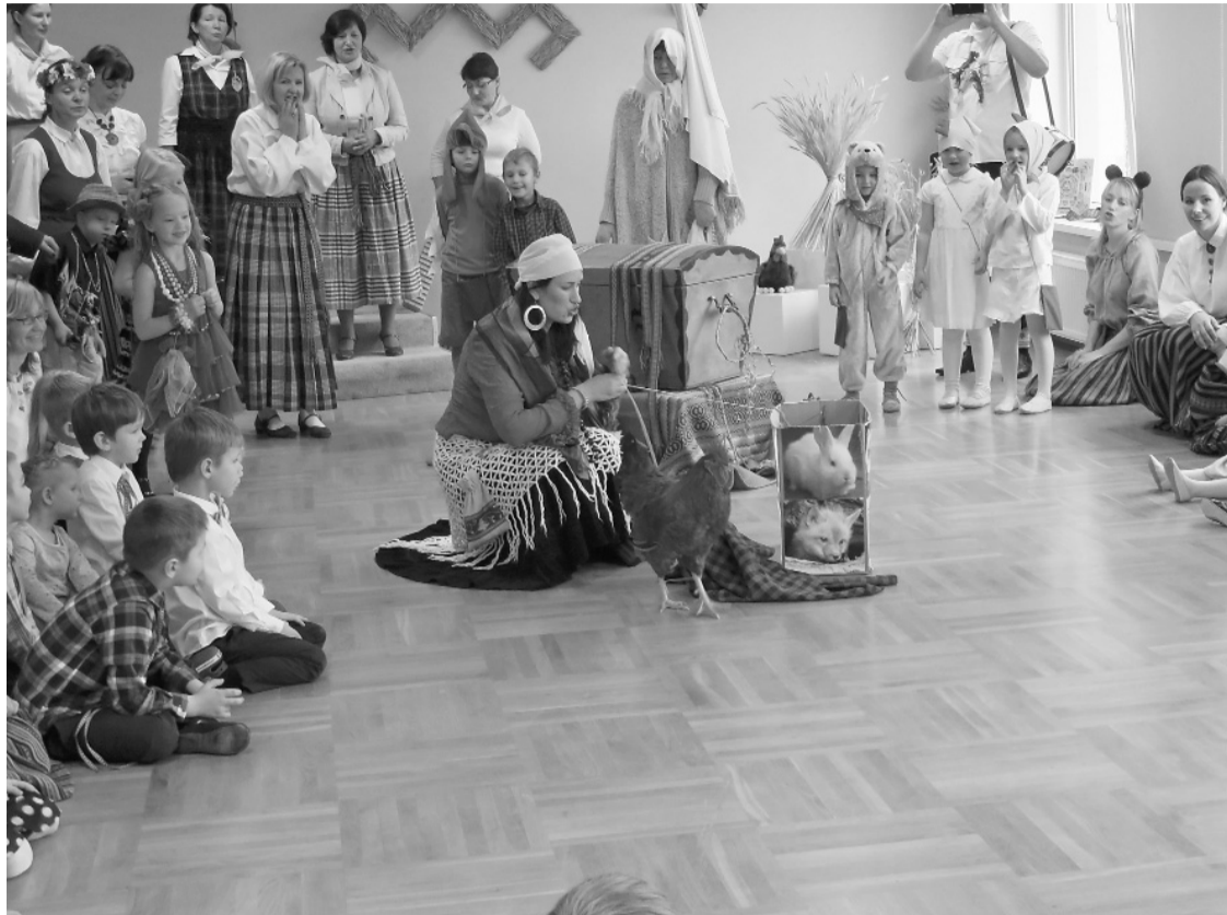
Bērniem laimi, veselību un gudrību izzilēja jaukā un gudrā čigāniete

Zeme rīb, rati klaudz, Kas to zemi rībināja? Nu atbrauca Mārtiņdiena Deviņiem kumeļiem.