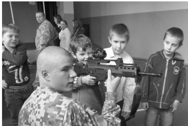
Ieroču demonstrējums un iespēja tos izmēģināt izraisīja patiesi lielu interesi skolēnu vidū.