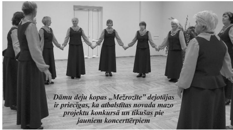
Dāmu deju kopas „Mežrozīte” dejotājas ir priecīgas, ka atbalsētājas novada mazo projektu konkursā un tikušas pie jauniem koncerttērpiem

Pašas sameklējušas audumu, padiskutējušas un vienojušas par modi, atlikušas naudiņu šuvēju darba