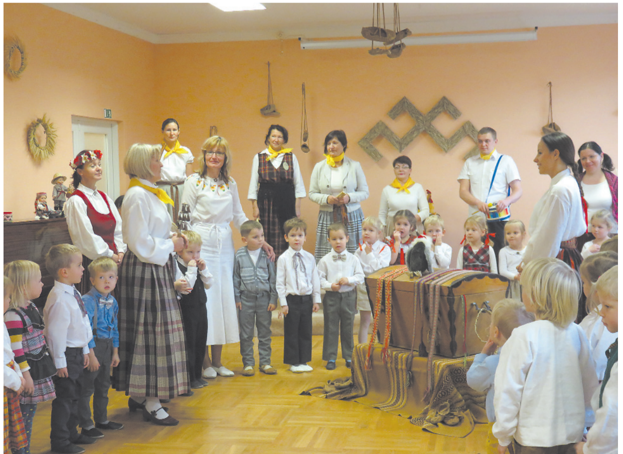
Jāņmuižas bērnodrāzē bērnos jau no mazotnes tiek ieadzināta mīlestība uz savu zemi, savu Latviju

Mūsu svētku nedēļa savu kulmināciju sasniegs Latvijas dzimšanas dienai veltītā koncertā 19. novembrī plkst.