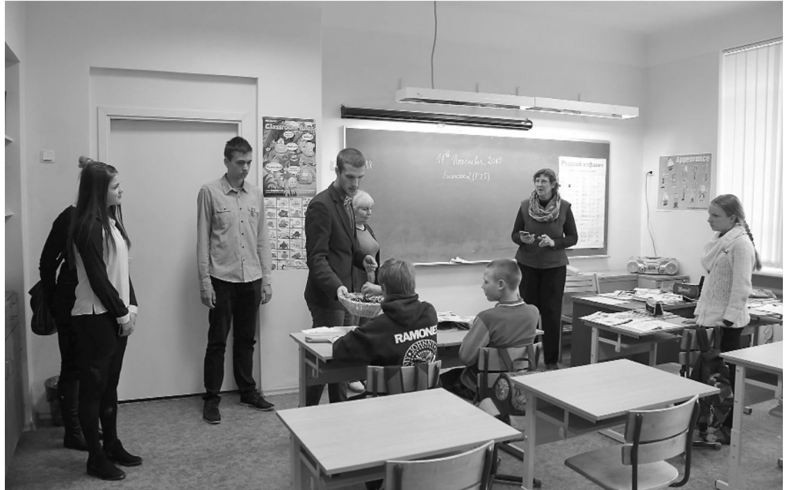
Jauniešu (pa)Domes aktīvisti dala lentītes Mārsnēnu pamatskolā

Šis rudens ir patīkams. Tas mūs neapgrūtina ar dubļainajiem ceļiem un izmirkšanu. Esam pusceļā uz ziemu. Izklusās pavasam savādi, vai ne? Tikko, tikko tikai uzsākām jauno mācību gadu, bet nu jau klāt Valsts svētki.