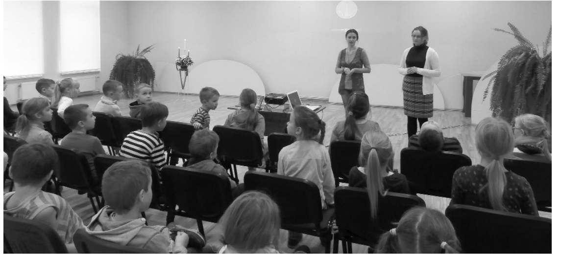
Priekuļu vidusskolas pirmklasnieki tiek ar pagasta bibliotēkas darbiniecēm un filmas "Ceļš" līdzautorēm.

Atgādināšu, ka sakarā ar Latvijas Republikas pasludināšanu nepieciešamos naudas līdzekļus teātra zāles rotāšanai piešķirā