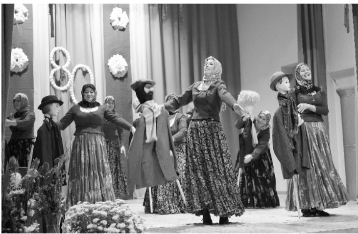
Svētku koncertā dāmu deju grupa „Mares” bija tikusi pie partneriem un atraktīvi izpildīja deju „Mīļais mans”

Tautas nama bagātīgo vēsturi veidojuši neatlaidīgi un aktīvi iedzīvotāji, darbojušies radoši