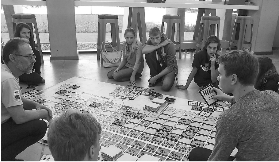
Skolēni ar interesi ieklausās ķīmijas pasniedzēja stāstījumā