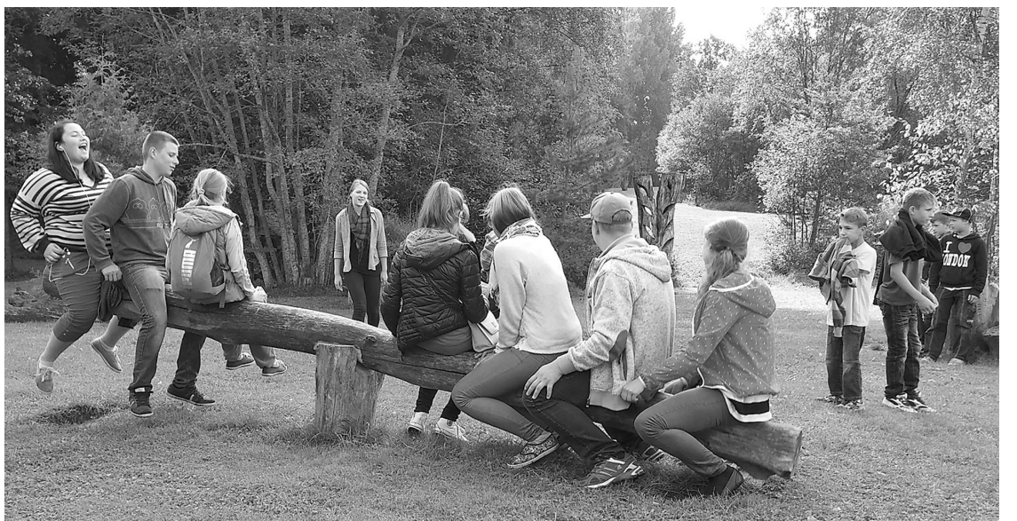
Skolēni izbauda atrakcijas Vienkoču parkā