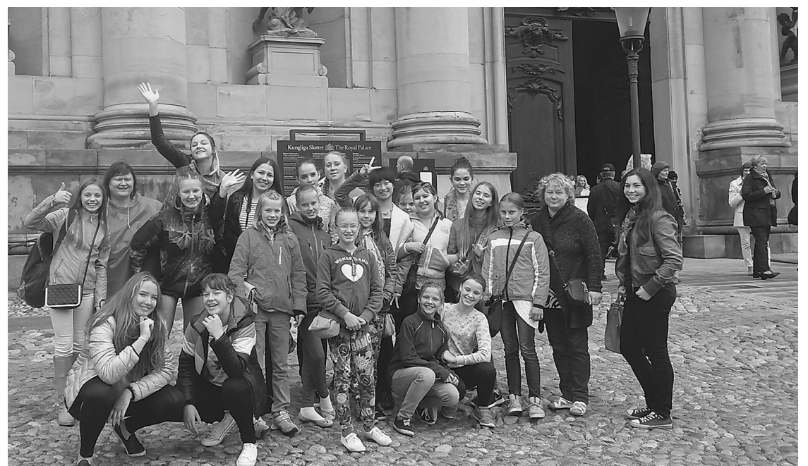
Meiteņu kora dalībnieces priecājas par ekskursiju Stoholmā

Pa skaisto promenādi un tiltiem raitā solī soļojām uz Jūrgordena salu, kur starp daudziem citiem muzejiem ir pasaulslavenais Vāsa kuģa muzejs. 17. gadsimtā būvētais milzīgais koka kara kuģis atstāj lielu iespaidu uz jebkuru apmeklētāju. Muzejs ticis būvēts apkārt kuģa vrakam, kurš jūras dzelmē nogulējies 100 gadus un izcelts