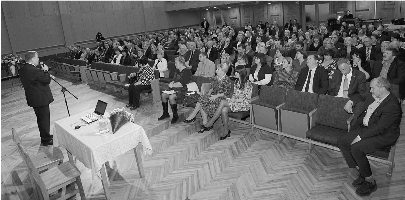
Novadu vadītāji un pašvaldību speciālisti, pulcējušies ikgadējā Novadu dienā, aktīvi debatēja un pieņēma lēmumus par pašvaldībām svarīgiem jautājumiem sadarbībā ar Valsti.