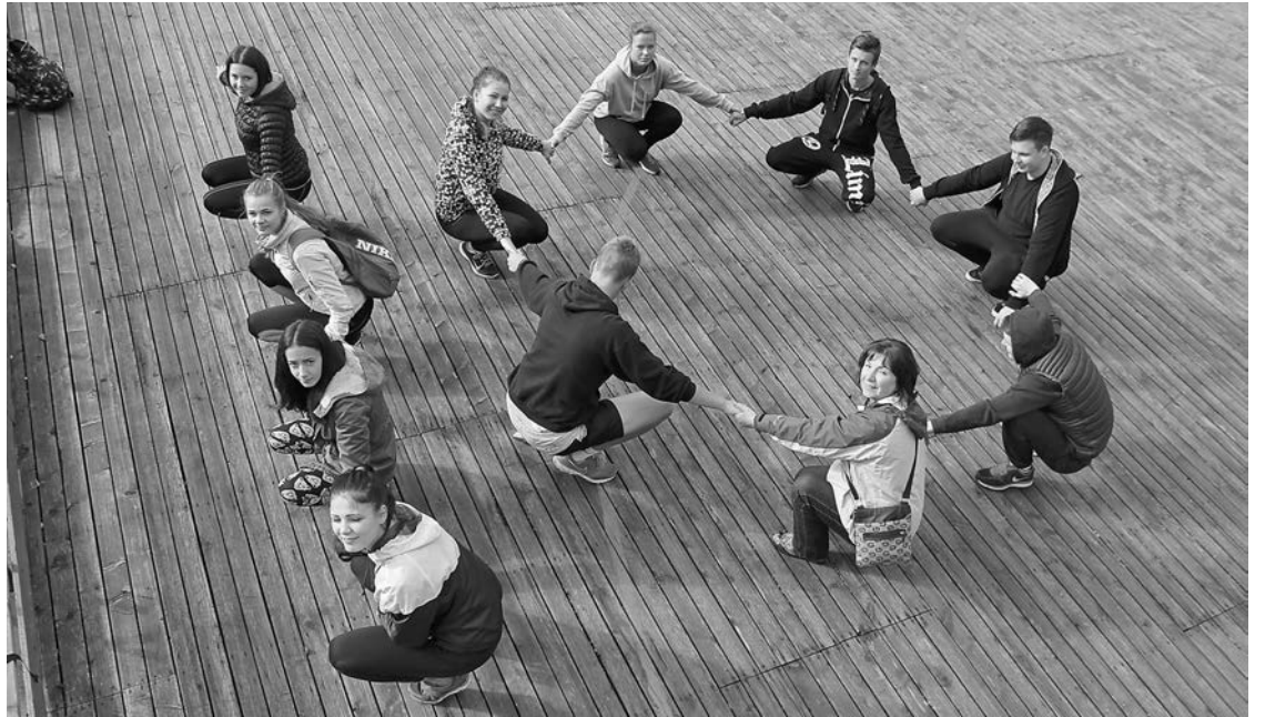
Desmitās klases skolēni un skolotāja veic vienu no uzdevumiem - atveido savas klases ciparu desmitnieku.

Mācību gada sākumā, 3. septembrī, Priekuļu vidusskolā notika Sporta diena. Šogad skolas darbā īpašu uzmanību pievērsīsim skolas videi un apkārtnē, tā ir arī mūsu skolas gada EKO tēma. Arī Sporta dienas uzdevumi bija saistīti ar skolas apkārtni, pagasta teritoriju.