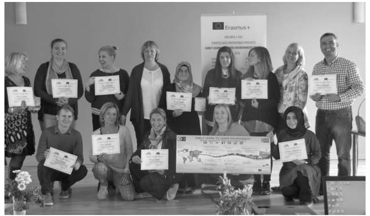
Sanāksmes dalībnieki ar saņemtajiem sertifikātiem Saieta namā

Eiropas Savienības mūžizglītības programmas Erasmus+ stratēģiskās partnerības projekts „Early Learning to Learn Environment” tika apstiprināts pirms gada, bet savu darbību uzsāka 2015.gada martā, kad projektam tika piešķirts finansējums. Projekta mērķis ir radīt 60 nodarbību scenārijus, kas veicina bērnu kritiskās domāšanas attīstību mākslas un dabas