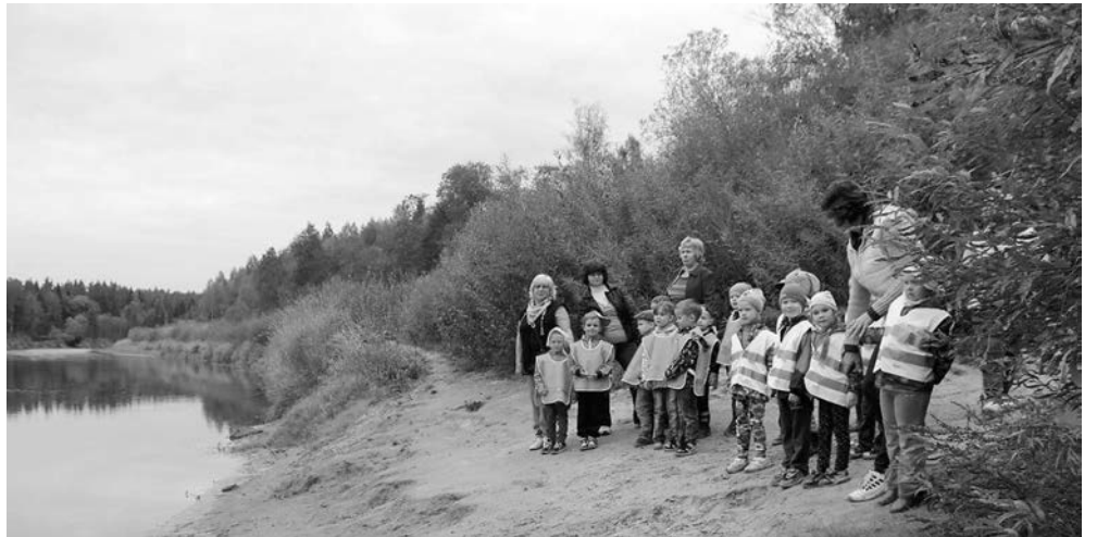
Gauja tika atrasta tepat Liepas pagastā, un tā patiešām ir skaista - vērtēja bērni