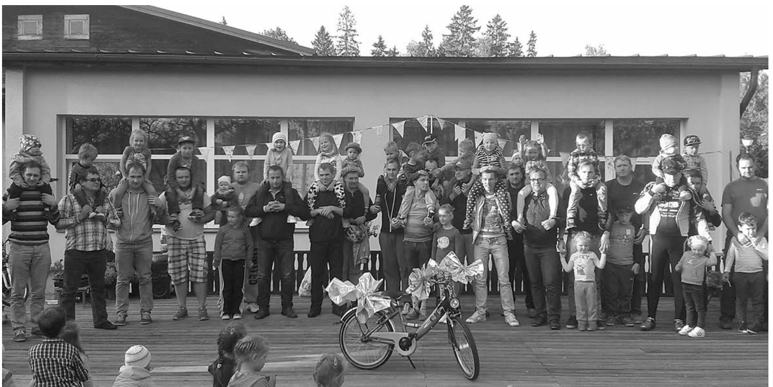
Pēc lielā velobrauciena tēti ar savām atvasēm bija priecīgi pozēt kopbildei. Priekšplānā galvenā balva - SIA „Strazdugrava” dāvētais ritenis

Jau sesto gadu Mežmaliņas bērni un pedagogi devās velobraucienā pa Priekuļu velociņiem! Šogad pasākums notika 11. septembrī un bija īpašs ar distances garumu. Nēmām vērā iepriekšējo gadu pieredzi un ieteikumus – bērniem jābūt ripot līdz spēku izsīkumam. Bijām sagatavojuši 3 distances, lai katrs var izvēlēties pēc spējām, bet lielākā daļa dalībnieku brauca visu distanci – lielo apli.