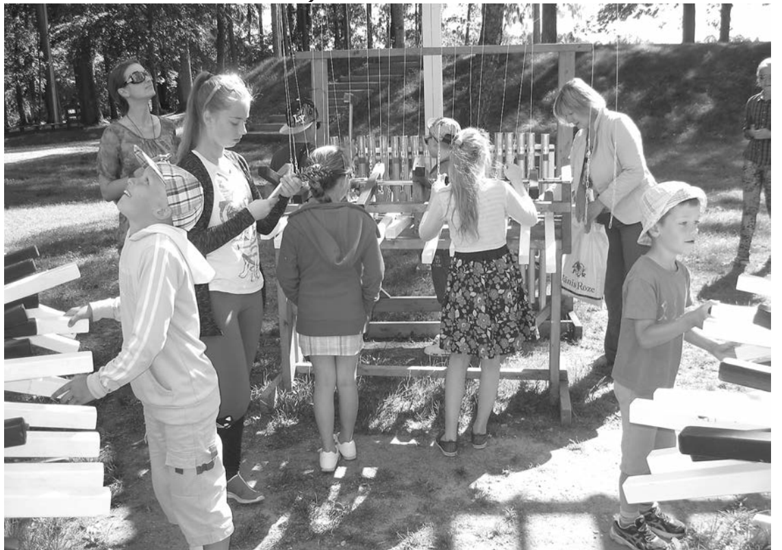
„Vasaras lasīšanas konkursa“ dalībnieki Neikenkalnā zem „Sidraba birzs vainaga“

Priekuļu pagasta bibliotēkā trīs vasaras mēneši bija rosīgi. Vasaraiesākās ar „Vasaras lasīšanas konkursu”, kas ilgalīdz pat augusta beigām un turpinājās ar gatavošanos „Vasaras radošajam darbnīcām” un to īstenošanu.