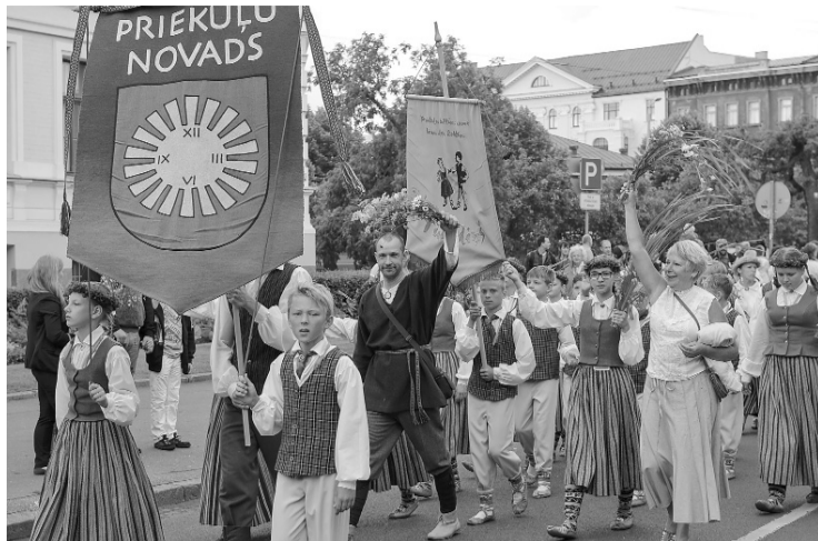
Gājiens ir neatņemama svētku sastāvdaļa. Mūsējie tajā piedalījās ar prieku un lepnumu!