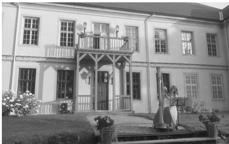
Arfas solo koncerts organiski iekļāvās muižas dārzā un klausītājiem ļoti patika Dārtas spēle

Jūlija otrajā svētdienā par tradīciju tiek iedibināti Rožu svētki. Novada Mazo projektu konkursā veselavieši ieguva atbalstu un īstenoja savu mērķi – krāsainu rožu apstādījumu veidošana, piešķirot muižas parkam renesanses krāšņumu. Rožu svētkos Veselavas muižā savus viesus priecēja ar daudzkrāsainām ziedu kompozīcijām telpās un ziedu arkām muižas dārzā, par to paldies mā-