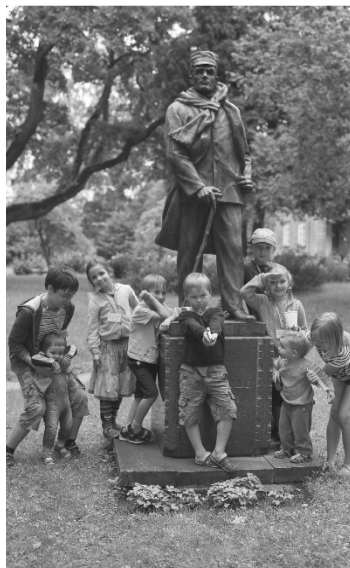
Jaunā paaudze iepazīstas ar mūsu klasiķa Ed. Veidenbauma mūža veikumu