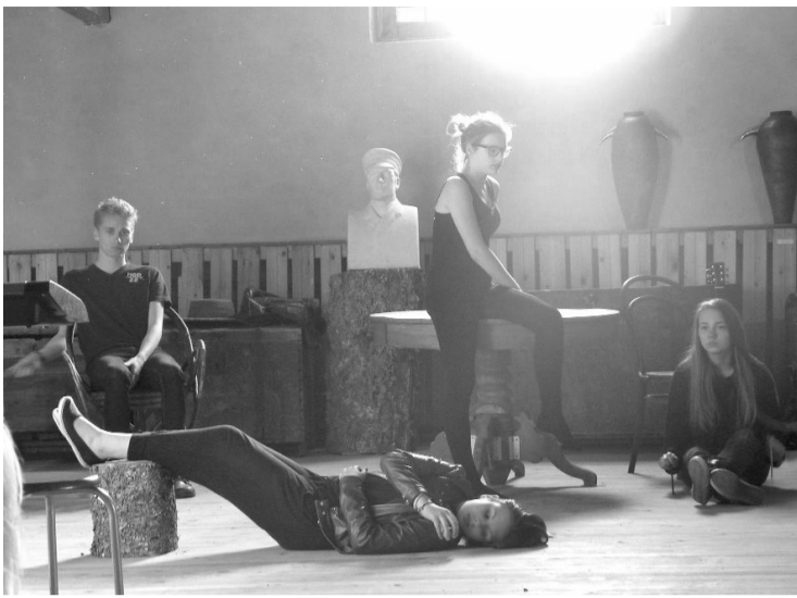
Performances atrādīšana „Kalāču”muzejā

Gatavošanās process nebija viegls, brīžiem vislielākais izaicinājums sadarbošanās, palaušanās, brīžiem izaicinājums bija iemācīties savu tekstu, citos brīžos pašam saprast, ko es vēlos pateikt, kāpēc tas, ko es saku, ir svarīgi. Liela daļa no performances stāsta bija par ticību sev, par pārliecību, ka es varu, ka es zinu, ka es lepojos ar paveikto, ar savu gūto pieredzi. Vai ir viegli pateikt skaļi un droši: „Es ticu sev vairāk nekā jebkuram citam!” un galvenais - vai ir viegli pašam tam arī noticēt, būt pārliecinātam par to, ko saki? Vai ir viegli atnest bailes no izskatīšanās mulķīgi? Vai ir viegli sevi pārvarēt? Šie un vēl citi jautājumi, atbilžu meklēšana uz