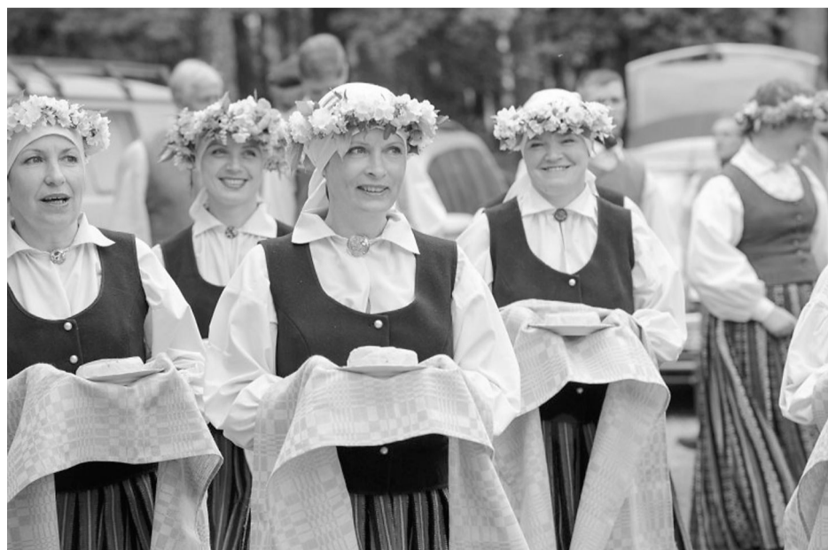
Un kur tad nu Jāņos bez siera un alus!