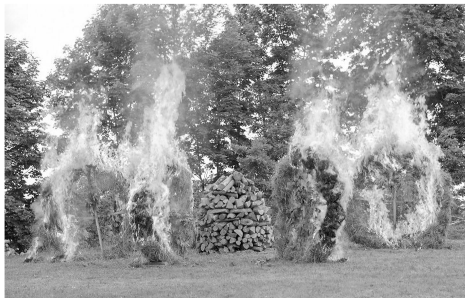
Svētku koncerta izskaņā, estrādes kalna galā tika aizdegts liels ugunskurs, kurš dega līdz pat rīta gaismai. Visām Līgo vakara un Jāņu dienas izdarībām ir sava mistiska nozīme. Mēs svētkus nesvinam tāpat vien – uguni dedzam, lai būtu svētība, sieru ēdam, lai iegūtu saules spēku, alu dzeram, lai būtu darba spars, ar jāņuzālēs aizbaidām kukaiņus...

Novada svētku reportāžu sagatavoja Īrisa Uldriķe un Elīna Krieviņa