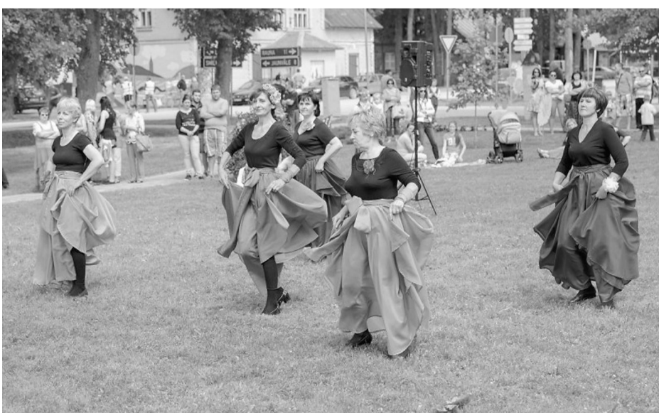
Skatītājus ar saviem košajiem tērpiem un iznesību dejā priecēja Liepas deju kopa.