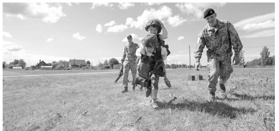
Interesantu tehnikas un ieroču kolekciju svētku apmeklētājiem bija izstādījuši zemessargi, kā arī sagatavojuši dažādas stafetes, kurās aktīvi piedalījās mūsu jaunatne.