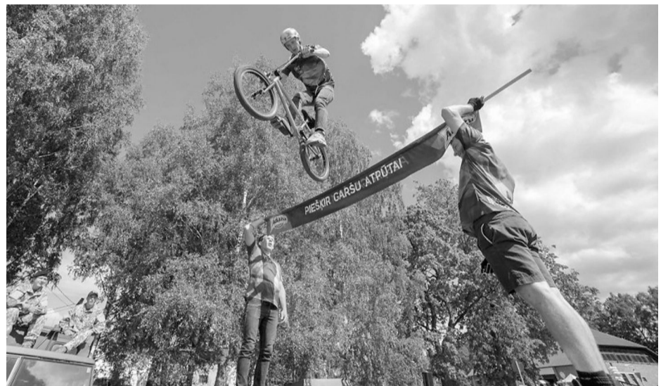
„Garšu atpūtai” noteikti piešķīra ekstrēmie BMX paraugdemonstrējumi ar galvu reibinošiem trikiem.

Paldies visiem, kuri atbalsta jauniešus, gan piedāvājot inventāru, gan darba spēku, gan idejas! Aicinām visus, kuri vēlas jauniešu centrus un jauniešu domi atbalstīt, ja ir idejas, tad nekautrējaties un sazinieties ar mums!