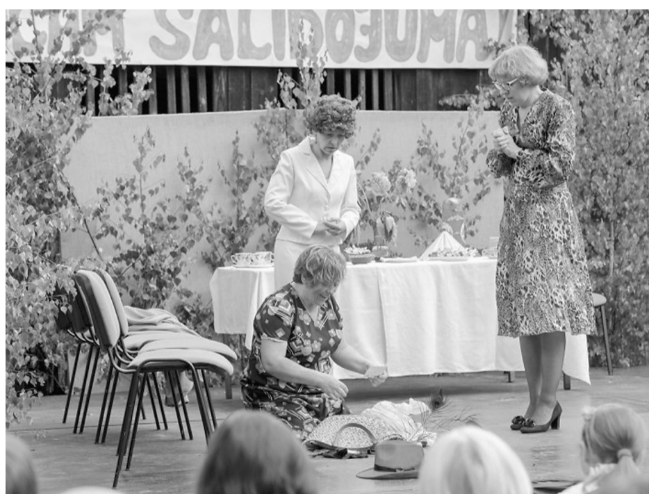
Teātra spēlēšana jau dienā gāja valā uz vairākiem gangiem. Mārsnēnieši- „šuva, grieza un pletēja”. Liepēnieši izdzīvoja pārpratumu, pārpratumus, līdz skaidrību guva „Meitiņa”. Priekulieši gan bija ļoti nopietni „Valentīnu dienā”, kura izvērtās par drāmu. Toties Veselavas „Trīs ar pus atraitnēm” negāja viegli, jo izredzētais precinieks bija tikai viens.