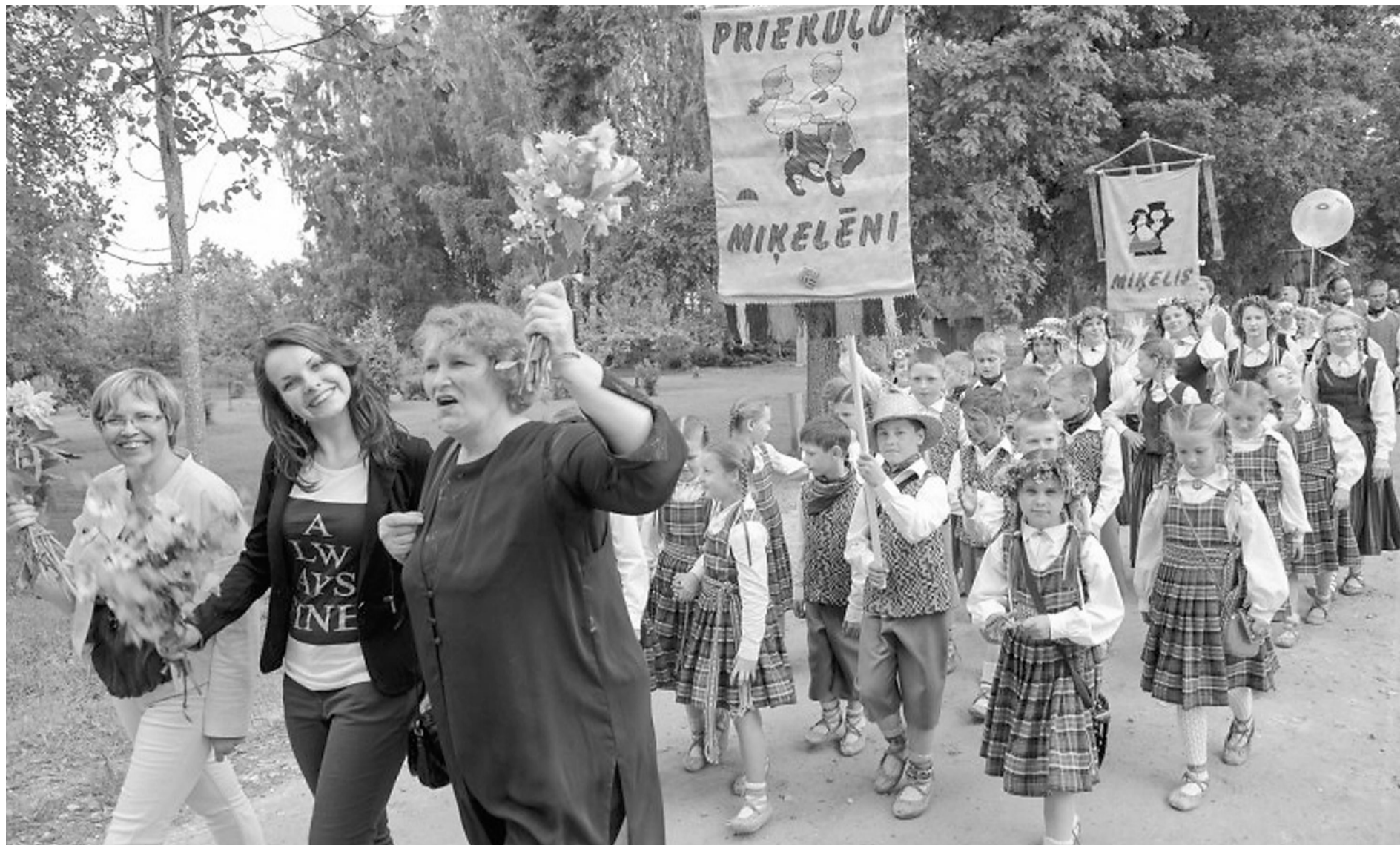
Svētku gājiens no Mārsnēnu tautas nama uz estrādi Klabes birzītē izvērtās jautrs un krāšņs. Katrs kolektīvs bija padomājis par savu noformējumu ar atšķirības zīmēm.