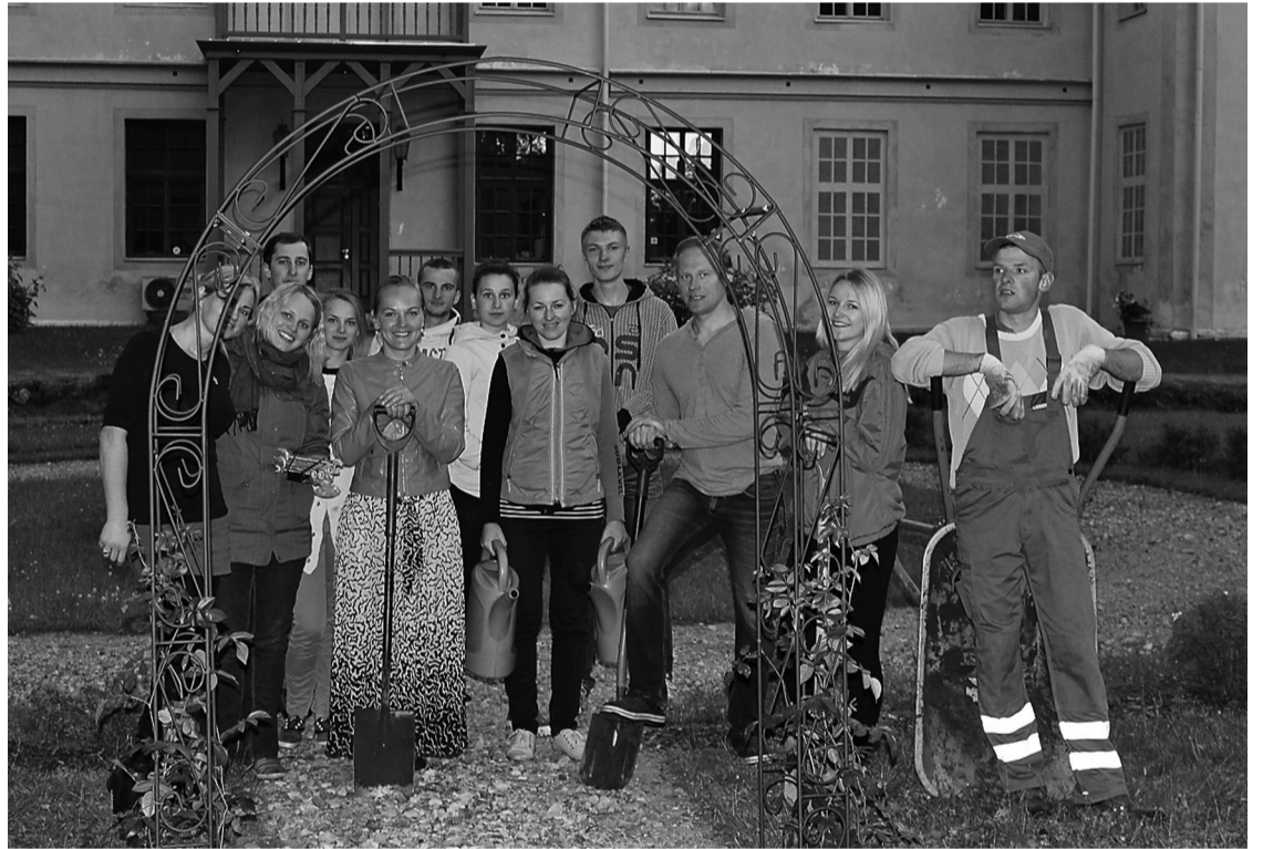
Jaunieši priecīgi par paveikto - uzstādītajām arkām un sastādītajām rozēm

Pavasārī Priekuļu novada pašvaldība izsludināja mazo projektu konkursu „Mēs novadam” 2015 ar tēmu „Vide un kultūra”. Konkurssam tika iesniegti 9 projekti, no tiem apstiprinājumu ieguva 5 projekti.