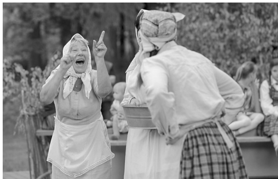
Skroderdienu vecenes arī Mārsnēnos ieviesa savu kārtību un noskaidroja, kur tas lakatiņš palicis. Protams, bez vannītes gāšanas virsū jau neiztika.