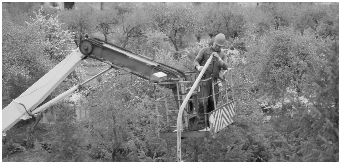
Pilnsabiedrības “VIZULO&VIZULO Solutions” vīri veic gaismekļu nomaiņu Priekuļos, Dārza ielā.

Vineta Lapsele, pašvaldības projektu vadītāja