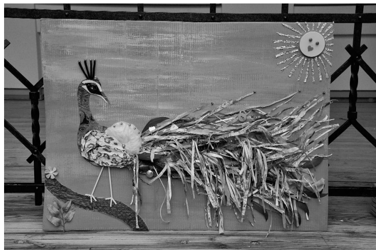
Gleзна „Pāvs” - veidojuši Jāņmuižas pirmsskolas izglītības iestādes vecākās grupas bērni

Zane Leimane, SIA ZAAO sabiedrisko attiecību speciāliste