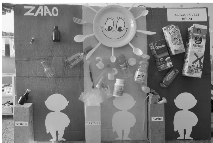
Viena no bērnu izglītojošām gleznām par atkritumu šķirošanu