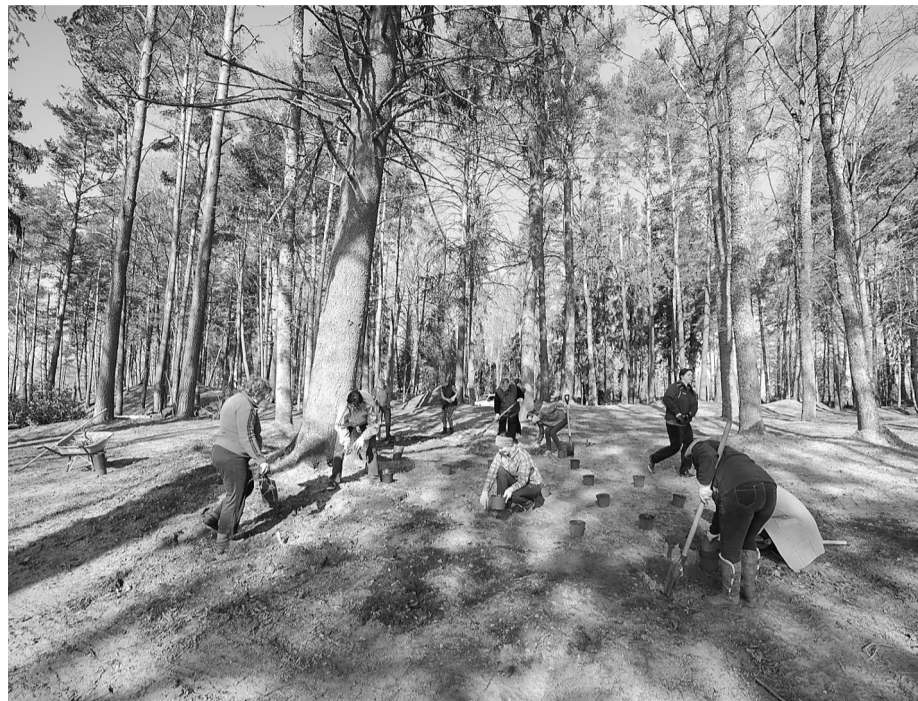
Saules parkā jau pirms talkas tika veikti lieli darbi, lai sagatavotu vietu jaunajai pastaigu takai, kuras malās būs rododendru un paparžu audzes.

Bez oficiāli pieteiktajām talkošanas vietām novada sakopšanas darbi ritēja arī daudzās citās vietās.