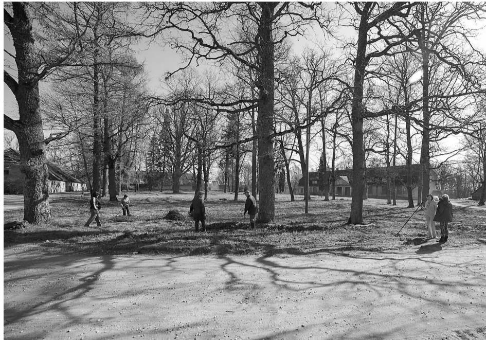
Liepas muiža. Pēdējā gada laikā šī vieta izmainījies un jācer, ka piepildīsies īpašnieku ieceres. Lai viņiem izdodas iecerētais muižas atdzimšana.