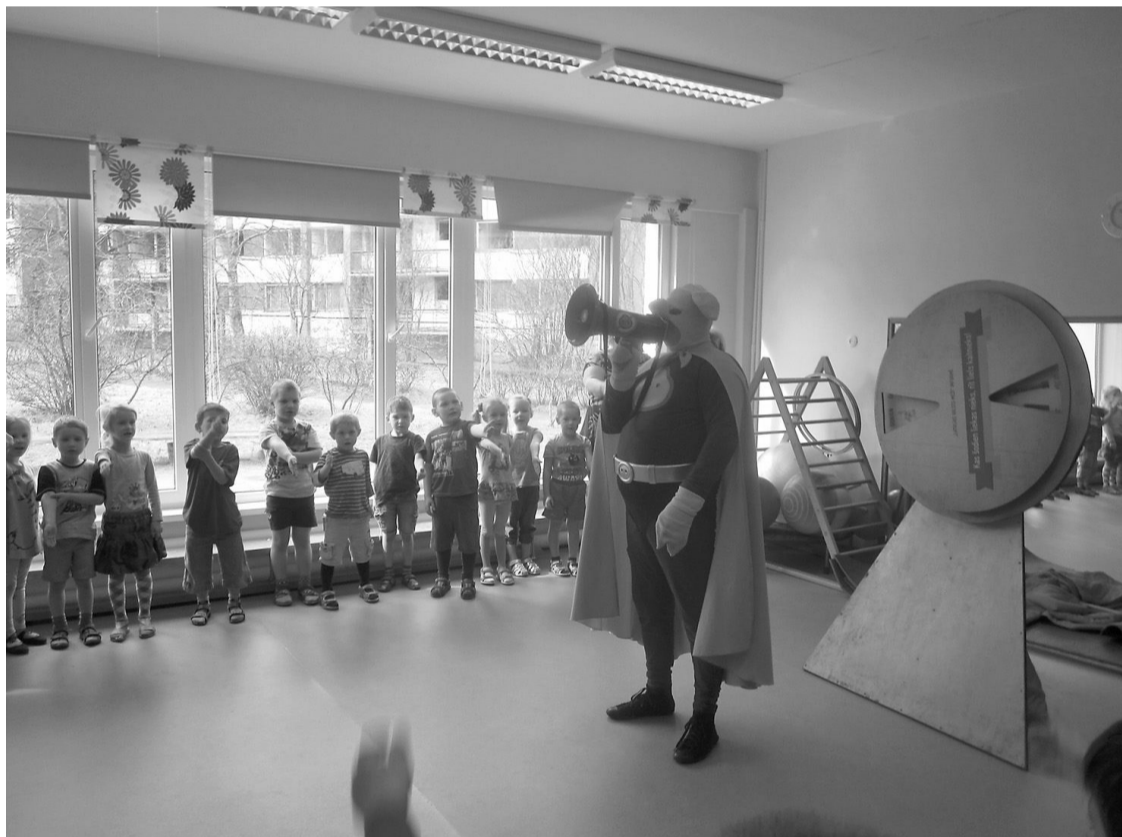
Cūkmens bērniem stāsta, cik nozīmīga ir atkritumu šķirošana

Marta beigās tiek atzīmēta Starptautiskā ūdens diena. Starptautiskās ūdens dienas ietvaros pie mums, bērnudārzā „Saulīte”, viesojās ūdens pile Tille un iepazīstināja bērnus ar dažādām ūdens īpašībām. Tille pārbaudīja bērnu zināšanas par Latvijas upēm un ezeriem, bērni minēja mīklas, kuru atminējumi ir saistīti ar ūdeni. Kopīgi tika izspēlēta teika „Kā zvēri Gauju raka”. Mazākie bērni iejutās pīrātu lomā un meklēja dārgumus jūras dzelmē.