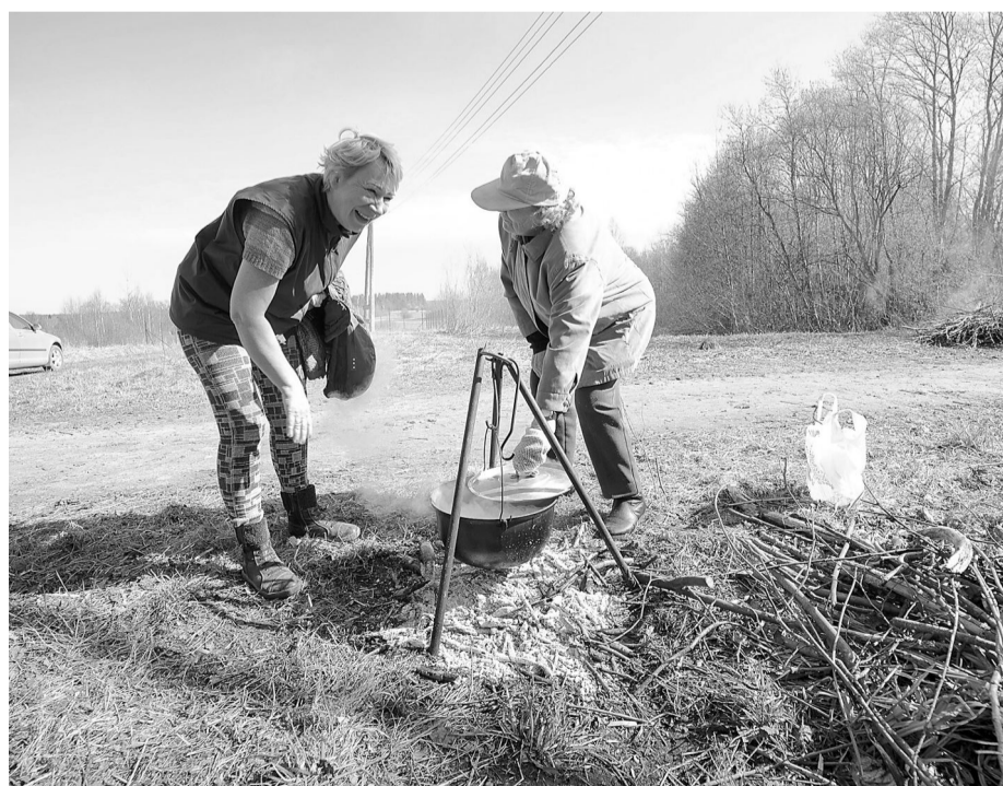
Protams, talcinieku zupa tiek vārīta talkas vietā.