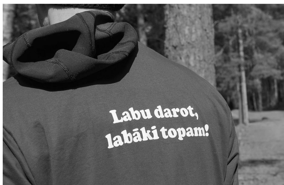
Tāda bija neliela daļa no Lielās talkas mūsu novadā.