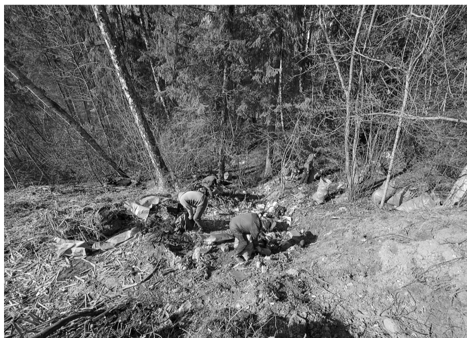
Bēdu ieleja. Māra Baltiņa brigādei nācās kārtīgi pasvīst vācot vienu no nelegālajām izgāztuvēm, kas izveidota ceļā no Priekuļiem uz Vaivi.