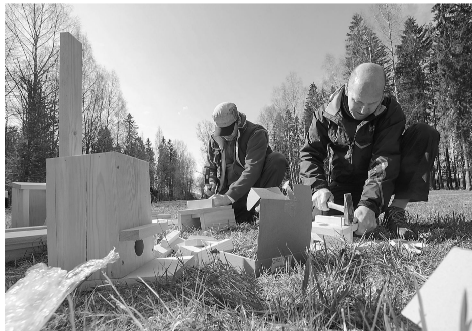
Top putnu būri no bezzaru priedes, tas ir nopietni!