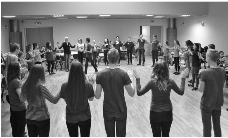
Matemātiķu vakara noslēgums bija fantastisks – dziedājām dziesmas, spēlējām aktīvas spēles, dejojām. Pasākums bija aizraujošs.