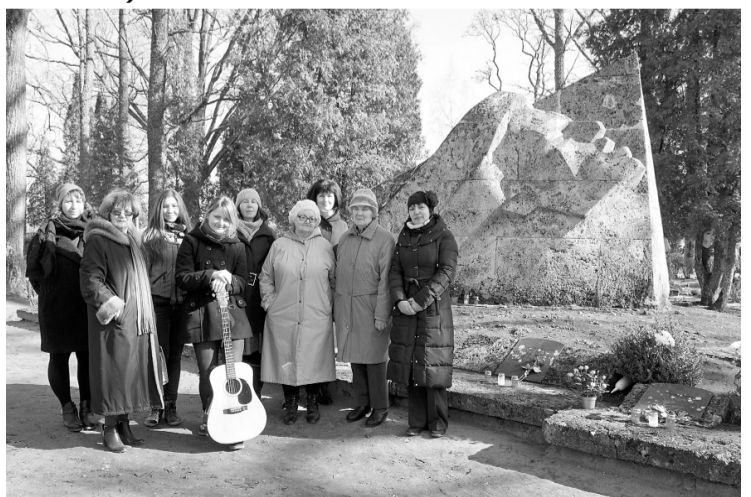
Dalībnieki pēc piemiņas brīža pie Veidenbaumu dzimtas atdusas vietas, fonā Eduardam veltītais piemineklis. “Isti ņem šos svētkus vērā Jaunkundzītes lielā mērā”