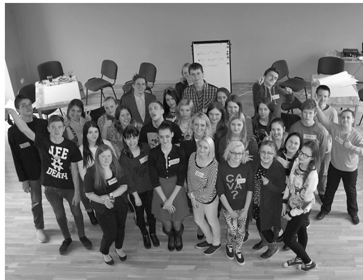
Jaunieši ir priecīgi par izdevušos forumu un gatavi jaunām aktivitātēm

Forumā pirmajā daļā notika iepazīšanās ar esošo situāciju jaunatnes jomā Priekuļu novadā. Otrajā daļā bija darbs grupās par jauniešu pašu izvirzītajām tēmām: jauniešu brīvais laiks, jauniešu līdzdalība, vides izglītība iestādēs un jauniešu veselība un veselīgs dzīvesveids, kā