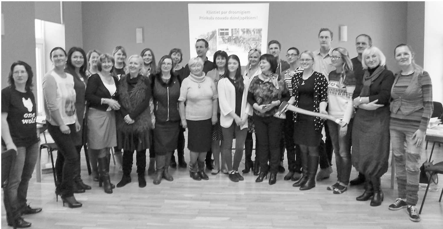
Spēles "Priekuļi – mūsu mājas šodien un rīt" dalībnieki ir apmierināti par piedalīšanos šādā projektā un atzīst, ka tas ir bijis vērtīgs cerot, ka kāda no izspēlētajām idejām varētu iedzīvināties arī realitātē