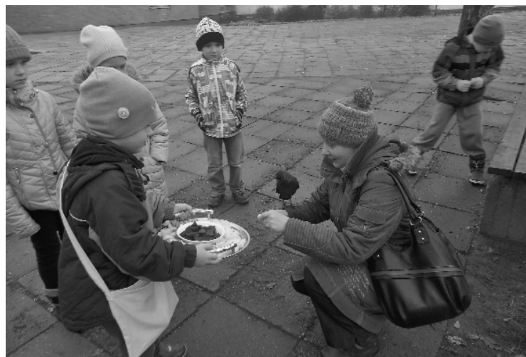
Ēst veselīgi, sporto aktīvi bērni māca visiem, arī Jāņmuižas kovārņiņim

Jau iepriekš vecāku sapulcēs, tika aicinātas ģimenes 8., 9.novembrī videi draudzīgām rīcībām mājās - kopā darbojoties,