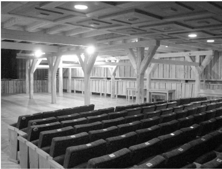
Daļējs ieskaits, kāda izskatījās kultūras nama lielā zāle pirms 10 gadiem