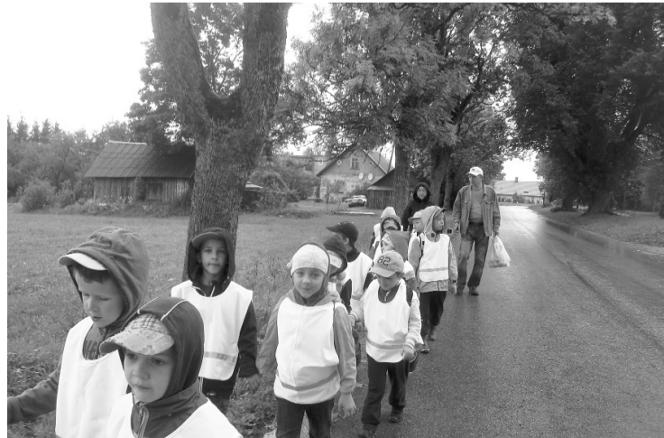
12. septembra rīts piektās grupas bērnus pārsteidza ar smalku lietutiņu, bet tas neapturēja bērnu vēlmi iet pārgājienā.

Drīz klāt arī bija ilgi gaidītais galamērķis – klusa, neskarta, rudens krāsās ieskauda Mazā Ellīte. Par to mums pastāstīja un izrādīja Velns, kurš šajā alā dzīvo. Kopīgi kūrām ugunsgrūdu, gājām rotaļās, cepām desiņas.