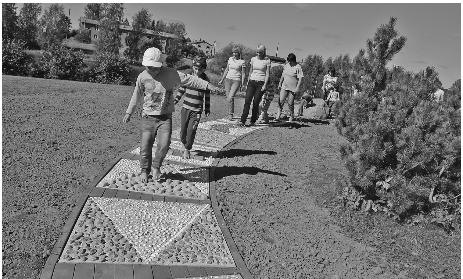
Bērni ir priecīgi un audzinātājas apmierinātas par Veselības takas izveidi

Kopējais takas garums - 50 metri, platums - 1 metrs. Zonas: