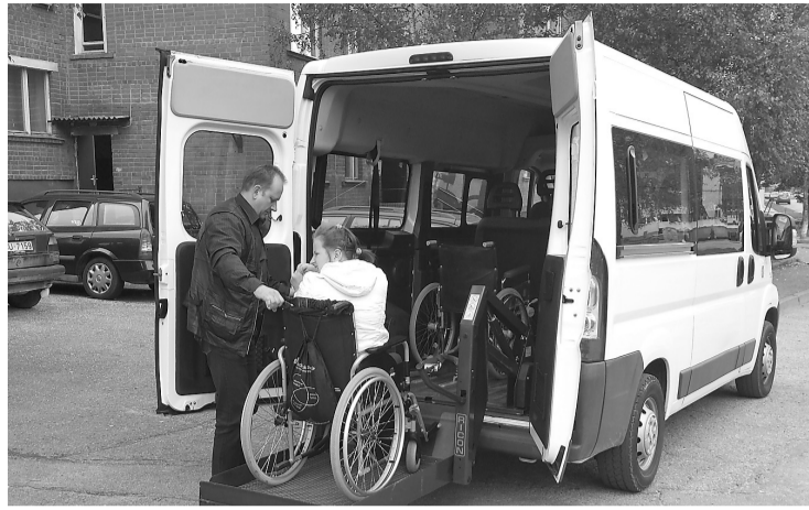
Klientu ērtībām specializētā autotransporta pakalpojumus nodrošina šoferis, kurš veic arī asistenta pienākumus - klientu nokļūšanu uz izglītības, ārstniecības un rehabilitācijas iestādēm

Tā kā bērnu ar īpašām vajadzībām pārvadāšanai katru dienu tiek patērēts ilgs laiks, šobrīd tiek plānotas iespējas paplašināt transporta pakalpojuma pieejamību citiem novadā dzīvojošajiem cilvēkiem ar kustību traucējumiem un izstrādāti noteikumi. Transportu nevar izmantot, ja cilvēks transportējams tikai guļus stāvoklī.