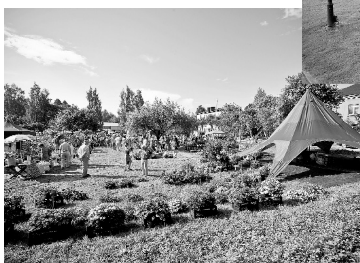
Plašajā stādu tirgū katrs varēja atrast savam dārzam piemērotāko augu