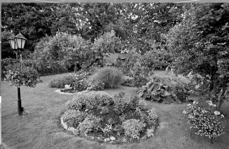
Privātajos dārzos varēja smelties dažādas idejas