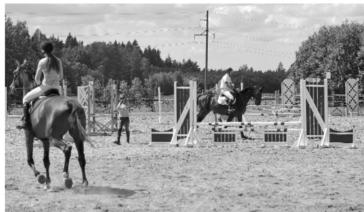
Kam tuvākas sportiskās aktivitātes, tie varēja paši piedalīties sporta spēlēs, vai vērot zirgu sacensības