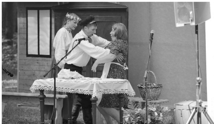
Arī teātris tika spēlēts uz nebēdu- lūk, „Trīnes grēki” izrādīti