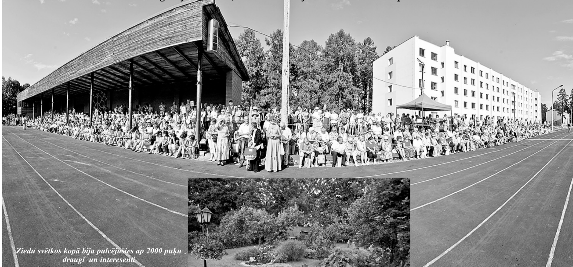
Ziedu svētkos kopā bija pulcējušies ap 2000 puķu draugi un interesenti

Pašā vasaras vidū Priekuļos pulcējās Latvijas Puķu draugi, lai iepazītos ar mūsu novada skaistākajiem dārziem, novada nozīmīgākajām vietām, lai smeltos idejas dārza dizainā un plānošanā.