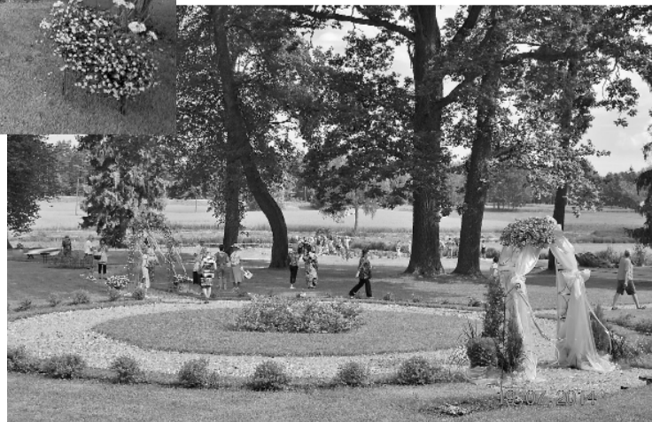
Veselavas muižas dārzs apmeklētājus priecēja ar plašumu un dažādajām ziedu arkām