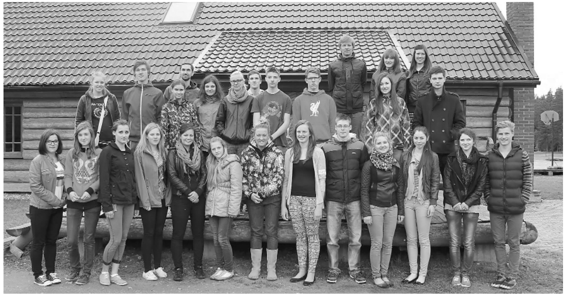
Visa kopējā jauniešu komanda apmācību laikā Amatas novada „Rakšos”

Savukārt Priekuļu novada jaunieši atzīst, ka radies ļoti labs iespaids par mūsu novada politiķiem. Paspēts pārrunāt vairāk nekā bija plānots. Radušās jaunas idejas, kā novada domes deputāti varētu mainīt priekšstatu par sevi jauniešu acīs. Politiķi ne tikai atbildēja uz jauniešu uzdotajiem jautājumiem, bet arī uzdeva sev interesējošus jautājumus, kas likās ļoti interesanti, jo ne vienmēr abas puses vēlas uzdot viens otram jautājumus. Jaunieši domā, ka Latvijā vairāk vajadzētu organizēt šāda veida tikšanās, lai katrs otrais jauniešs mainītu domas par politiku un lai visi