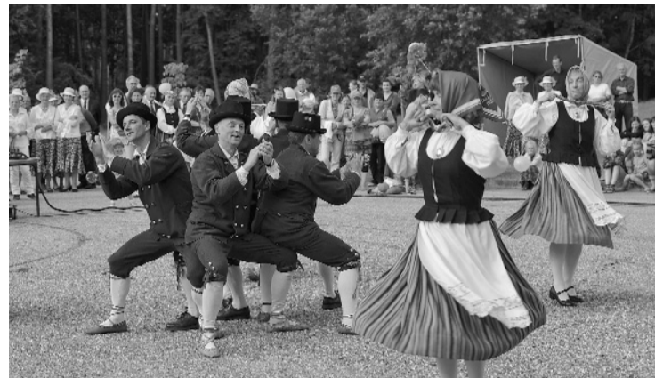
Vakarā, lielajā pašdarbnieku koncertā, skatītājus priecēja arī draugi no Palamuses.