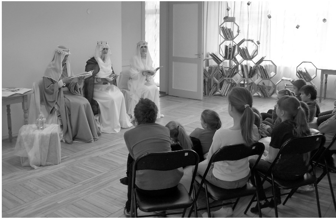
Klausītāji ar interesi dzīvo līdzī Baltu pasaku teicējām