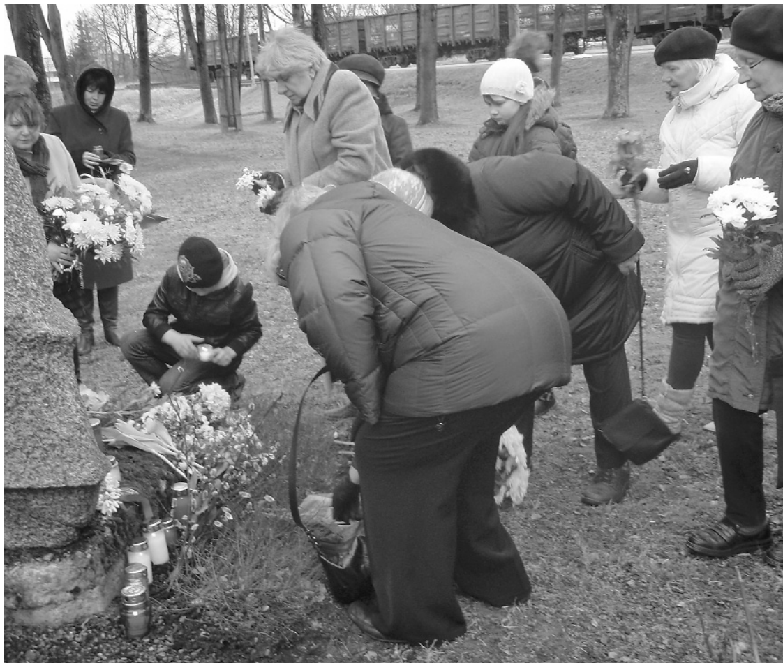
Lodes stacijā, pie piemiņas akmens gulst ziedi un tiek aizdegtas piemiņas svečītes, pirms 65 gadiem izsūtītajiem komunistiskā genocīda upuriem.

25.marts – Māras diena, piemiņas diena izsūtītajiem latviešiem, diena, kad daudzi cilvēki kavējas atmiņās, piemin savus tuviniekus, noliek ziedus pie piemiņas zīmēm dzelzceļa staciju tuvumā. 25.marts, vēl viena sēru diena latviešu tautas vēstures kalendārā.