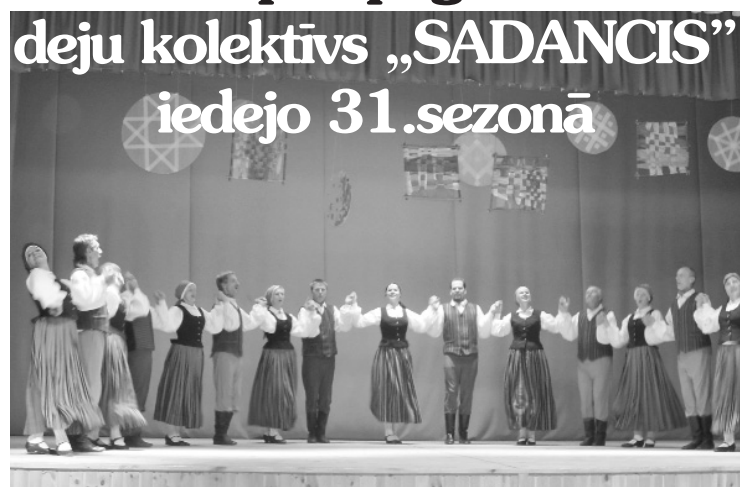
„Sadancis” savā jubilejas koncertā