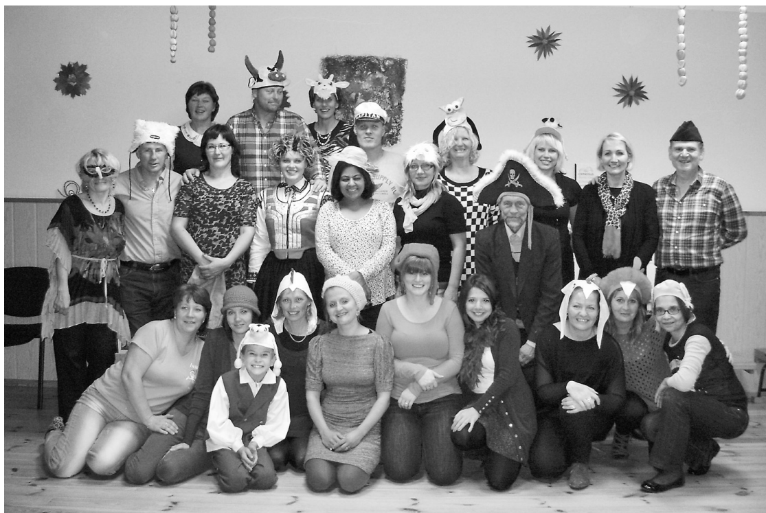
Veselavieši kopā ar viesiem piektdienas vakarā dziedāja, dejoja un izspēlēja dažādas rotaļas – visi ļoti apmierināti ar pasākumu

Šīs vizītes laikā apmeklējām divas speciālās skolas. Raiskuma internātpamatskolu, kur mācās bērni no visas Latvijas ar dažādiem fiziskiem un cita veida traucējumiem, un Cēsu 2. pamatskolu, kurā klase bērniem ar garīgās attīstības traucējumiem ir izveidota jaunā, lielā skolā blakus veselajiem bērniem. Rādot šos divus atšķirīgos modeļus, es gribēju partnerus iepazīstināt ar to, ka mūsu valstī ir divas pieejas bērnu ar īpašām vajadzībām izglītošanā. Daudz kas atkarīgs arī no finansējuma speciālās izglītības īstenošanai un no atbildīgo institūciju ieinteresētības. Mūsu valstī darbojas arī internāta tipa skolas, kas neatrodas pilsētu centros, bet ir vairāk nomaļus. Uz šīm skolām sabrauc bērni no visas Latvijas. Šeit strādā ļoti zinoši, kvalificēti speciālisti, skolotāji, kas var palīdzēt bērniem. Šī modeļa vienīgais trūkums – daudzi bērni tiek atrauti no ģimenes, jo uz mājām dodas brīvdienās vai tikai brīvlaikos. Skolas atrodas nost no sabiedrības acīm.