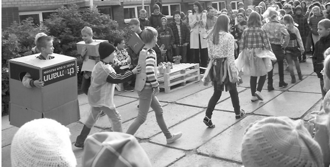
5.A klases skolēni iejutušies modelētāju lomā un svētkos izgāja modes parādē ar stilīgiem visdažādāko materiālu „atkritumu tērpiem”

Klāt rudens – saulains, lietais, krāsains, drūms – kāds nu kuru dienu, bet ir norises, kas kļuvušas stabilas. Šoruden jau devīto sezonu Priekuļu vidusskola svin ekoskolu Zaļā karoga svētkus. Priecājamies, ka Zaļais karogs – ekoskolu atpazīstamības elements – pierāda, ka iestāde ir izturējusi vērtējumu no vides izglītības daudzajiem un dažādajiem aspektiem.