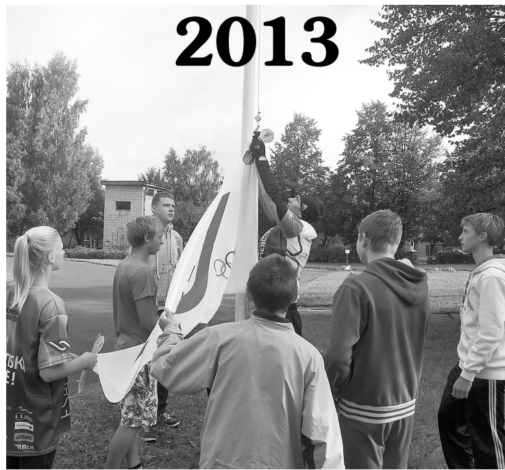
Olimpiskā diena sākās ar karoga uzvilcšanu mastā