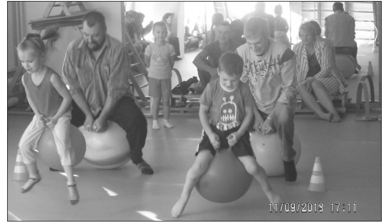
Azarts ir liels – kurš pirmais

Arī Jāņmuižas bērnu dārzā šogad jau trešo gadu svinam Tēva dienu. Tika aicināti tēvi un vectētiņi, lai atzīmētu šo dienu. Tēvus ļoti aizrāva šķēr-