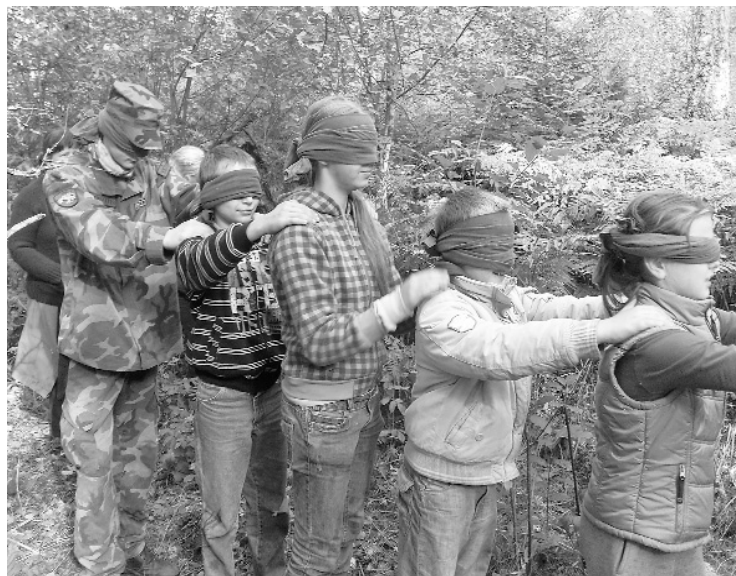
„Neredzīgā” komanda veiksmīgi tika izvadīta cauri mežam

Šogad jau piekto reizi bērni un jaunieši no Liepas, Mārsnēniem un Cēsīm varēja piedzīvot jaunus un nebijušas sajūtas, piedaloties dažādos pārbaudījumos. Piedzīvojums, kas mācīja cīnīties par uzvaru, darboties komandā, būt vienotiem, atbalstīt citam citu, iestāties par komandu, lika izvērtēt vai vienmēr var uzvarēt ar spēku, vai spēcīgāks ir tas, kurš prot lietot arī prātu. Spriedze, izaicinājums, savu personīgo bailu pārvarēšana, va-