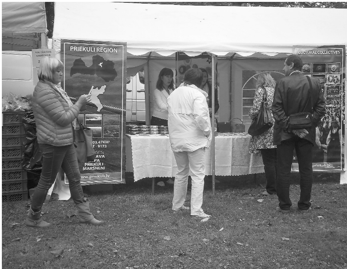
Priekuļu pašvaldības stends iekārtots un gatavs uzņemt apmeklētājus