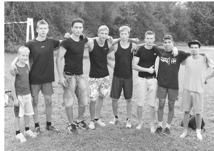
Liepas puīši, kuri cūīgi nodarbojas ar ielu vingrošanu