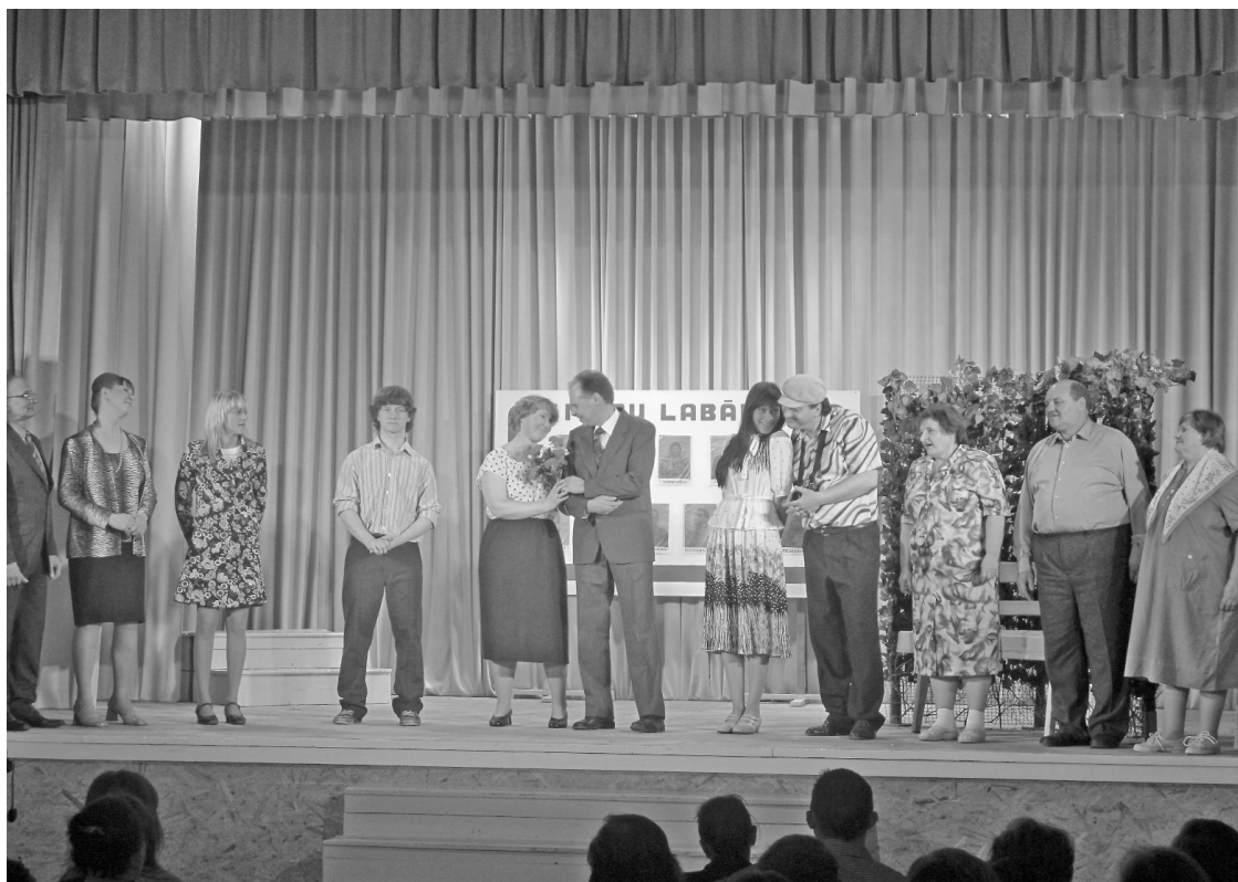
Izrādes gaitā tika noskaidrotas visas milas peripetijas