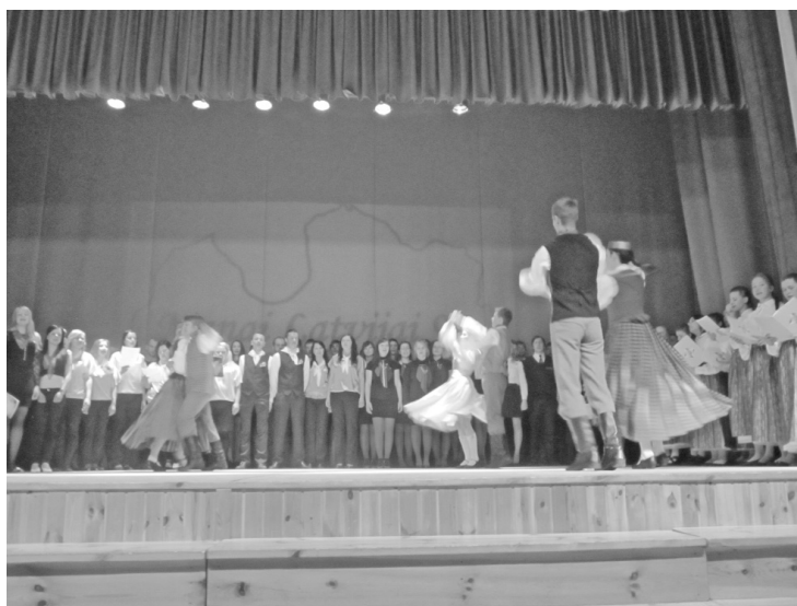
Pasākums tika atklāts ar kopdziesmu un deju „Cielaviņa”