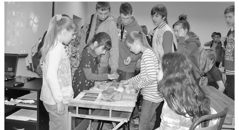
Skolēni vērgi aplūko izstādītās fosilijas