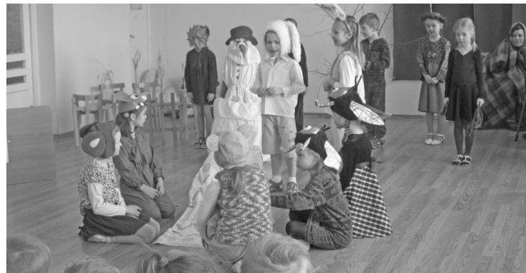
Vecākās grupas audzēkņi spēlē izrādē „Vecīša cimdiņš”

Mācību gadu mēs noslēgsim ar Rīgas leļļu teātra izrādē „Sprīdītis”. Taču vislielākais priekšmums bija sagaidīt pie sevis Liepas pamatskolas teātra kopu „Pi-