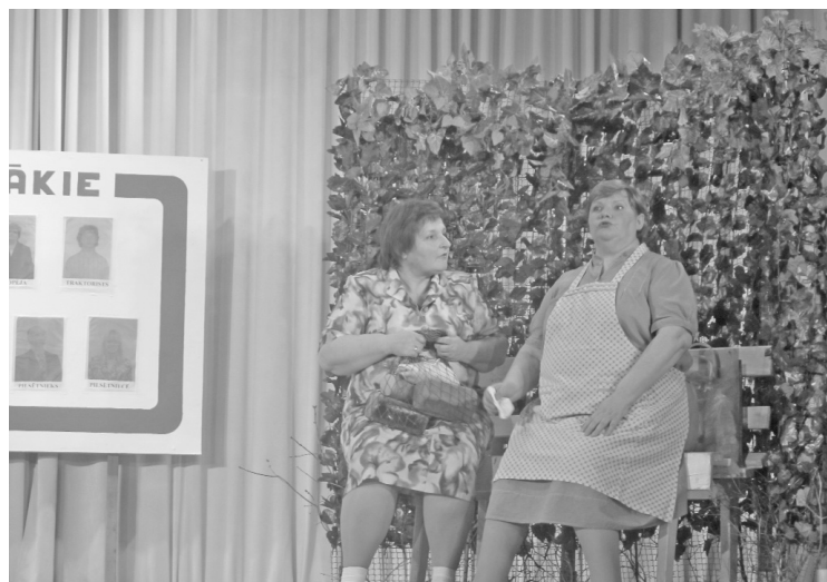
Pagasta sievu vidū, vienmēr tiek noskaidroti visi aktuālie notikumi