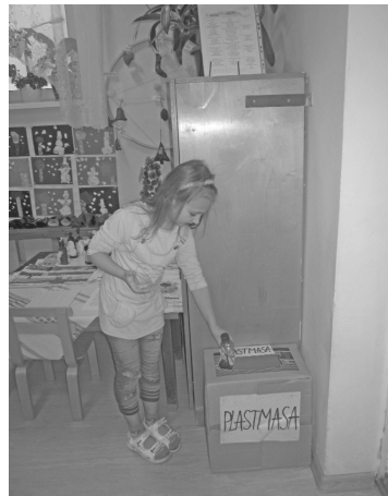
Bērni ir ieinteresēti un labprāt šķiro atkritumus

Šajā mācību gadā arī mēs Liepas PII „Saulīte” esam iesaistījušies Eko skolu programmā. Mūsu pirmā gada tēma ir „Skolas vide un apkārtnē.” Bērni kopā ar skolotājiem un vecākiem mācās veidot sakoptu, skaistu vidi. Esam izveidojuši Eko pado-