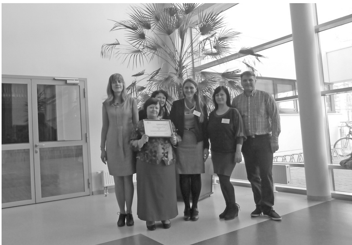
Jāņmuižas bērnudārza radošā grupa saņemot starptautisko sertifikātu