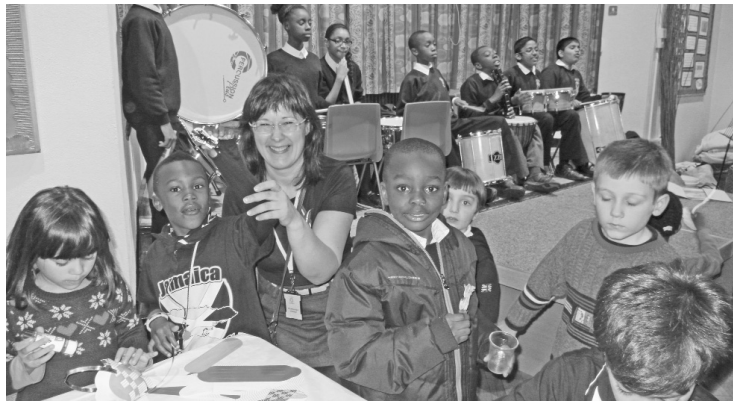
Draudzīgs viesošanās brīdis angļu klasē