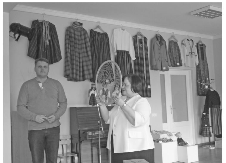
Jāņmuižas rokdarbnieču izstāde "Dzīparu pa dzīparam latvju rakstos iepinam"

cilvēki veido, uztur un dzīvo laimīgā sabiedrībā, bet nelaimīgi cilvēki nevar izveidot laimīgu sabiedrību. Un tāpēc nevar būt laimīgi cilvēki nelaimīgā sabiedrībā. Mēs šodien veidojam sava bērna, viņa nākošās ģimenes, viņu bērnu un mazbērnu nākotni. Tādā pat mērā mēs veidojam arī tās sabiedrības nākotni, kurā viņiem visiem būs jādzīvo. Mēs savu dzīvi uzlabot varam tikai vienā veidā – ieliekot savos bērnos to, ko gribam piedzīvot paši. Savukārt mūsu bērni var piedzīvot tikai to, ko mēs viņos esam ielikuši. Bērni savā dzīvē veiksmīgi var turpināt tikai mūsu ie-