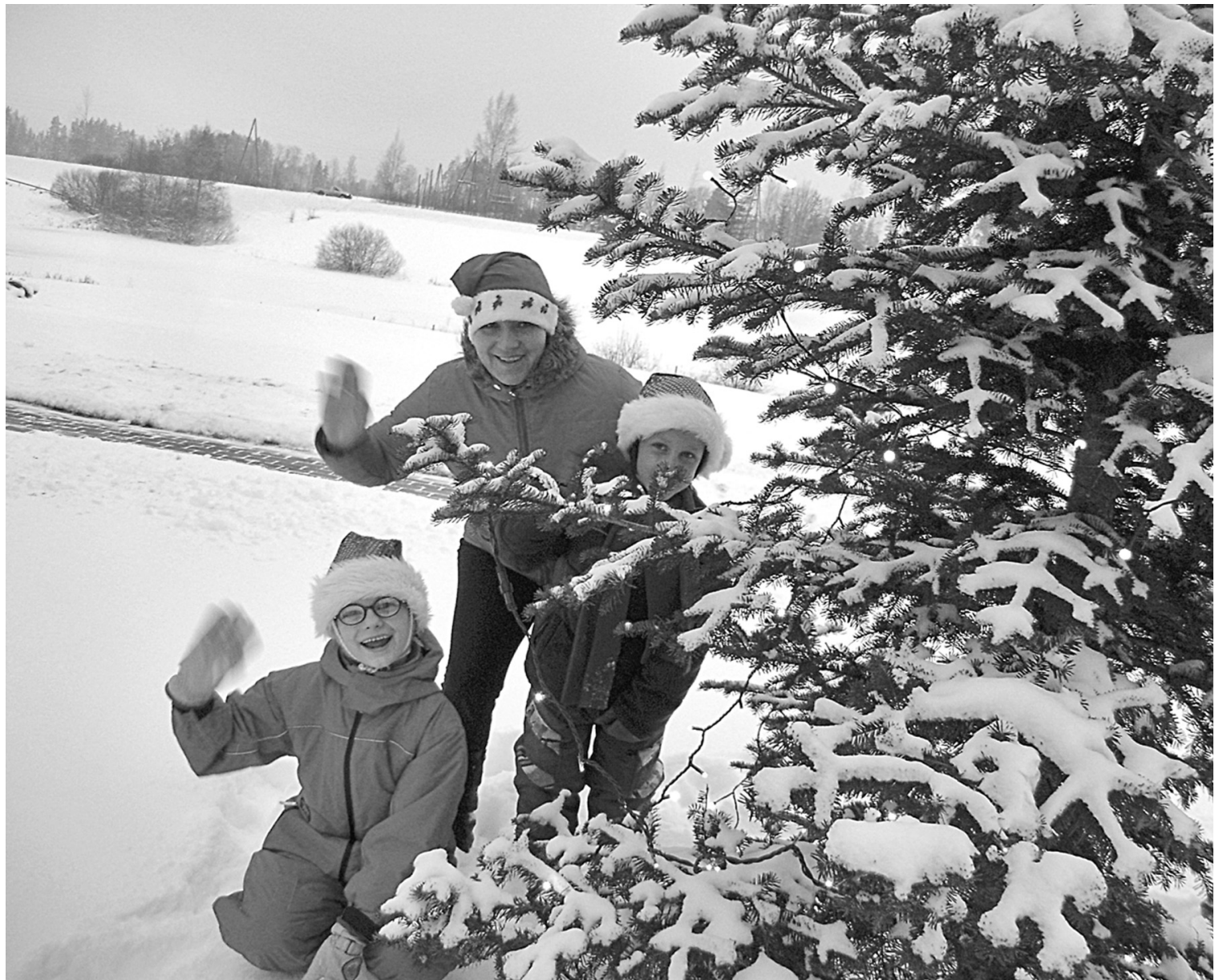
Rūķi ar saviem pārsteigumiem vienmēr ir gaidīti

Paši esam sagatavojuši dāvanīgas, iemācījušies dziesmas, dejas un dzejoļus un dodamies cie-