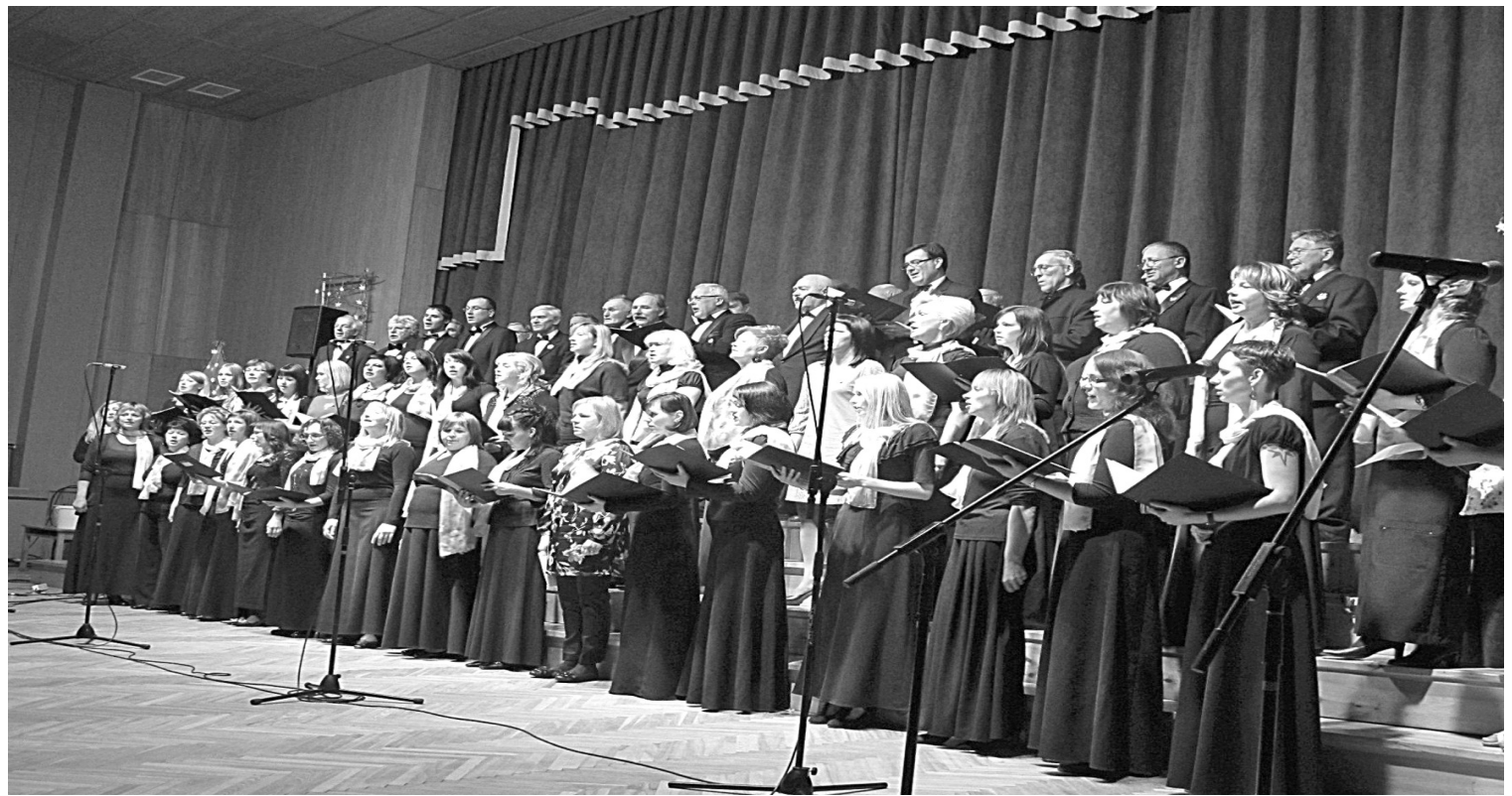
„Laumas” kopdziesmā ar saviem draugiem „Dziedoni” un bijušajām dziedātājām