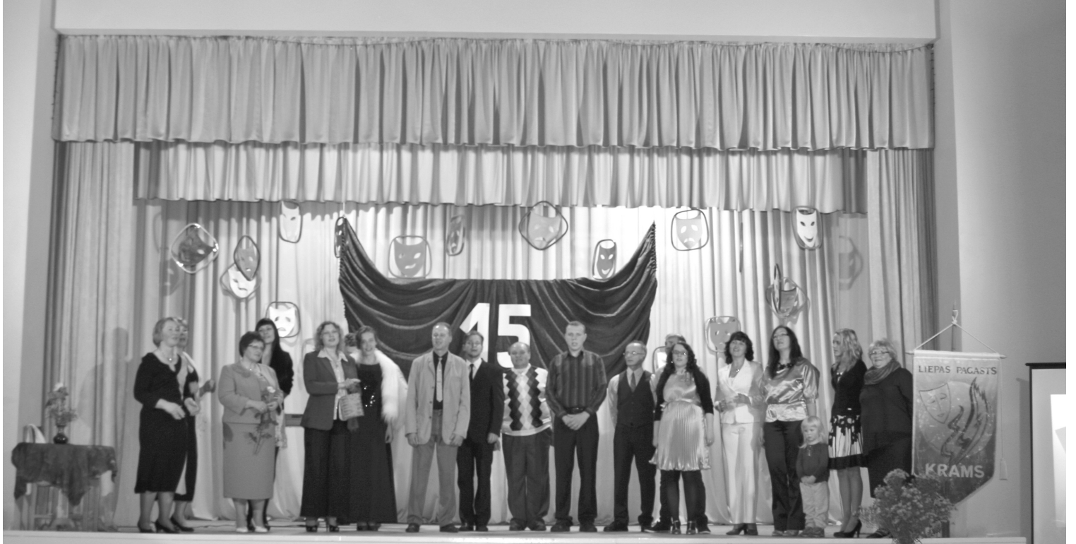
Teātra kopa „Krams” savā 15 pastāvēšanas gadu jubilejā

Savu piecpadsmito jubileju esam sagaidījuši kuplā pulkā – 20 aktieri. Visus piecpadsmit