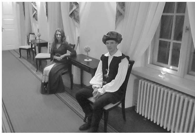
Leģendu naktī muižā senie laiki savijās ar mūsdienām