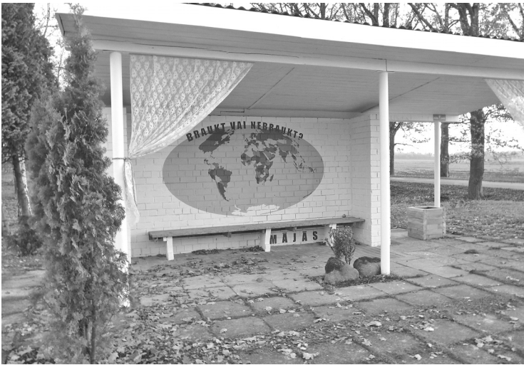
Šobrīd Jaunrauniešus, viņu viesus un caurbraucējus priecē balti nokrāsotā pietura ar krāsainu pasaules karti