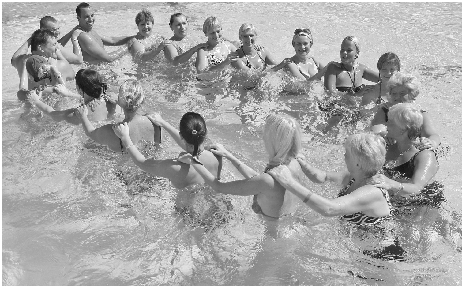
Dejotāji cītīgi izpilda ūdens aerobiku baseinā

Nedēļas laikā katrs pēc savas vēlēšanās un iespējām apmeklējām skaistākās, ievērojamākās vietas Turcijā. Pabijām turku pirtī, no kuras visi iznāca mazliet lokanāki, smaidošāki un spirtāki. Devāmies pārbraucienā ar džipi uz antīko Olympos pilsētu. Iespaidīgi nakts tumsā bija vērot „Degošo kalnu” (kā to nodēvējuši vietējie iedzīvotāji), kur uguns