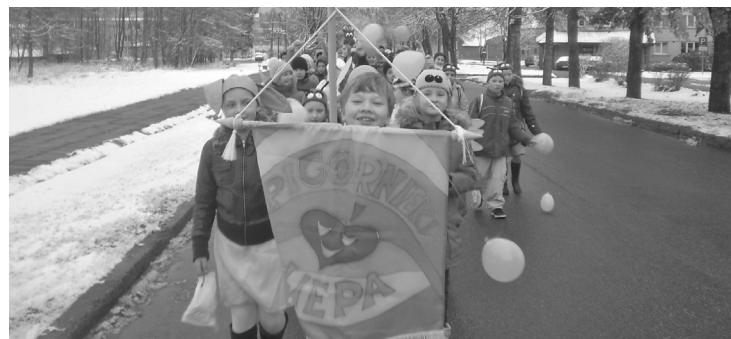
Teatralizētais svētku gājiens no skolas uz Kultūras namu iepriecināja pašus dalībniekus un bija pārsteigums pagasta iedzīvotājiem