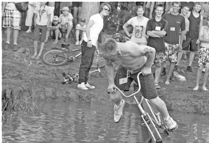
Attēla: Netradicionālais ritenītis, kurš izgājis cauri visiem 10 gadiem.

Sporta svētki Mārsnēnu pagastā notiek kopš 1996.gada vasaras, kad pie Tautas nama pļaviņā tika organizētas sporta spēles. Tad volejbola spēlei paši dalībnieki bija izveidojuši improvizētu volejbola laukumu. Ir tapis arī Sporta svētku karogs. Pirmajos gados Sporta svētkus organizējam kā jautra atpūtu ar sportiskām aktivitātēm, bet ar katru gadu dalībnieki arvien nopietnāk gatavojas. Arī šogad, 20.augustā, Mārsnēnu pamatskolas sporta laukumā notika pagasta sporta svētki. Lietus nevienu nenobiedē. Sacensībām piesakās 11 komandas (katrā 8 dalībnieki), kā arī dalībnieki individuālajām sacensībām, pavisam apmēram 120 dalībnieki.