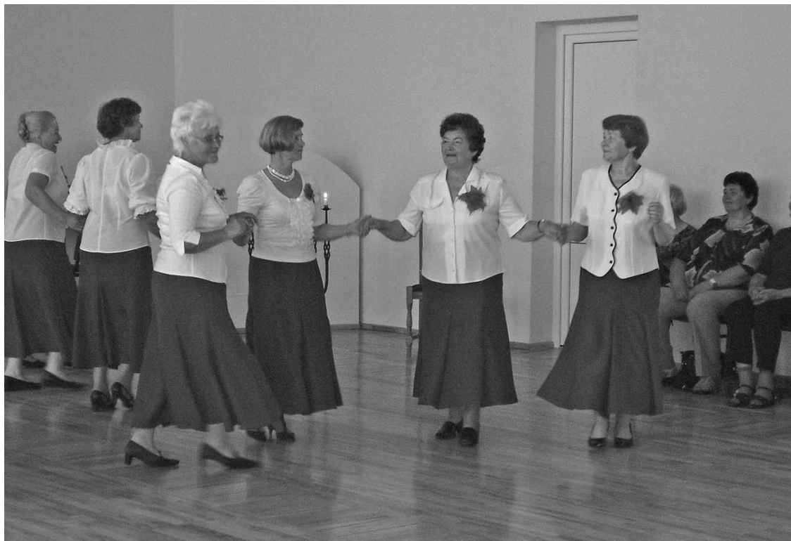
Attēla: Arī jubilejas pasākumā dāmas virpuļoja raitā deju soli

Jūnija sākumā Priekuļu pagasta pensionāru klubs „Mežrozīte” svinēja savu 10 gadu pastāvēšanas jubileju. Šobrīd klubā darbojas 27 aktīvas pensijas vecuma dāmas, bet uz svētkiem bija ieradusies krietni vairāk, jo no „Mežrozītes” pirmsākumiem klubā savu aktivitāti ir izpau-