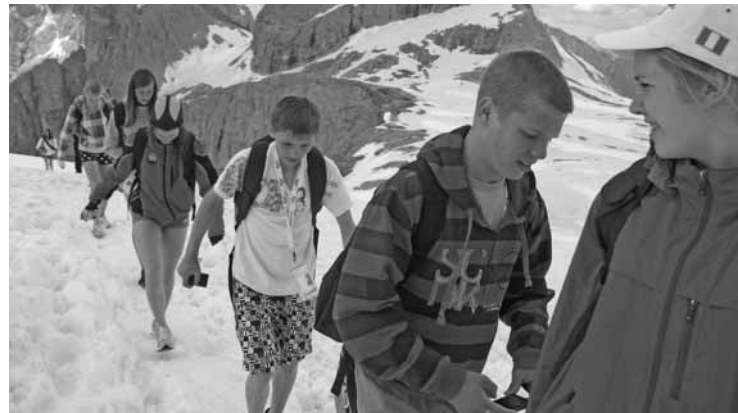
Attēlā: Sacensību dalībnieki kalnu pārgājienu sasniedza virsotni 2743m augstumā