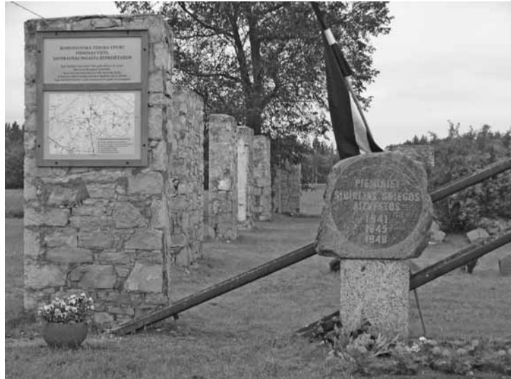
Attēlā: Komunistiskā genocīda upuru piemiņas vieta Jaunraunā

Ar visas Latvijas tautas atbalstu uz salas Koknesē top Likteņdārzs. Nav dienas, kad to neapmeklētu cilvēki no visdažādākajām Latvijas vietām. Pavasarī, vasarā un pat vēlā rudenī - arī talcinieki. Iemesli, kāpēc cilvēki grib iesaistīties, katram ir savi, tomēr viņus visus vieno viena lieta - vēlme ar savu darbu