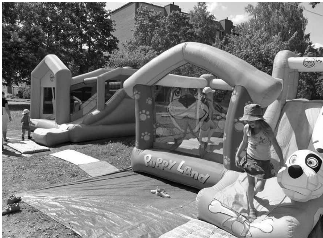
Attēlā: Bērni priecājās piepūšamajās atrakcijās