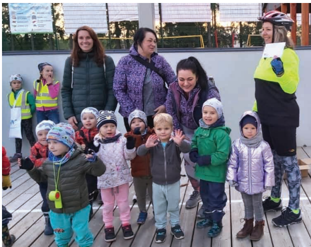
Peldbaseina “Rifs” dāvanu – atpūtu baseinā – laimēja “Rūķīšu” grupiņa.

Ceturtdien, 19.septembrī, Eiropas Mobilitātes nedēļas ietvaros notika ikgadējais pasākums “Mežmalīņa RIPO”, kad rīta pusē Mežmalīņas bērni devās veiklības braucienos, savukārt vakarā bērni kopā ar vecākiem devās izbraukumā ar velosipēdu cauri Priekuļiem.