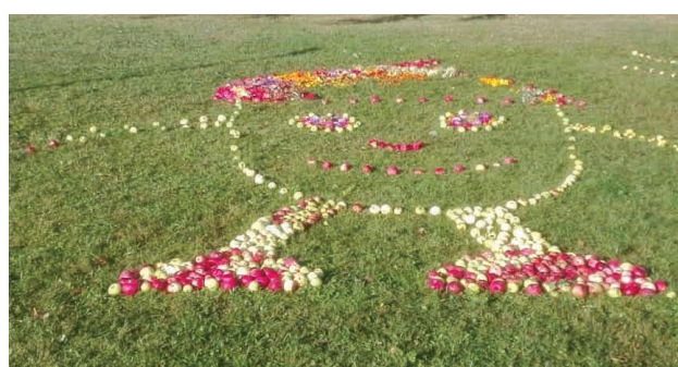
Priekuļu vidusskolā Zīļuks uz Miķeļdienu ved rudens veltes