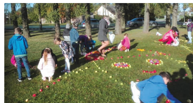
Priekuļu vidusskolas bērni veido rudens velšu Zīļuku