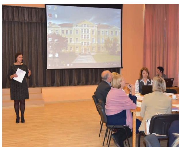
26.septembrī, Vidzemes Tehnoloģiju un dizaina tehnikumā notika Vidzemes reģiona diskusija "Pieaugušo izglītības īstenošana Latvijā" Izglītības un zinātnes ministrijas īstenota Erasmus+ programmas projekta "Nacionālie koordinatori Eiropas programmas īstenošanai pieaugušo izglītībā" ietvaros