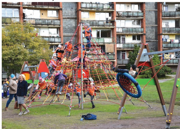
Bērni izmēģina jaunajā rotaļu laukuma iekārtas

Liepas rotaļu laukuma izbūvēja SIA "MK Dizains", projektēja SIA "Marta saule", bet būvuzraudzību veica IK "J.B.Projekti".