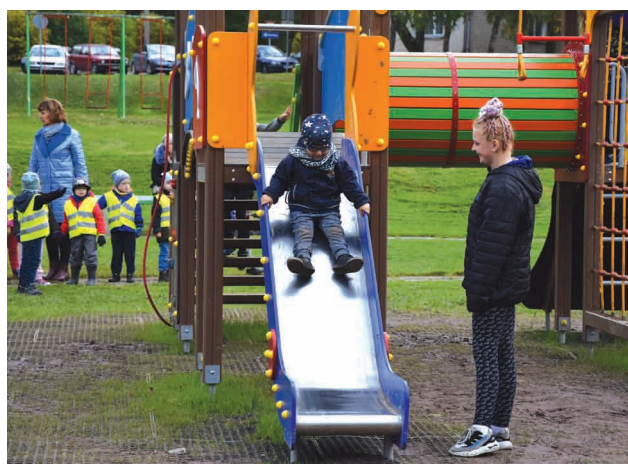
Jaunajā bērnu rotaļu laukumā ikviens atradīs sev kādu piemērotu aktivitāti