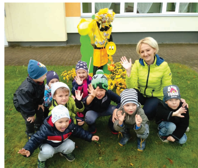
Miķeļdienu Liepas PII "Saulīte" ar rudens krāsā izveidotu Putnubiedēkli, lai tas sargātu rudens dārzeņus