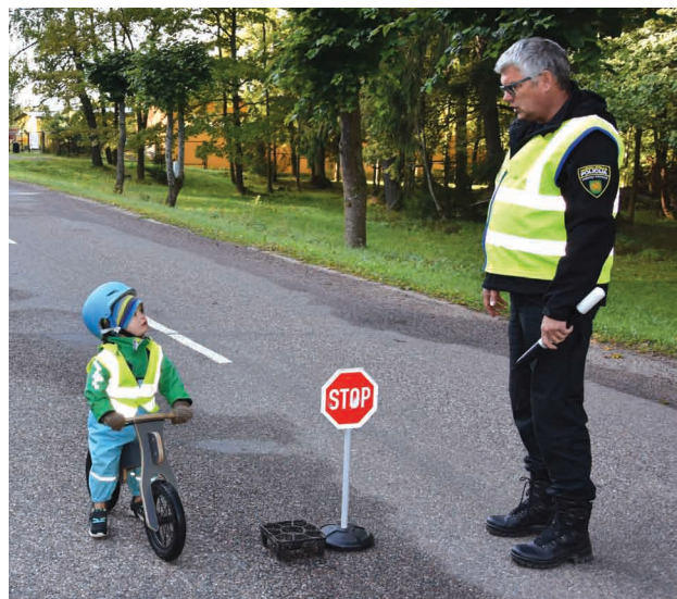
Priekuļu novada pašvaldības policija rūpējas par bērnu drošību uz ceļa