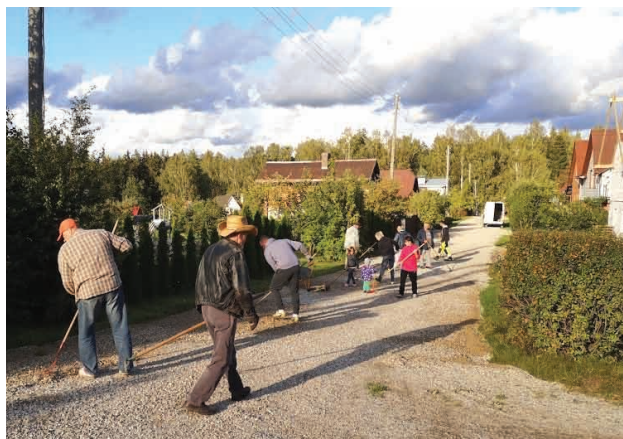
Strautmaļu ielas iedzīvotāju talka.

Neformālā grupa "Strautmaļi" pateicas visiem Strautmaļu ielas iedzīvotājiem, kas piedalījās talkā!