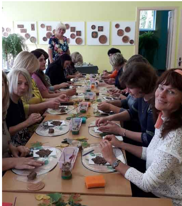
Radošās darbnīcas mākslas studijā, veidojot māla lapiņas.

"Saulīšu" salidojuma tradīcija tika aizsākta Lietuvā, kur jau vairākus gadus satiekas visi bērnudārzi ar nosaukumu "Saulīte". Pārņemot ideju no kolēģiem un atklājot, ka mūsu valstī ir 19 pirmsskolas izglītības iestādes ar šādu