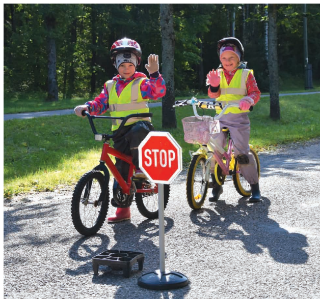
Eiropas mobilitātes nedēļā PII "Mežmalīņa" audzēkņi apgūst drošas riteņbraukšanas prasmes