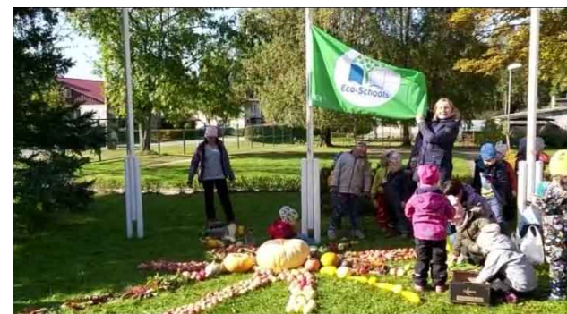
Zaļā karoga pacelšana pie PII "Mežmalīņa".

Saulainā ceturtdienas rītā "Mežmalīņā" notika liela rošība. Pirmsskolas iestādes bērni kopā ar savām skolotājām laukumā pie karoga mastiem kārtoja dažādas rudens veltes. Drīz vien daudzkrāsaina saulīte ar 7 stariņiem (tik bērnudārzā ir grupiņu) bija gatava.