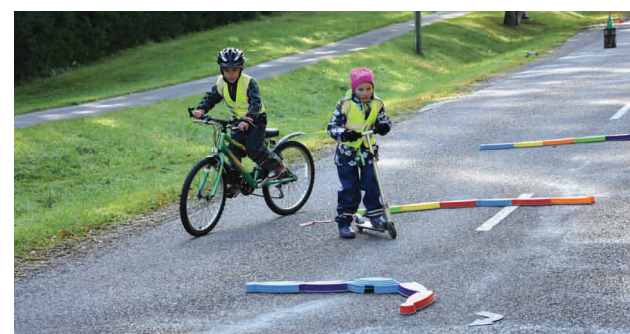
Mežmalīņa RIPO riteņbraukšanas prasmju vingrinājumi

Priekuļu novada pašvaldības informatīvais izdevums "Priekuļu novada vēstis". Bez maksas izdevums. Iznāk reizi mēnesī. Metiens – 2000. Izdevējs: Priekuļu novada pašvaldība, Cēsu prospekts 5, Priekuļi, Priekuļu pag., Priekuļu nov. Tālr. 64107871. Kontaktinformācija: Priekuļu novada pašvaldības