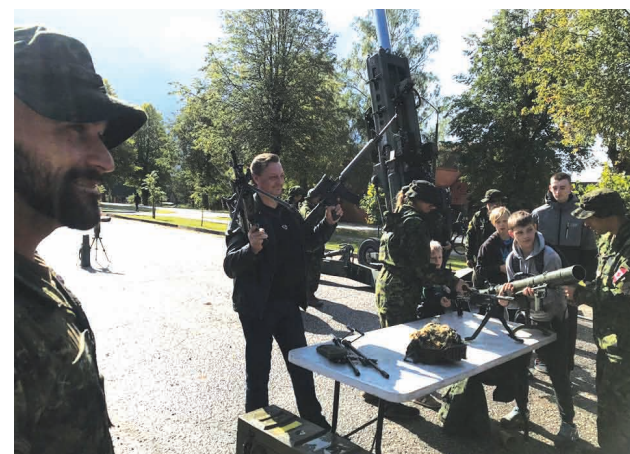
Liepā militāro mācību ietvaros bija iespēja apskatīt militāro tehniku un satikt klātienē karavīrus.