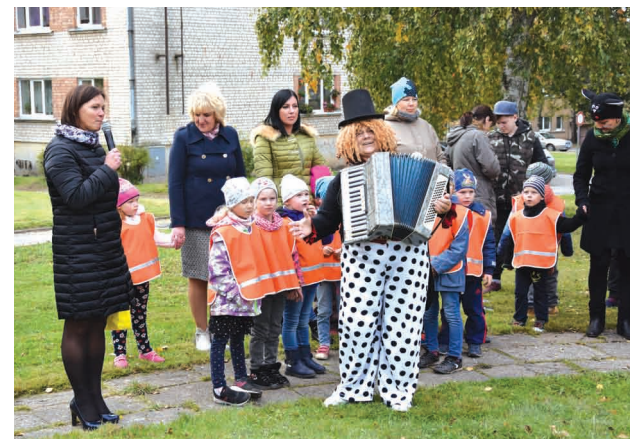
Rotaļu laukuma atklāšanā Liepā bija atlidojis Karlsons, kurš kopā ar bērniem gāja rotaļās