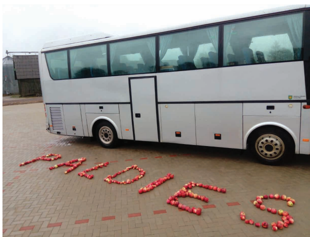
Pasākuma "Iebrauc manā dārzā buss" atklāšanas dienā.

Līgums par stāvlaukuma projektēšanu tika noslēgts 2017. gadā. 2018. gadā noritēja projektēšanas darbi, savukārt, būvdarbi apgaismojuma un laukuma ierīkošanai notika 2019. gadā. Kopējās apgaismojuma un stāvlaukuma izbūves izmaksas bija 169 917 EUR. Būvdarbus veica SIA "SiMC" Tā kā stāvlaukuma atklāšanas dienā laika