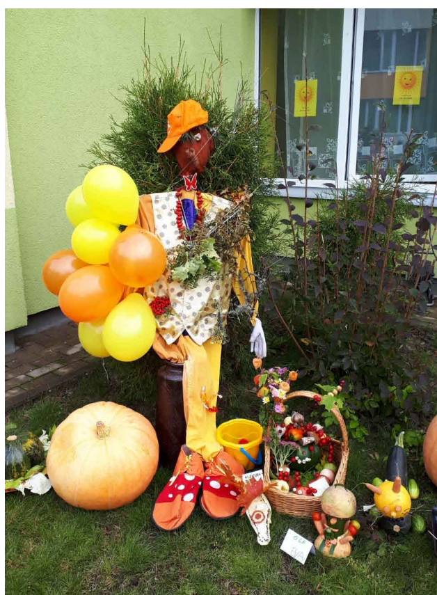
Rudens dārza sargs Liepas PII "Saulīte"