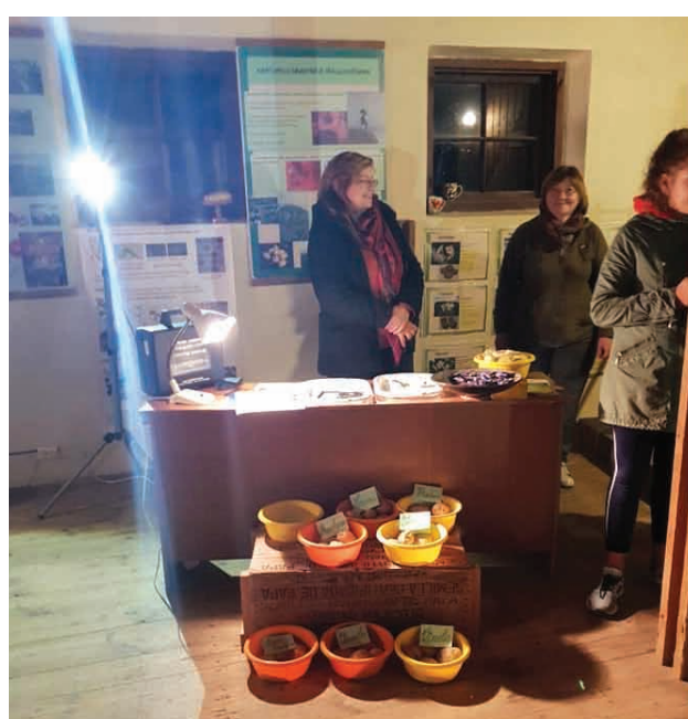
Zinātnieku nakts Agrosursu un ekonomikas institūtā