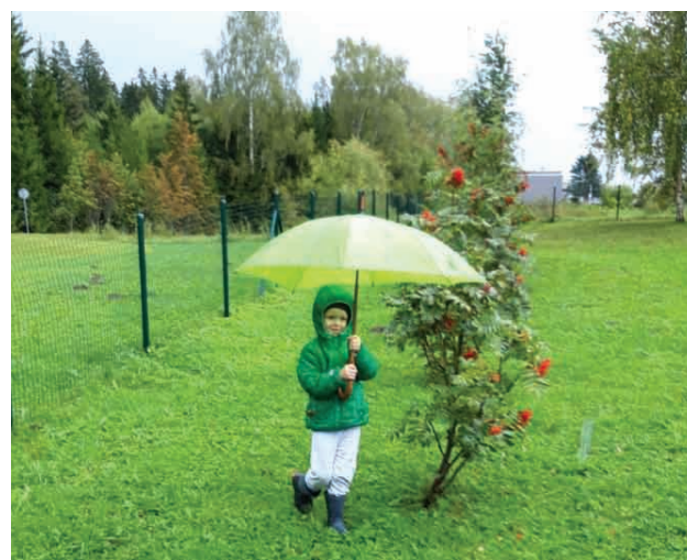
Daba kā fantastiska klase, kur mācīties

No 2019.gada septembra Veselavas pirmsskolas izglītības iestāde uzsāk Erasmus+ programmas projektu “Daba kā fantastiska klase, kur mācīties”. Projekta ietvaros pedagogi dosies mācībās un uz Zviedriju un Portugāli, kur apgūs jaunas metodes, atkārtos jau zināmās, kā rosināt bērnus pētīt, kritiski domāt, gūt sev interesējošas zināšanas, sadarboties ar vienaudžiem, darbojoties ārā vidē. Lai šo projektu īstenotu, daudz vairāk laika kopā ar bērniem pavadīsim svaigā gaisā, uzmanību pievērsīsim izglītojošu uzdevumu un aktivitāšu saplānošanai ārā, lai rosinātu bērnus ar lielāku interesi paraudzīties apkārt, izprast dabā notiekošos procesus, ieraudzīt gadalaikiem atbilstošās pazīmes, gadalaiku maiņu. Mēs šo projektu varam īstenot ar aizrautību un prieku, jo iestādes apkārtnē ar plašu teritoriju, pļāvām, dīķiem, mežu apkārt to rosina.