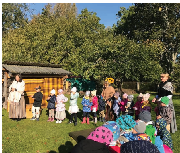
Miķeļdienā Jāņmuižas PII kopā ar Miķeli, Saimnieci, Maiznieku, lielām un mazām pelītēm dejoja, dziedāja, gāja rotaļās un cienājās ar maizi