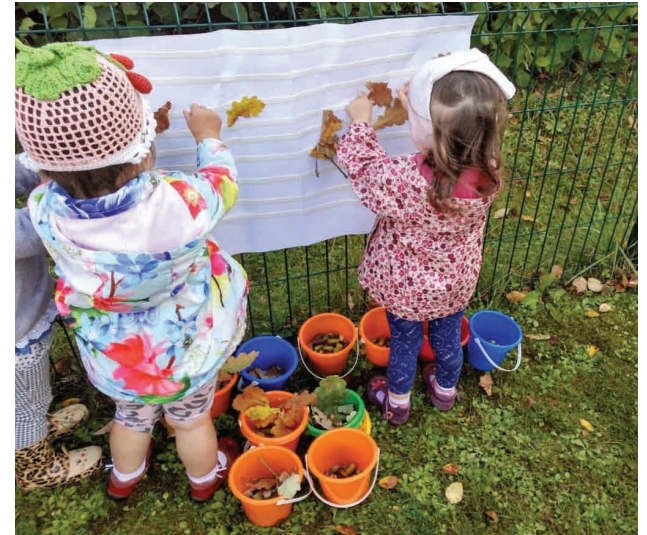
Vide, kas rosina darboties.

novada Liepas pagasta Skangaļu muižā. Prezentācijā līdztekus āra vides aktivitātēm tika iekļautas arī projekta “100 steps” inovatīvās apmācības metodes.