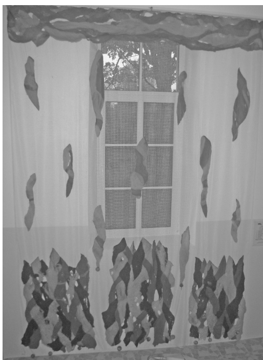
Projekta darbs Filcētais loga dekors

Tagad ir radīta vieta kur nedēļu nogalēs sanākt kopā, lai piemēram, noskatītos hokeja spēles, kā arī uzspēlētu galda spēles, parunātos pie tējas tases, apspriest sev aktuālas lietas, vai vienkārši paklausītos mūziku, uzspēlētu novusu. Ir ideja sarīkot novusa vai pokera turnīru, jo par