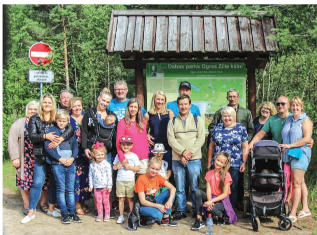
Ekskursijas dalībnieku kopbilde