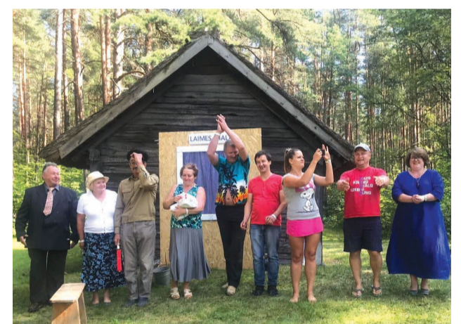
Pēc izrādes Latvijas Etnogrāfiskajā brīvdabas muzejā

Katru vasaru teātra dalībnieki ar ģimenēm dodas ekskursijā. Šogad devāmies iepazīt Kuldīgu, Saldu un Zvārdi. Interesants pieredzes apmaiņas pasākums notika Striķu kultūras namā, kur tikāmies ar turienes amatiereteātri un viens otram nospēlējām savus iestudējumus.