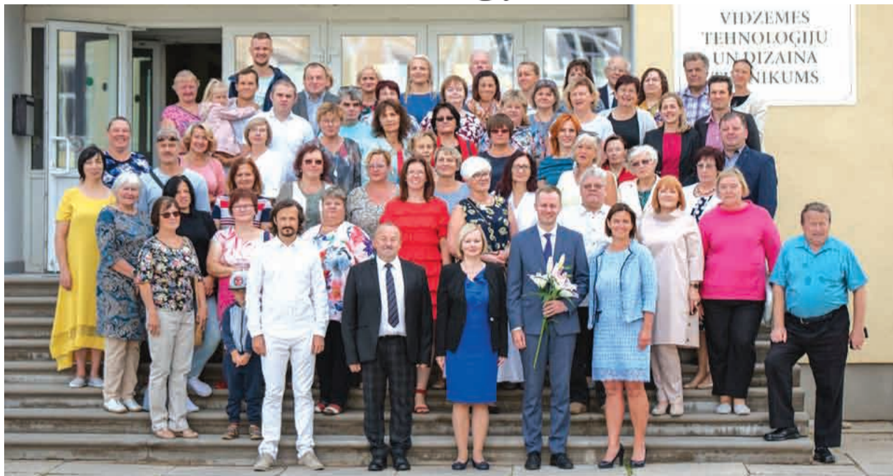
1. augusta oficiāli ar jaunu nosaukumu darbu uzsāka profesionālās izglītības kompetences centrs "Vidzemes Tehnoloģiju un dizaina tehnikums". Foto: No VTDT arhīva

Jau vairāk nekā 100 gadus Priekuļi lepojušies ar Valsts Priekuļu lauksaimniecības tehnikumu, taču 2019.gadā tas piedzīvojis reformas un nosaukuma maiņu. Vēl pirms gada noritēja diskusijas par Priekuļu tehnikuma un Cēsu Tehnoloģiju un Dizaina vidusskolas apvienošanu un vēsturiskā nosaukuma "Priekuļu tehnikums" maiņu, tomēr Izglītības un Zinātnes ministrija nepieņēma palikušā jaunā nosaukuma.