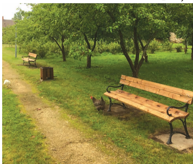
Uzstādītie soliņi un atkritumu urnas Skangaļu muižas pastaigu takā

Pavasārī Skangaļu muižas neformālā grupa pieteicās Priekuļu pašvaldības projektu konkursam “Sabiedrība ar dvēseli 2019” ar ieceri par atpūtas soli izvietojumu muižas pastaigu takās. Projektu pašvaldība atbalstīja, piešķirot tā mērķa izpildei 700 EUR finansējumu. Par šo naudu tika iegādāti 4 soli un 2 atkritumu urnas.