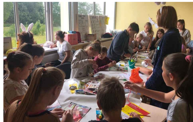
Radošā darbnīca vasaras skolas ietvaros

Liepā ciemojās jaunieši no 10 dažādām valstīm. Viņi bija ieradusies Valmierā, lai veiktu īslaicīgu brīvprātīgo darbu Valmieras Jauniešu ideju laboratorijā un radītu aktivitāti "Randiņš ar grāmatu", kuras mērķis ir piesaistīt ziedojumus, kurus izmantot Valmieras puses jauniešu iniciatīvas projektu izstrādē. Liepā jaunieši ciemojās, jo