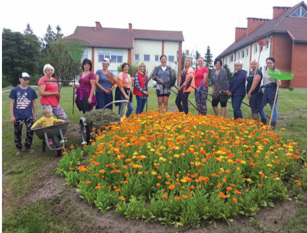
Pēc siena talkas jūlijā

“Sastapšanās prieku nosaka nevis pasaulīgās vērtības un praktiskie labumi, bet gan vārdos neizsakāma noskaņa un izstarotā labestība.”