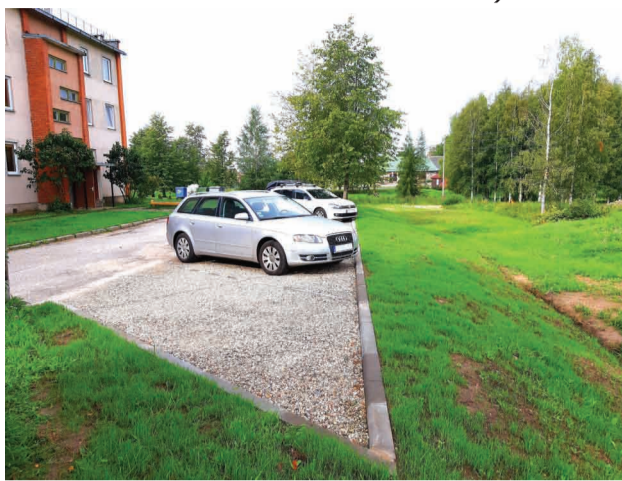
Teritorijas labiekārtošana pie daudzdzīvokļu mājas “Vārpa” Veselavā

Š.g. maijā neformālā grupa “Vārpa” piedalījās pašvaldības finansētajā projektu konkursā “Sabiedrība ar dvēseli 2019”, iesniedzot projekta pieteikumu teritorijas labiekārtošanai pie daudzdzīvokļu mājas. Projekta mērķis bija labiekārtot teritoriju, lai iedzīvotājiem, viesiem, iestāžu apmeklētājiem tā būtu droša un sakārtota, un operatīvajiem dienestiem pieejama.