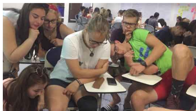
Latviešu jauniešu komanda cītīgi apspriež savas idejas un kaļ plānus.

Nokļuvuši galapunktā, Izmiras Universitātes telpās, mēs, ļoti pārguruši no garā ceļa, devāmies uz pirmajām nodarbībām. Tur mūs satika dalībnieki no Rumānijas, Portugāles, Turcijas. Dalībnieki mūs pieņēma draudzīgi un jauki. Sarunu valoda bija angļu, varbūt kādam tā bija labāka, kādam ne tik laba, bet ar laiku visi sapratāmies. Projekts bija saistīts ar mūziku, kā arī ar biznesa plānu veidošanu. Projekta laikā mēs apskatījām konservatoriju un iepazīnām Izmiru. Protams, bija arī kultūras vakars. Mēs bijām sagatavojuši pašmāju zefirus, Jāņu sieru un šprotes.