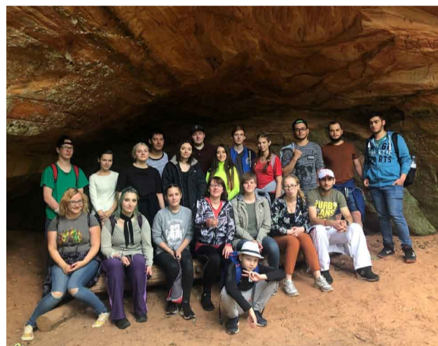
Pārgājiens uz Līču - Laņģu klintīm kopā ar 10 jauniešiem no dažādām valstīm, kas veic brīvprātīgo darbu Latvijā

Valmieras Ideju laboratorijas jauniešiem jau ir izveidojusies cieša draudzība ar Priekuļu jauniešu centru jauniešiem, un šis bija brīnišķīgs veids, kā veidot vēl ciešākas draudzības saites un vietējiem jauniešiem parādīt, kā brīvo laiku vasarā pavadīt lietderīgi, brīvprātīgi strādājot un apgūstot jaunas prasmes. Citu valstu jauniešiem bija iespēja vēl mazliet vairāk iepazīties ar Latvijas dabu un cilvēkiem, dodoties kopīgā aktivitātē uz Līču - Laņģu klintīm un tad baudot pikniku un neformālas sarunas Liepas jauniešu centra "Apelsīns" telpās.