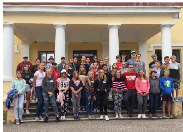
Kopbildē nometnes “ČETRAS ATSLĒGAS” dalībnieki un pedagogi pie Dzērbenes muižas pils

Izglītojoša atpūtas nometne Amatas, Jaunpiebalgas, Līgatnes, Pārgaujas, Priekuļu, Raunas un Vecpiebalgas novadu talantīgajiem skolēniem vecumā no 14 līdz 17 gadiem “ČETRAS ATSLĒGAS 2019” šogad norit Vecpiebalgas novadā – Dzērbenē.