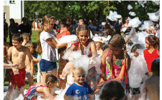
Putu ballīte DraiskoTAVĀ