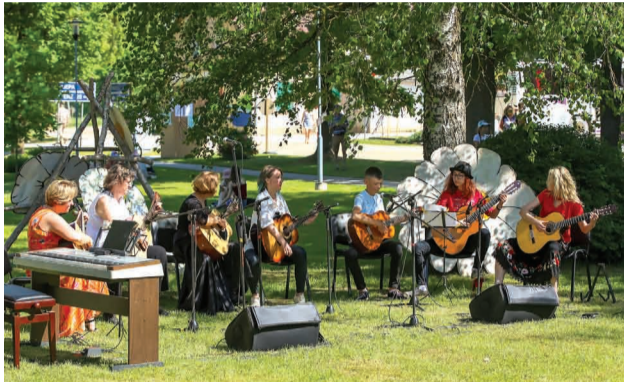
Skatītājus priecē Mārsnēnu ģitārspēles pulciņa dalībnieki