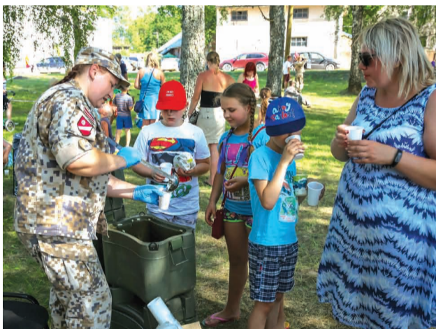
Zemessargi no Zemessardzes 27.kājnieku bataljona ne tikai iepazīstināja ar savu darbu, bet arī cienāja ar gardu sulu