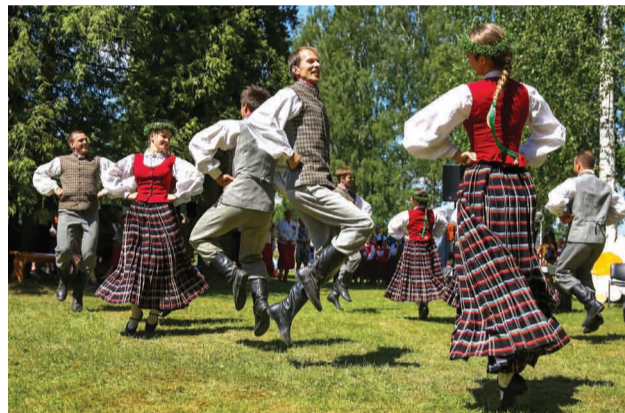
Priekuļu novada māksliniecisko kolektīvu uzstāšanās