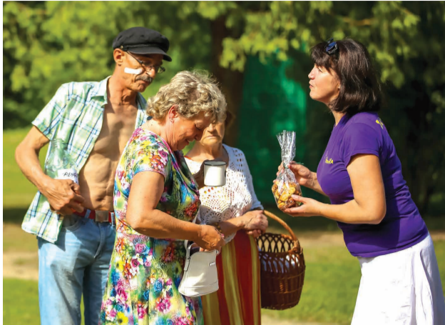
Kas vienam lieks, tas otram prieks!