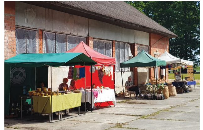
Lauku labumu tirdziņš