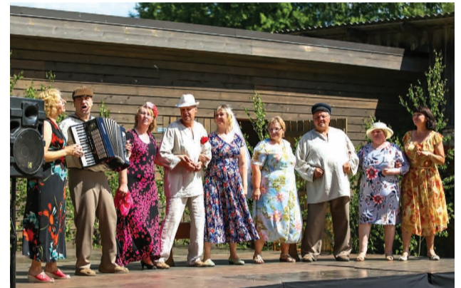
Teātra kopa “Krams” uzstājas ar izrādi “Atnāk jauka vasariņa”