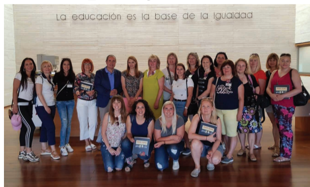
Projekta "100 Steps" dalībnieki Castillala Mancha izglītības pārvaldē

Apmeklējām arī Pedro Munoz pilsētas bērnudārzu, kurā audzēkņus uzņēma no 1 mēneša vecuma, šīs mazbērnu