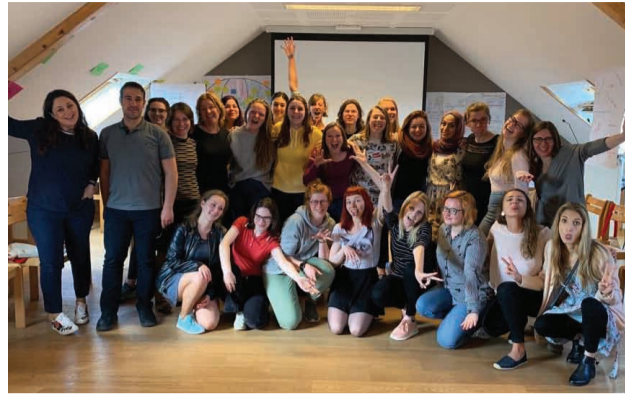
BITrimultTi apmācības Beļģijā

Apmācības noritēja 5 intensīvu dienu garumā, kuru laikā tika aplūkotas dažādas metodes darbā ar jaunatni, vadīts grupu darbs, internacionāls vakars, apskatīta teorija par projektu sagatavošanu, kā arī uzrakstīti projekti jauniešu apmaiņām. Darbs noritēja neformālā gaisotnē, izmantojot neformālās darba metodes, grupu darbu, dažādas spēles un profesionālu literatūru darbā ar jauniešiem. Apmācību laikā ieguvu daudzus jaunus kontaktus, jaunas metodes darbā ar jauniešiem, kā arī uzlaboju savas angļu valodas prasmes,