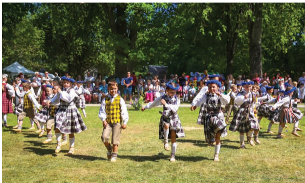
BDK “Tūgadiņš” uzstāšanās Mārsnēnos