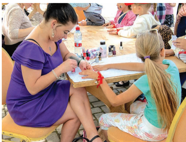
Bērni piedalās dažādās radošajās darbnīcās