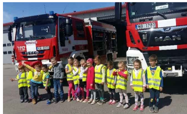
Lielās automašīnas un mazie mēs...

Pēc četrdesmit minūšu brauciena ugunsdzēsēju depo pagalmā ieripoja 23 mazi un lieli velosipēdi. Braucējus sagaidīja divi braši ugunsdzēsēji, un ekskursija varēja sākties. Tika stāstīts par to, cik uguns ir bīstama un visiem jābūt maksimāli piesardzīgiem, rīkojoties ar to, aplūkotas lielās ugunsdzēsēju automašīnas, izpētītas lietas, kas tajās atrodas, ko ar tām dara. Ugunsdzēsēji uzsvēra to, ka tiem, kas vēlas kļūt par ugunsdzēsējiem, jābūt fiziski sagatavotiem, drosmīgiem, jāprot darboties komandā, jāiemācās visas lietas noliekt savās vietās, jābūt disciplinētiem. Pieaugušie un mazie viesi uzdeva neskaitāmus jautājumus par to, kā tiek dzēsts ugunsgrēks, vai nav bail iet degošā