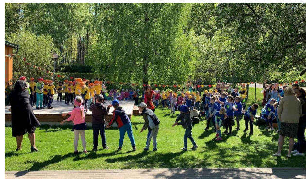
Cilšu sadancošanās.

Dodoties mājup, katra cilts saņēma mājas uzdevumu – izdrukātu karti ar noieta dienas maršrutu, kuru ikvienam