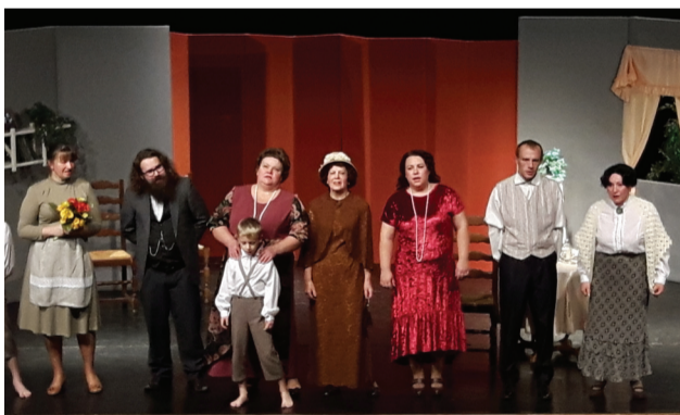
Mirkļis pēc izrādes

Nedēļas nogalē Priekuļu kultūras namā notika amatier-teātru skate. Interesenti varēja vērot septiņus dažāda rakstura teātru uzvedumus. Šogad skate bija kupli pārstāvēta arī no tuvākās apkaimes – Kocēnu novada, Taurenēs, Zosēniem, Kauguru pagasta, Nītaures un Siguldas. Priekuļu novada Liepas pagasta amatier-teātris “Krams” ieguva pirmo pakāpi.