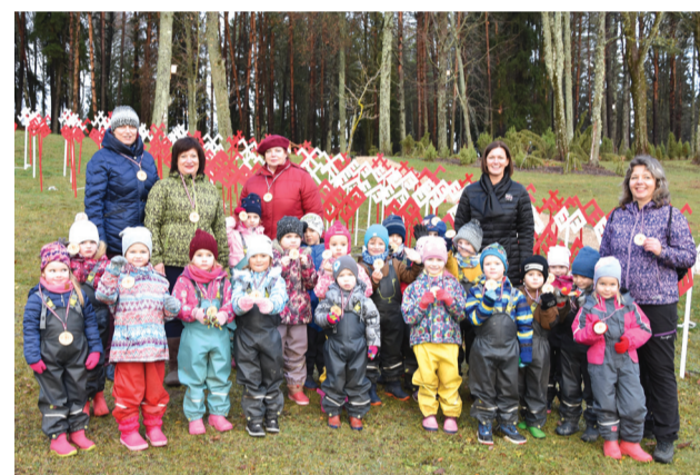
Latvijai 100 gadi – Sprīdīšiem 100 kilometri!