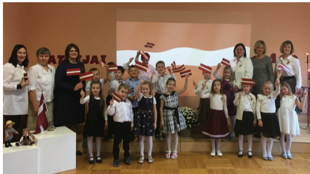
Mirkļi pēc svētku koncerta Jāņmuižā

Mēs zinām, ka Latvija esam mēs paši, un Latvijas dzimšanas dienu gaidījām, plānojām un svinējām gluži kā savējo.