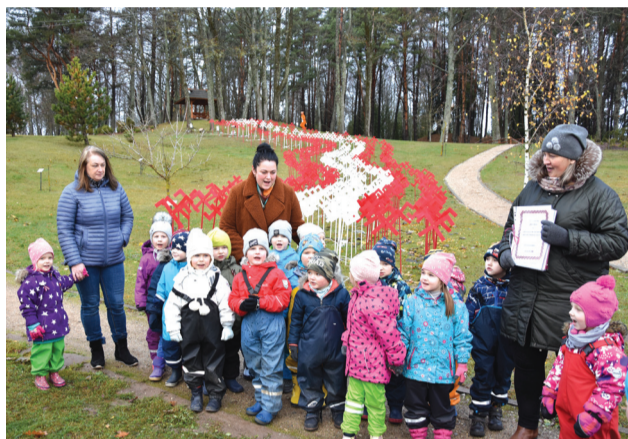
PII "Mežmaliņa" Rūķu grupas dāvāna Latvijai "Labo darbu un laba vēlējumu grāmata"