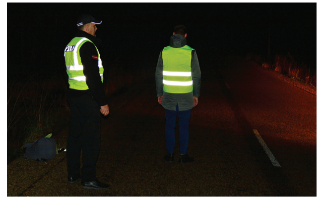
Ar spožām gaismu atstarojošām vestēm gājējus vieglāk pamanīt.

Priekuļu novada pašvaldības policijas darbinieki, diennakts tumšajā laikā patrulējot Priekuļu novada teritorijā, sastapa vairākus neredzamos kājāmgājējus bez gaismu atstarojošiem elementiem.