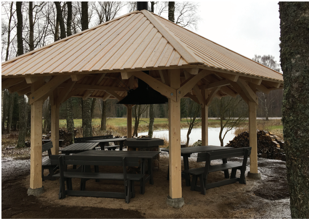
Lapene ar pavarda vietu E. Veidenbauma memoriālajā muzejā “Kalāči”.

15.novembrī norisinājās pirmais pasākums jaunajā “Kalāču” lapenē. Pasākums notika projektam “Saieta vietas izveide ģimenēm draudzīgas vides veidošanai un pozitīvas līdzdalības attieksmes veicināšanā Priekuļu novadā” Nr.2/GIMEN/18/009 ietvaros, kas tika apstiprināts Valsts reģionālās attīstības aģentūras izsludinātajā Latvijas valsts budžeta finansētā mērķprogrammā “Ģimeņu atbalsta projektu konkurss pašvaldībām sadarbībā ar NVO”.