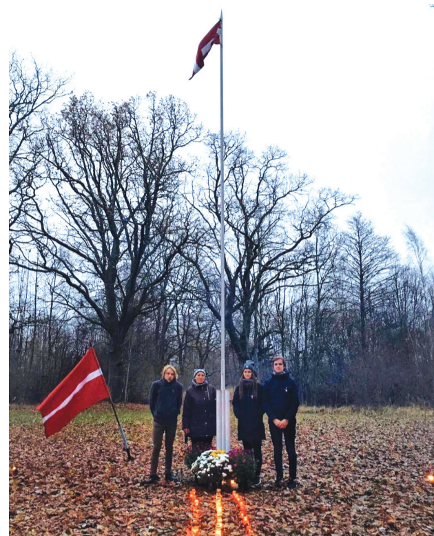
Veselavas pagasta "Pintuļos" ievērojamā latviešu nacionālā karoga autora Jāņa Lapiņa un Lāčplēša dienai veltīts piemiņas brīdis.