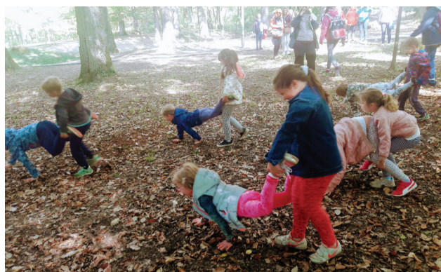
Āra aktivitātes “Forest school” (“Meža skolā”) Zagrebā.

Projekta dalībnieku tikšanās reizē Zagrebā īpaša diena tika atvēlēta, lai iepazītos ar Horvātijas izglītības sistēmu. Klausoties izglītības nodaļas galvenās speciālistes stāstījumā, sadzirdējām 2 būtiskas atšķirības. Pirmā – pirmsskolas izglītības iestādes Horvātijā darbu uzsāk plkst.6.00, darba diena ilgst līdz plkst. 21.00, taču bērns drīkst uzturēties bērnudārzā ne ilgāk par 10 stundām. Šis ir labs