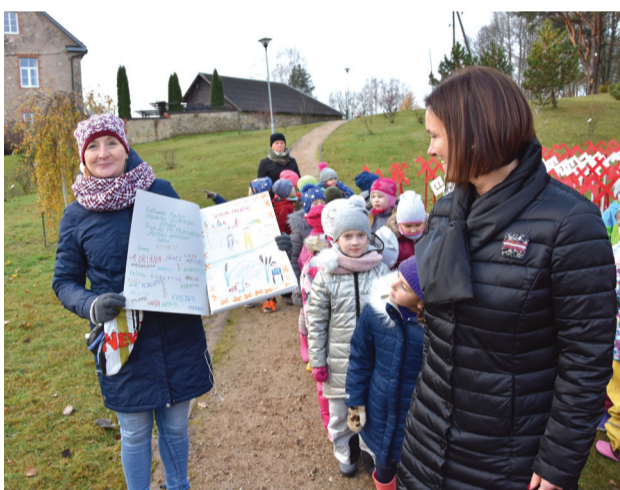
PII "Mežmaliņa" Pūcītes Skoliņas bērni uzzīmēja ilustrācijas vairāk kā 100 pasakām un izveidoja grāmatu ar 100 lappusēm.