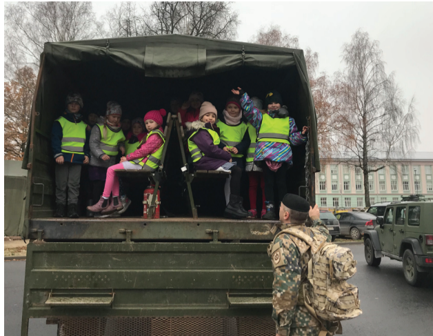
5. grupas bērni izmēģina NBS Instruktoru skolas transportu

Latvijas simtgades noskaņās dzīvojām visu gadu. Kopš septembra mums bija apņemšanās – par godu Latvijas 100. dzimšanas dienai visai bērnudārza saimei līdz 18.11.2018. apiet 100 apļus ap Jāņmuižas stadionu. Apļojot domājām stīpras un mīlas domas par mūsu Latviju.