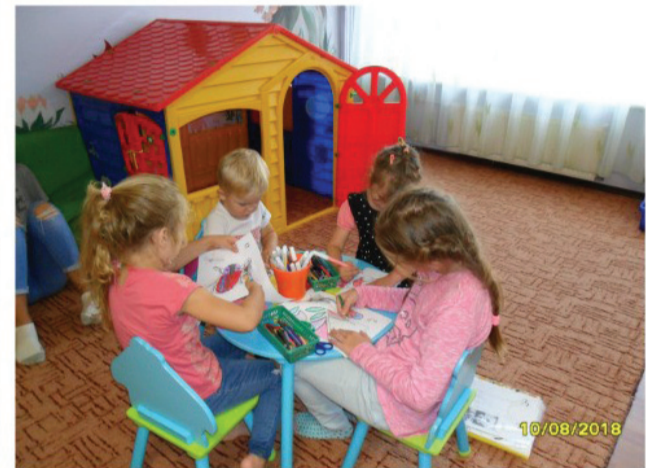
Kopā mācāmies, spēlējamies un draudzējamies “Zīlūka” rotaļu telpā.

2018. gada jūlijā apritēja 12 gadi kopš centra “Zīlūks” dibināšanas. Tas nav ne maz, ne daudz, vien savās domās un sajūtās zinām, cik tas ir bijis nozīmīgs laiks gan mums, gan arī bērniem un vecākiem, kuri kaut reizi bijuši dienas centrā un kuplīnājuši mūsu pulciņu.