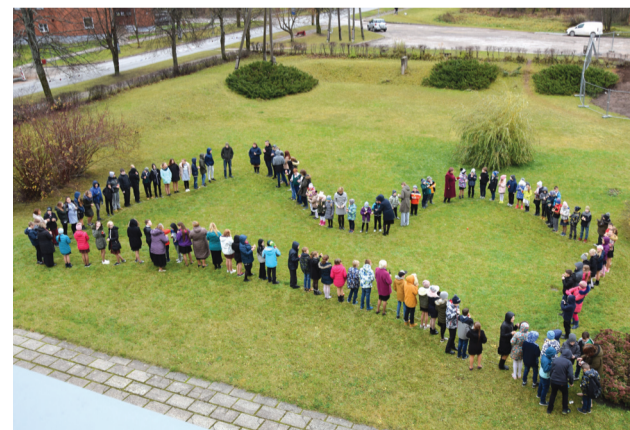
Mana Latvija Liepas pamatskolā.

Priekuļu novada pašvaldības informatīvais izdevums "Priekuļu novada vēstis". Bez maksas izdevums. Iznāk reizi mēnesī. Metiens – 2000. Izdevējs: Priekuļu novada pašvaldība, Cēsu prospekts 5, Priekuļi, Priekuļu pag., Priekuļu nov. Tālr. 64107871. Kontaktinformācija: Priekuļu novada pašvaldības