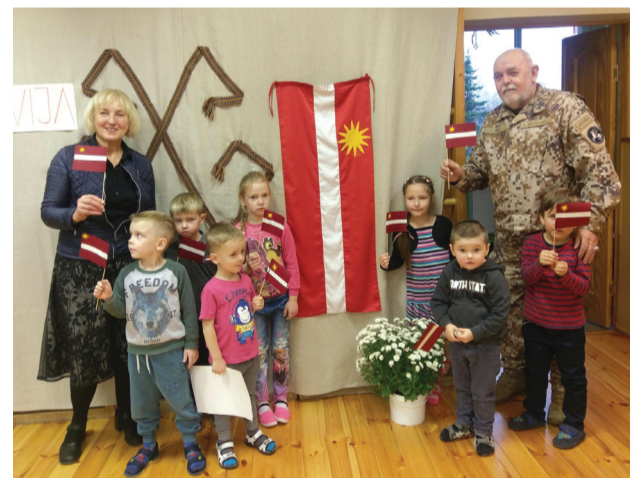
Par Latvijas nacionālo karogu uzzināja vairāk Veselavas PII bērni.