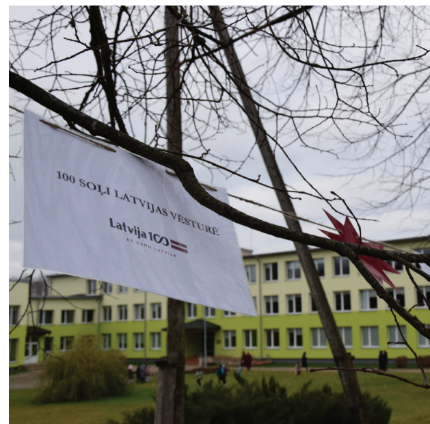
Vēstures liecību ķēde no Latvijas pirmsākumiem līdz šodienai “100 fakti par Latviju”