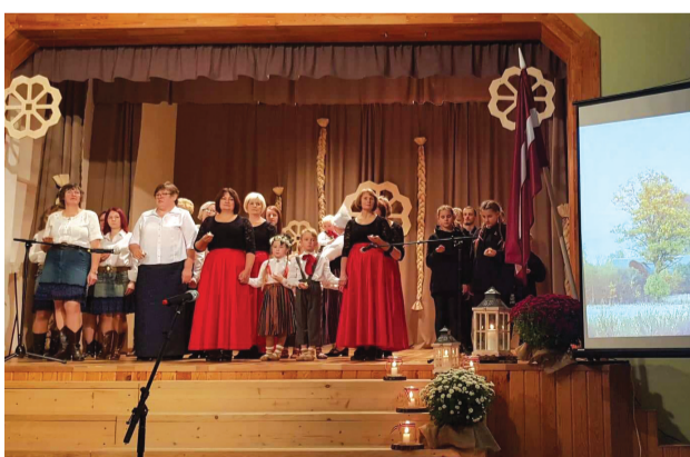
"No saknēm līdz saules staram" Mārsnēnos.