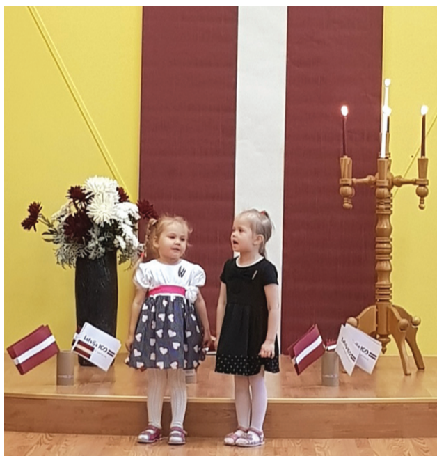
Liepas PII "Saulīte" Latvijas simtgadi sagaidot.