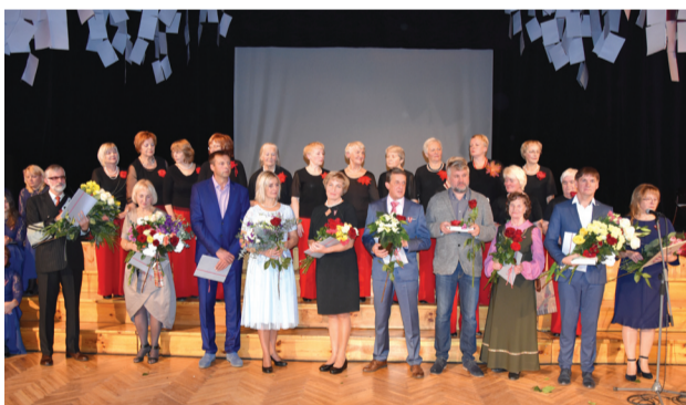
Priekuļu novadnieku godināšana valsts simtgades svētkos Priekuļos