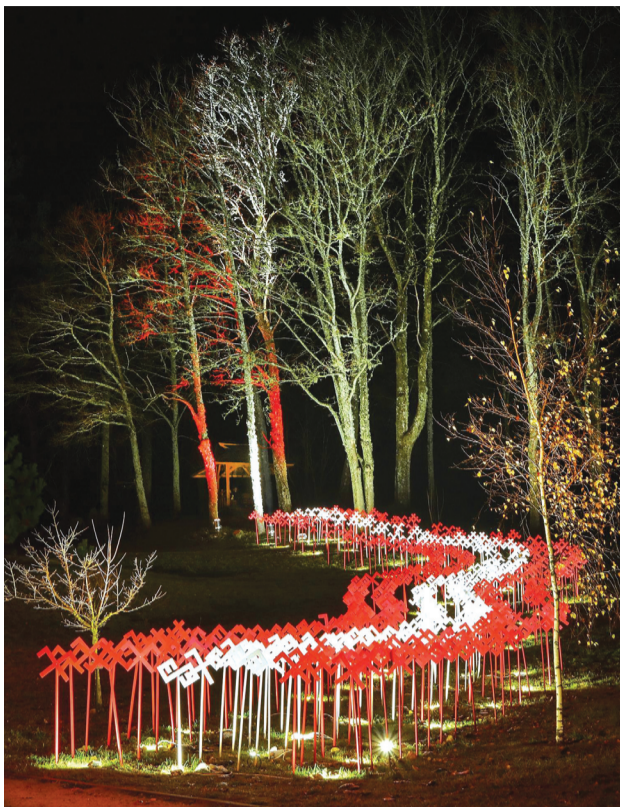
Vides instalācija Latvijas karoga krāsās "Gaismas ceļš" Saules parkā Priekuļos.