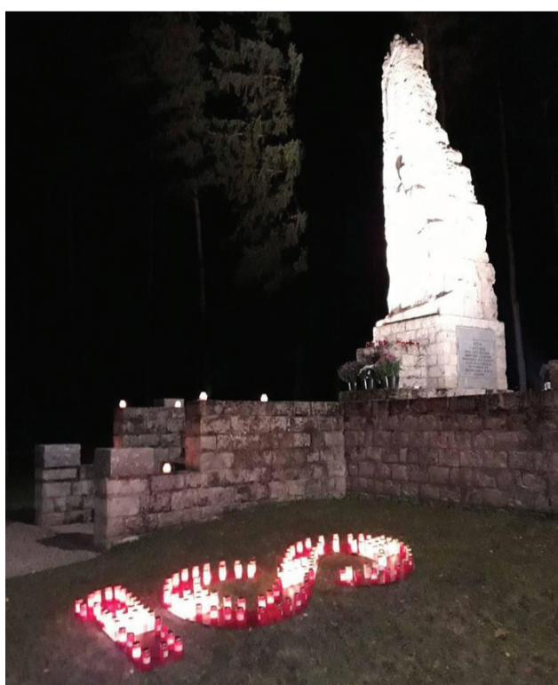
Latvijai 100!