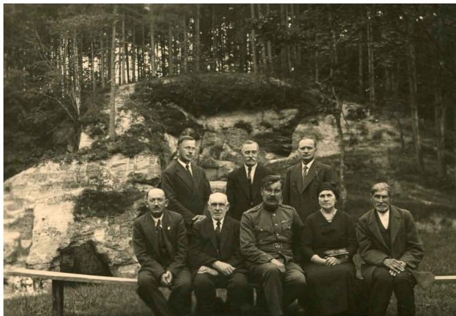
1919. gada pieminekļa dibināšanas komiteja pie Lielās Ellītes