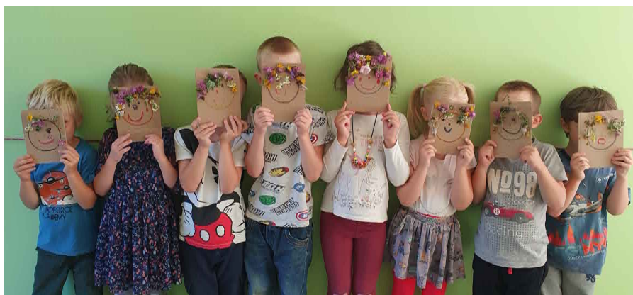
Puķu bērni.

Vasara pagājusi, iestādē veicot apjomīgus remontdarbus. “Bitiņu” grupas bērni, darbinieki un bērnu vecāki būs priecīgi par izremontētajām telpām. Gan grupas ģērbtuve, gan nodarbinību telpa un guļamistaba ieguvušas gaišumu un mājīgumu, jaunu elpu. Par to paldies rūpīgajiem SIA Reabūve meistariem. Atliek tikai iekārtot telpas, gaidīt mūsu bērnus un visiem čakli mācīties, rotaļāties, satikt draugus.