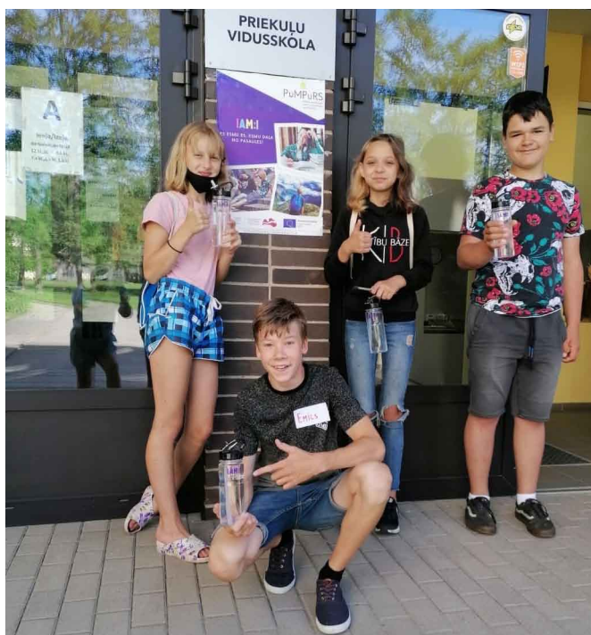
Priekuļu vidusskolas jaunieši.