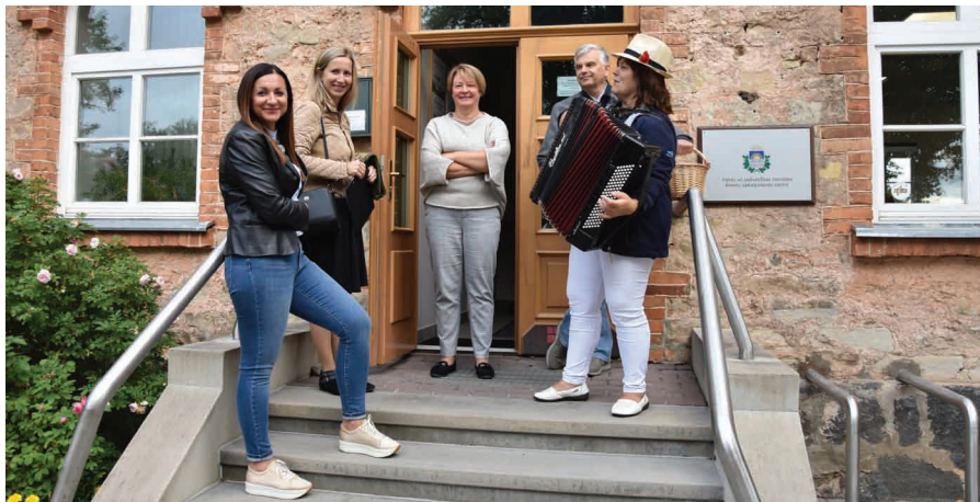
Priekuļu apvienības pārvaldē viesus sagaida ar mūziku.

Visās apmeklētajās iestādēs Cēsu novada pašvaldības vadība ar interesi iepazīs ar iestāžu ikdienas darbu, izaicinājumiem, sasniegumiem, uzdeva jautājumus un atzina, ka katrā redzētajā vietā paveikts daudz.