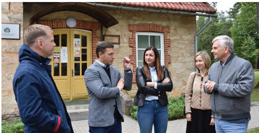
Pie ieejas Liepas pagasta pārvaldē.