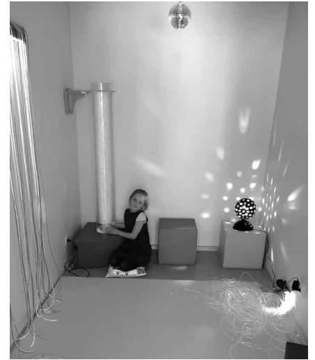
Multisensorās istabas iekārtojums

Savukārt bērni, kuri kļūst aktīvi, staigā no vienas iekārtas pie otras, neapsēžas ne uz mirkli, no mīkstajiem kubiem izveido torni, izmanto bumbas ar dažādiem reljefiem, runā ar skolotāju, ja tā ir līdzās, stāsta par asociācijām ar katru no lampām. Daži pat pastāsta kādu spoku stāstu. Citi dzied līdzī melodijai vai izdomā paši savu. Arī “Mežmaliņas” darbiniekiem bija iespēja izbaudīt sensorās istabas piedāvātās iespējas. Dažs sajūtās relaksējies un atpūties, citam traucēja kāda konkrēta gaisma vai lampu vibrācija, bet kopumā visi bija apmierināti un ar pozitīvām emocijām piepildīti.