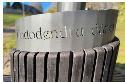
Jaunais vides objekts Saules parkā Priekuļos.