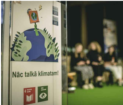
Ekoskolu pasākums Rīgā.