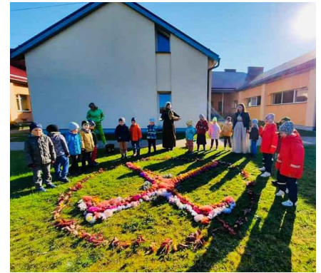
Miķeļu simbols – Jumis.

4.grupas bērni svētku dienā bija atnesuši daudz krāšņu rudens ziedu. Kā pateicība dabai par tās bagātīgajām veltēm no ziediem tika veidots Miķeļu simbols – Jumis. Tas ir auglības un svētības nesējs,