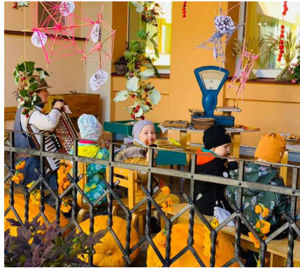
3.grupa Miķeļdienas tējniecā.