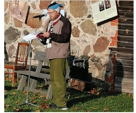
Igauņu dzejnieks Contra.

Dzejas svinēšanu noslēdzām ar sarīkojumu E.Veidenbauma dzimšanas dienai par godu. Katru gadu tas notiek oktobra pirmajā svētdienā, šogad tā bija tieši E. Veidenbauma dzimšanas diena. Daba šajā svētku dienā visiem dzejnieka mīļotājiem bija dāvinājusi īpaši skaistu rudens dienu. Uz sarīkojumu bija sabraukuši tuvi un tāli viesi no visas Latvijas.